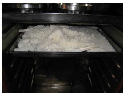
图 8 学校剩饭情况图

(2) “浪费情况”项得 3 分, 理由是调查当天 (周五), 学生就餐完毕后, 调查人发现在该校的蒸饭机中还剩有一蒸盘的米饭。