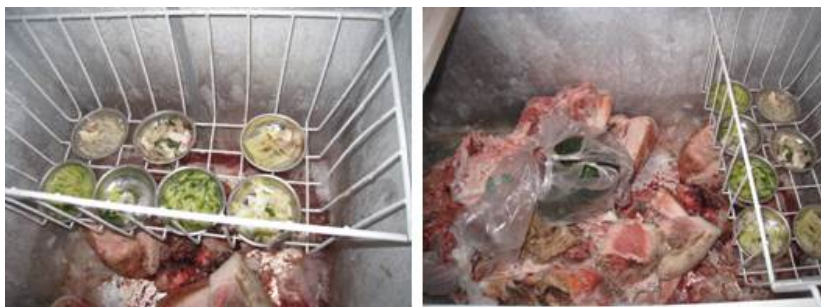
图5 食材存储及菜品留样情况组图

(4) “食材储藏”项得3分,理由是该校的留样菜品未做覆膜等操作,且和生肉无隔离放在一起。存在卫生安全隐患。