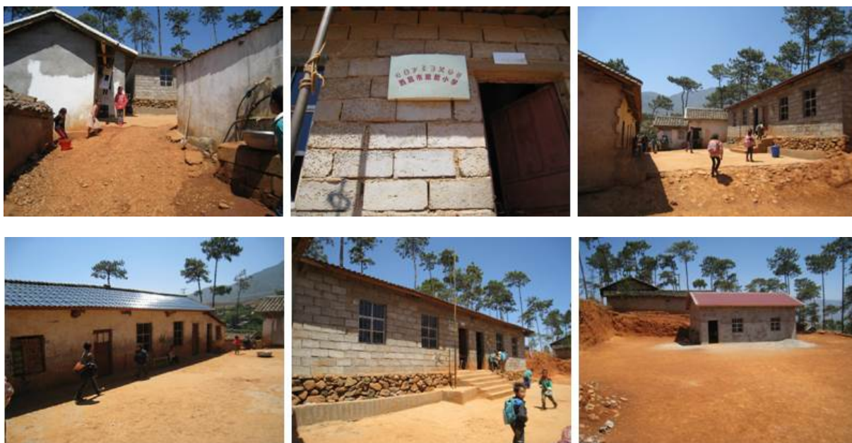
图 1 学校内、外景图