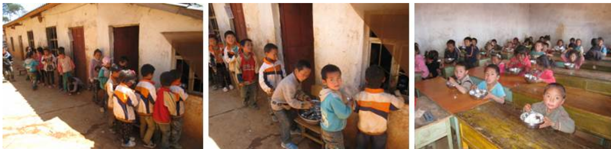
图 7 学生排队、领餐和用餐组图

调查人在校期间,查看了厨师的健康证,在有效期内。在厨房查看了该校的蒸饭机和冰箱等设备,均使用正常。查看了该校的菜品留样,但未看到留样记录。教师无专门餐厅,有自己的餐具,学生用餐完毕后,老师们在厨房隔壁的简陋教室中就餐。餐后,调查人观察了学生的整个用餐过程,未发现有学生有明显倾倒饭菜情况。该校的就餐情况是,中午下课后,学生直接到厨房分餐口排队,自行领取餐勺后领餐,盛饭后在教室或校园内零散就餐。就餐完毕后,学生自行清洗餐具,然后将餐具统一交到厨房,由厨师统一保管。