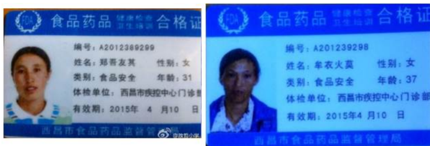
图 9 厨师健康证组图

注: 关于健康证问题的说明, 调查人到校的 4 月 11 日当天, 在校内未看到厨师健康证, 当时牟尔体校长解释说正在办理, 到撰写本报告时, 调查人在该校的微博上已看到该校厨师的健康证已经办理完毕。故在本项考核的“健康证”一项不做扣分。