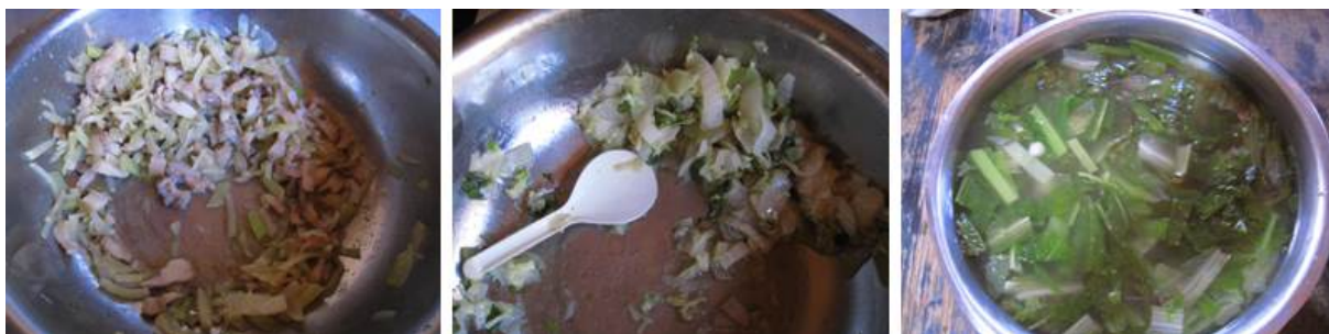
图 6 当天菜品组图