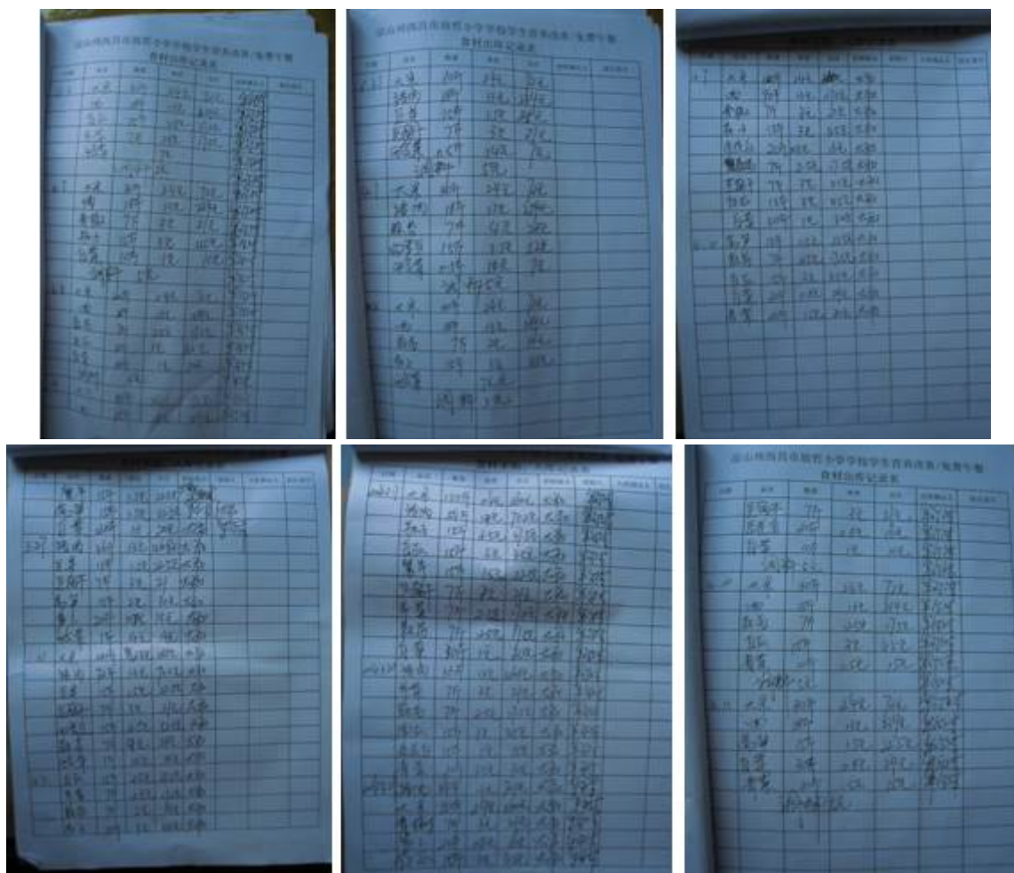
图 10 该校账目管理相关登记表组图

由于该校其他教师均为短期支教老师，长期驻守此校的仅有牟尔体校长一人，因此项目的钱和账都由其一人操作。