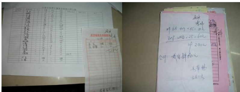
图 19 原始凭证

关于其他情况说明: 该校采购价格合理, 账务上建议针对食材库存进出的签收加强管理和监督。