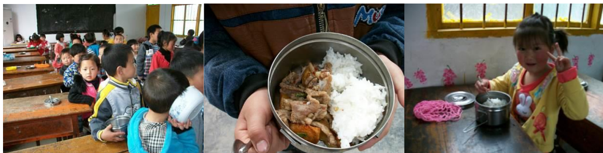
图 12 学前班（幼儿园）当日用餐