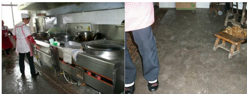
图 3 地面

(5) “易变质食物保存”取 5 分, 原因为: 使用冰柜, 妥善保管, 荤素分开存放无污染。