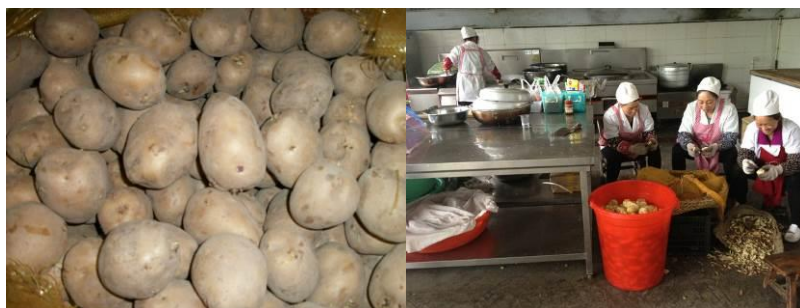
图 6 发芽土豆在使用