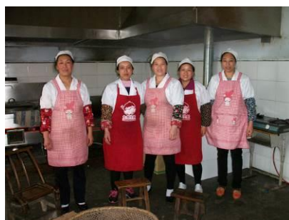
图 8 厨师合照（5人）