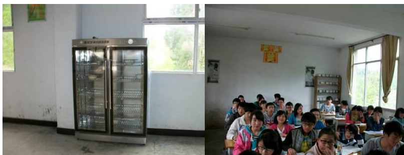
图 4 位于餐厅被闲置的消毒柜