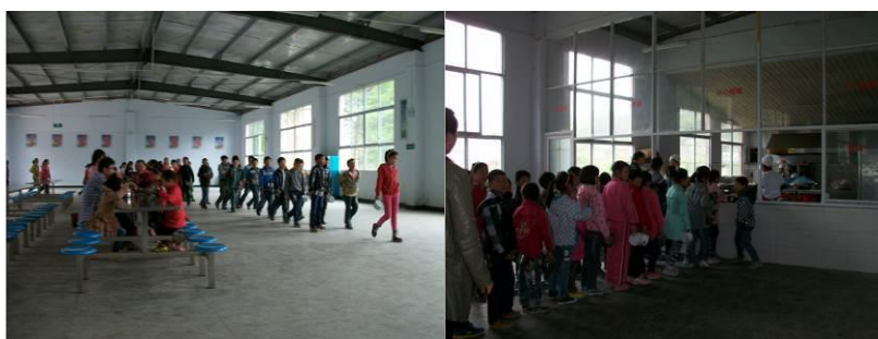
图 17 有序排队 (餐厅内)