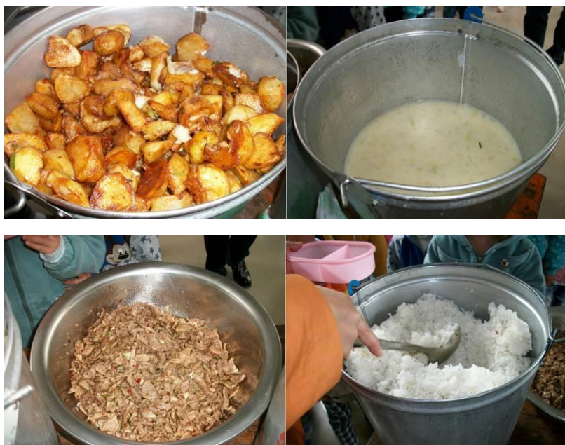
图 10 学前班（幼儿园）当日供餐

(5) “饭菜异物”取 5 分，原因为：就调查人员当日同餐情况，未发现饭菜内存有异物。