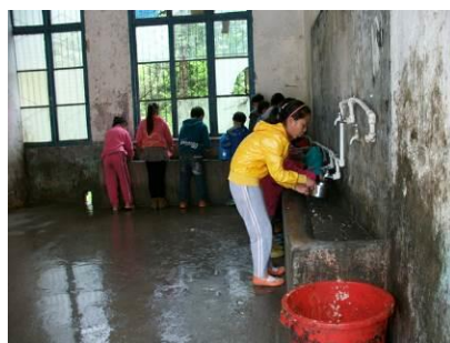
图 18 洗碗