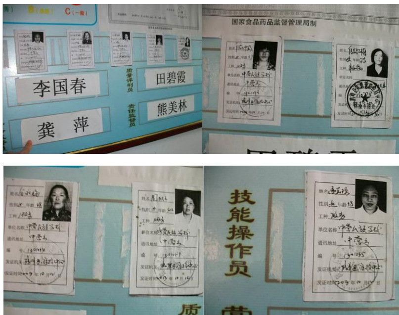
图 14 厨师健康证

(5) “浪费情况”取 5 分, 原因为: 饭后, 调查人员在餐厅旁洗碗的水槽边站了很久, 所见孩子绝大部分以光盘的状态从餐厅过来, 餐余极少, 作为 500 人的大学校, 此种情况极为罕见。调查人员就此向该校老师了解原因, 据老师介绍, 杜绝浪费学校从几个方面下手, 一是各班级平时由带班老师反复强调教育, 二是分餐时厨师会根据学生的需求和喜好进行分餐, 三是餐厅门口会设有值班老师和学生对餐后离开的同学进行检查, 对未光盘者将进行批评教育。