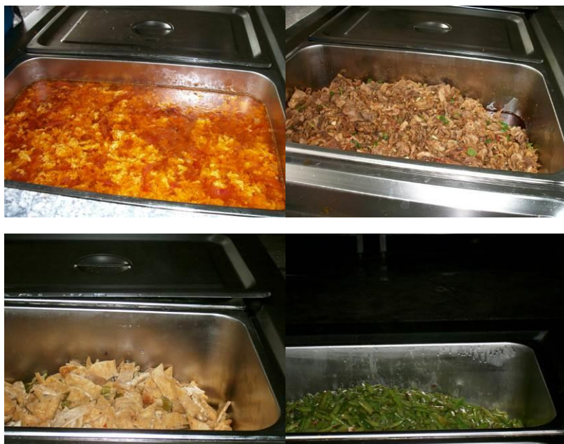
图 11 中小学师生当日供餐