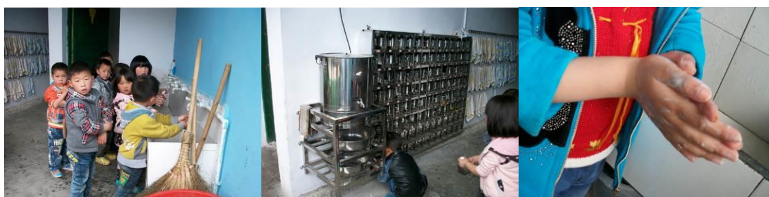
图 7 学前班（幼儿园）餐前洗手