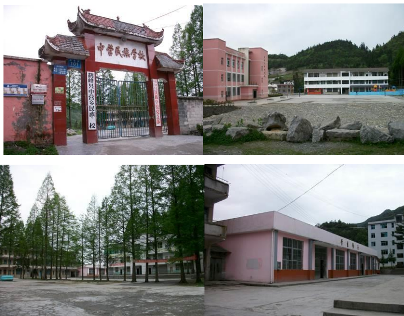
图 1 学校

中营民族学校，位于湖北省恩施州鹤峰县中营镇中营乡，设有学前班和 1-9 年级(小学及初中)，关于免费午餐工作的分工，学校在教务繁忙的情况下，仍然做了较为详尽的安排：田付勇、陈明斌两人负责轮流采购并填单交保管员熊美林，熊美林负责抽查、复核及保管，龚萍负责记账及付款，校长秦伟负责监督及审核。