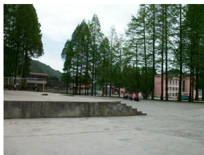
图 16 有序排队 (从课室到餐厅)