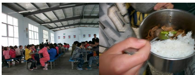
图 13 中小学师生当日用餐