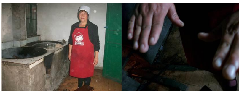
图 4 厨师

(10)“餐前洗手”取 5 分, 原因为: 孩子们下课后会自觉到餐厅旁的水槽洗手。