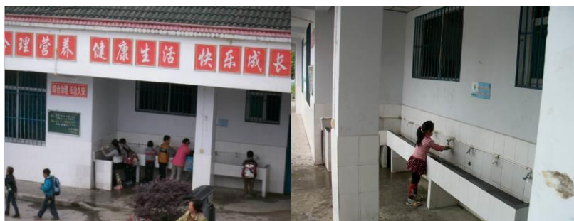
图 11 餐前洗手