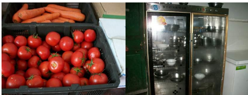
图 9 将存至的西红柿（调查日为周五）