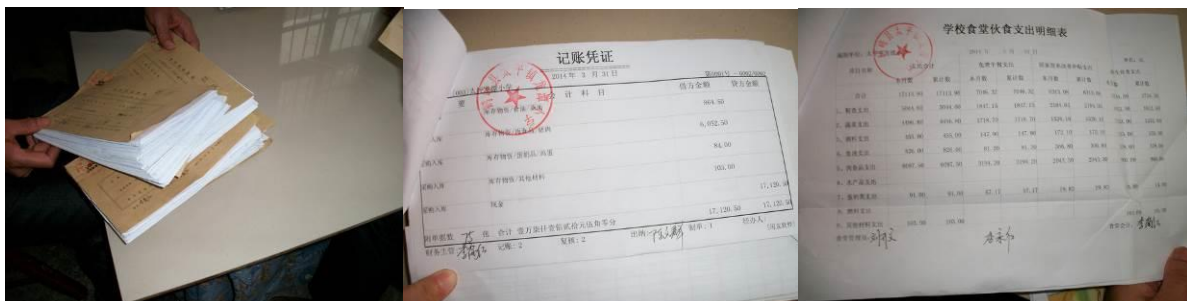
图 20 记账凭证