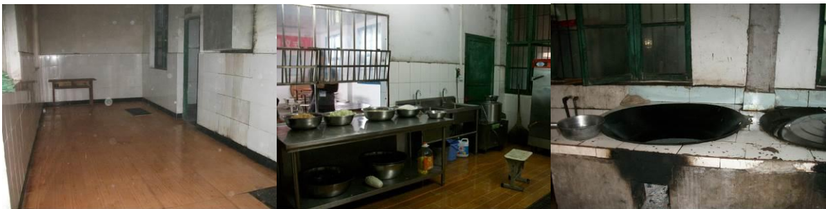
图 8 地面、工作台、灶台