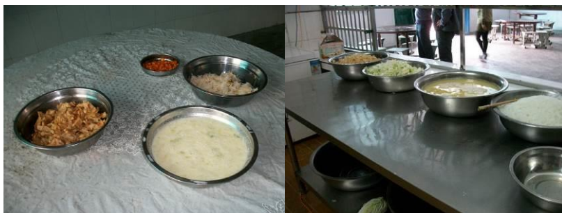
图 12 当日午餐供餐

(5) “饭菜异物”取 5 分, 原因为: 就调查当日用餐情况反映, 没有发现饭餐中有异物。