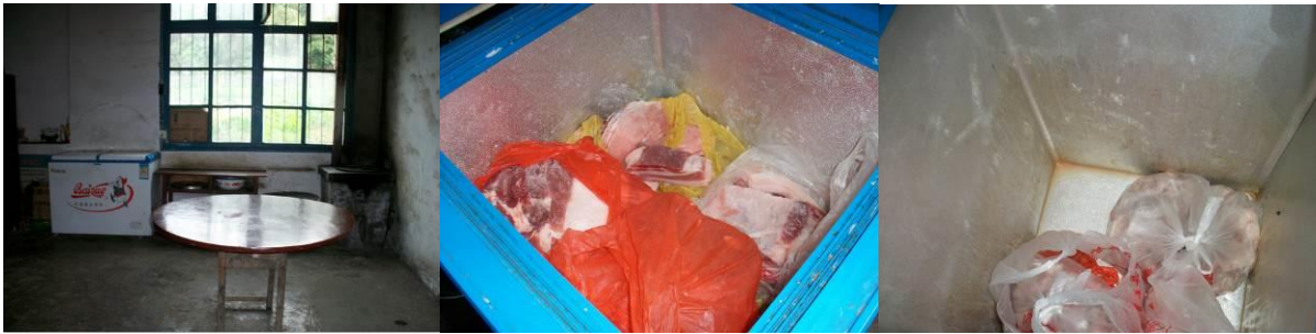
图 7 冰柜（放置于教师晚餐餐厅，生食专用）