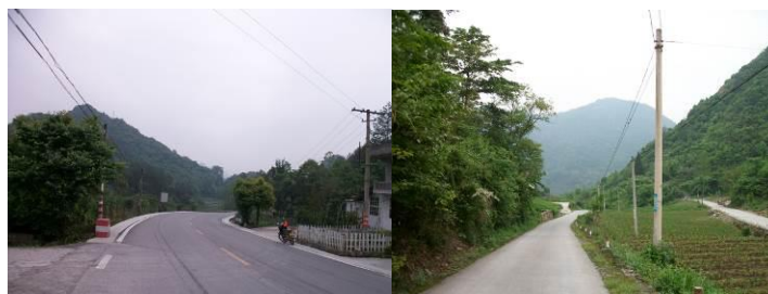
图 1 路况

太平乡龙潭小学，位于鹤峰县太平乡，从鹤峰往太平方向，需在半路的四坪下车，步行前往龙潭小学，该校每日供餐的时间如下：8:00（早餐）、12:10（午餐）、16:30（晚餐）。据李永红校长介绍，该校设有采购 2 人（张南鹤、徐波），采购每周进行 2 次，采购完成后，食材交保管员（刘开文），采购单据交出纳（陈文群）。食材入库由保管员（刘开文）确认，食材出库由厨师（何翠秀）确认。出纳（陈文群）收到采购交来的单据后，会整理后提交给会计（李裔红），等全套账务处理完，并且没有问题，出纳才会将资金给予采购员，也因此，该校一直处于垫支采购的状况。校长李永红负责整个流程的监督与审核。