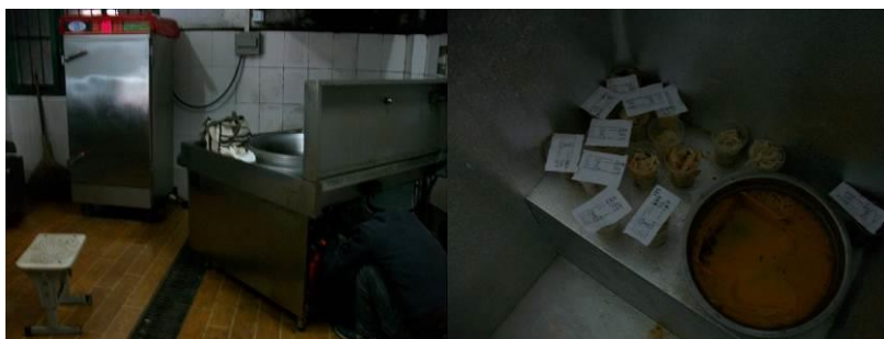
图 15 电灶维修中