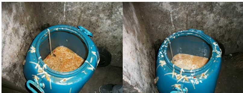
图 19 餐余