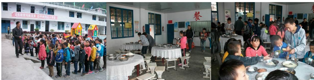
图 18 用餐