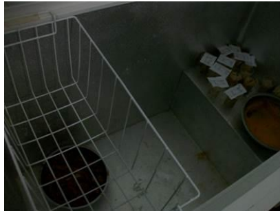
图 6 冰柜（放置于厨房，熟食专用）