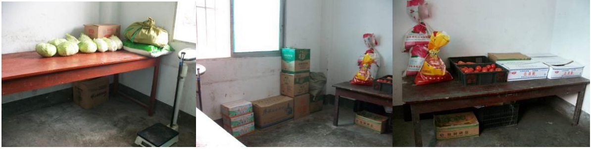
图 5 储藏室