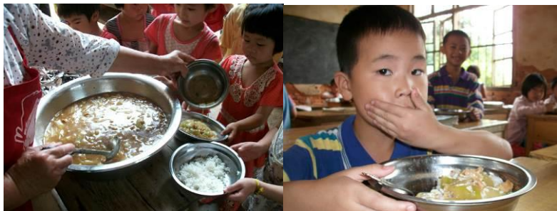
图 13 当日午餐供餐

(5) “饭菜异物”取 5 分, 原因为: 调查人员当日与师生同餐, 没有发现饭菜中有异物。