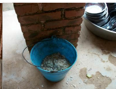
图 17 餐余