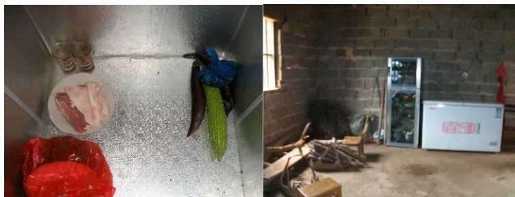
图 6 生熟混放