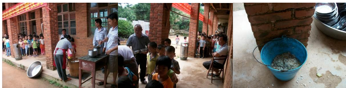
图 16 分餐秩序