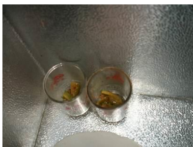
图 14 食品留样