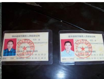
图 15 厨师健康证