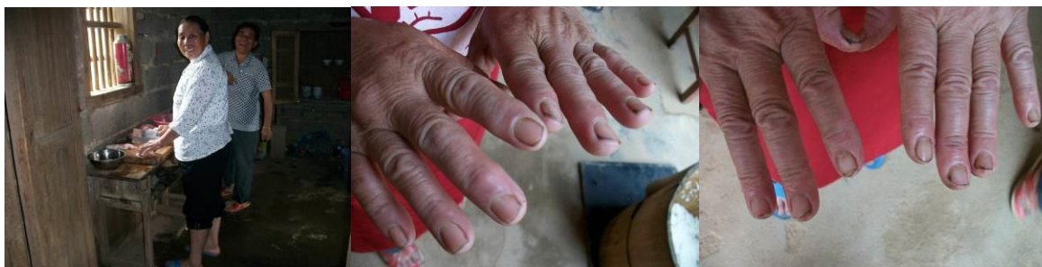
图 5 厨师

(5) “餐前洗手”取 5 分, 原因为: 就调查人员现场所见, 下课后, 孩子们自觉到学校门口的水槽洗手。