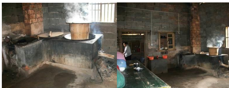
图 8 厨房