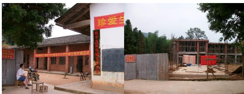
图 2 学校