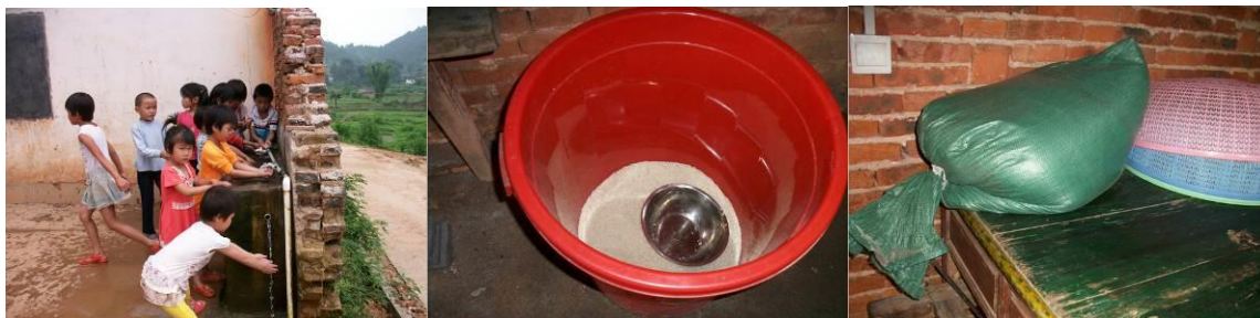
图 11 餐前洗手