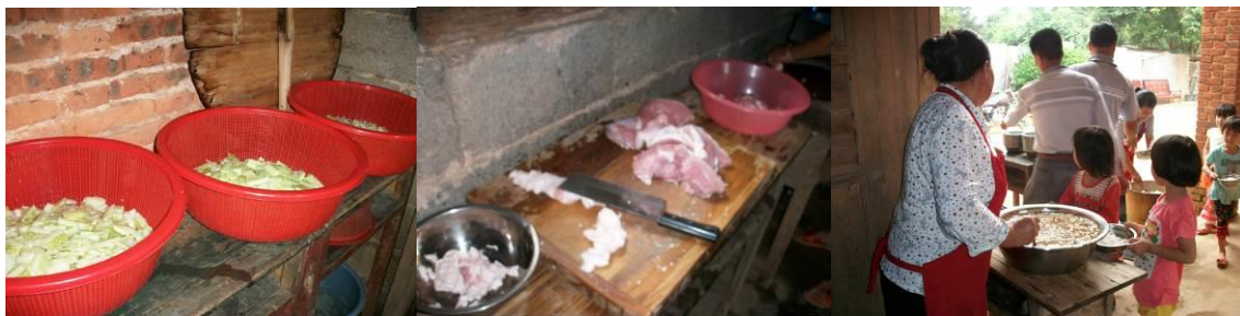
图 9 烹饪前备料