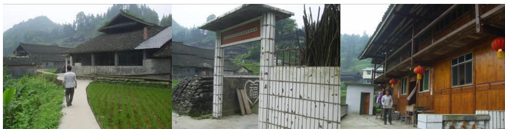
图 6 吴老师的家就是目前学校的临时食堂组图