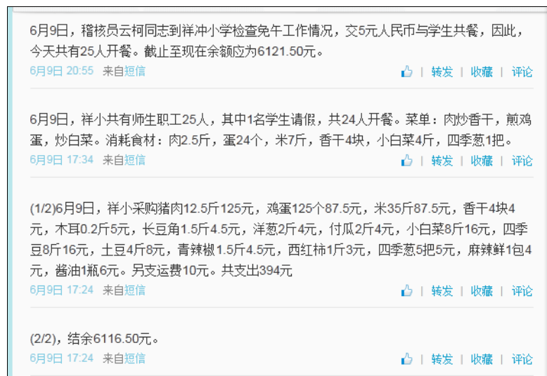
图 8 就餐人数的微博截图

当日就餐人数: 学生 22 人 (1 人请假) + 厨师 1 人 + 老师 1 人 + 稽核员 1 人 = 25 人 (稽核员缴餐费 5 元)。实际用餐人数与该校微博公示内容一致。