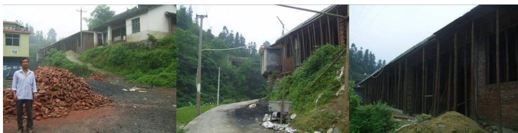
图 7 改建中的新校舍组图