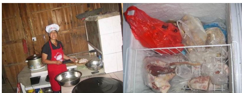
图 11 厨师着装工作图