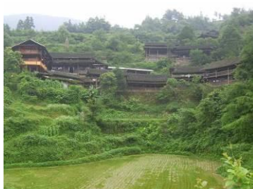
图 2 侗族人家传统的木式吊角楼图

新晃位于湖南省最西部, 沅水支流舞水的中游, 总面积 1508 平方公里, 东部与芷江县接壤, 南、西、北三面分别与贵州省天柱、镇远及万山特区为邻。全县辖新晃镇、中寨镇、碧朗乡和米贝苗族乡等 7 个镇、14 个乡、2 个民族乡。1984 年被列入国家首批对外开放县, 1998 年被列为怀化市优先发展“一体两翼”中的一翼。