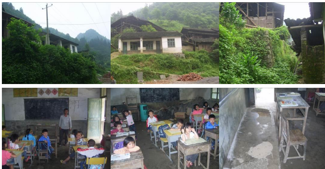
图 3 目前学校学生学习环境组图

该校现有 2 个年级,教学班 3 个,为一、二年级和学前班,共有学生 23 人,教师 1 人,厨师 1 人。