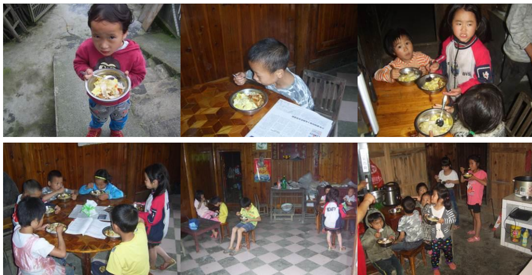
图 23 学生用餐组图