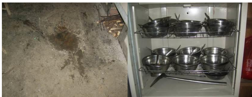
图 15 地面很旧但干净整洁 图 16 学生餐具统一由厨师清洗后在消毒柜消毒