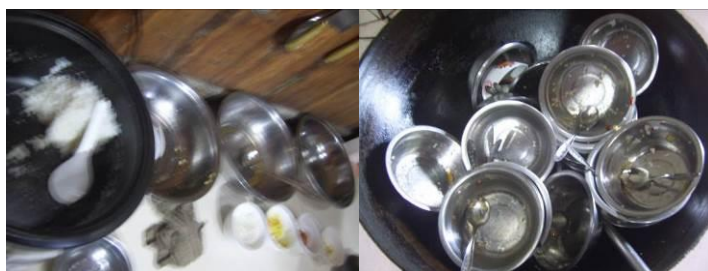
图 25 剩菜剩饭组图 (几乎没有浪费)