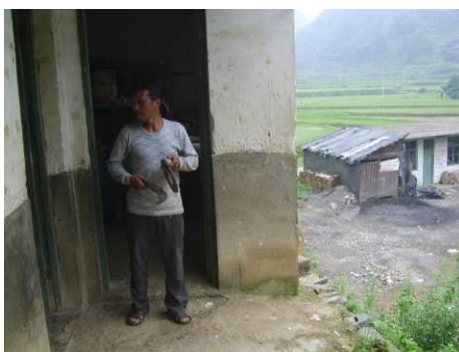
图 5 老师平时用破镰刀与铁圈敲击为学生打铃上下课图