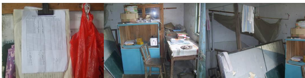
图 4 老师的办公室组图