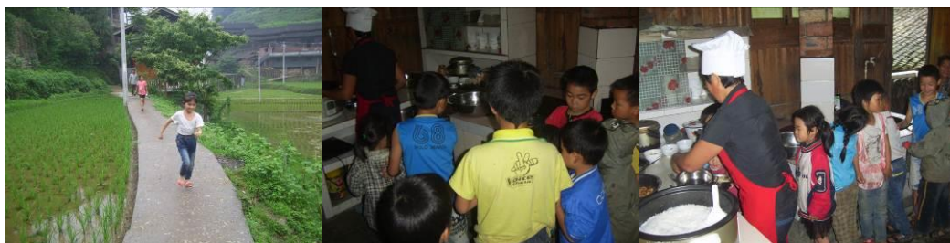
图 21 厨房设备图