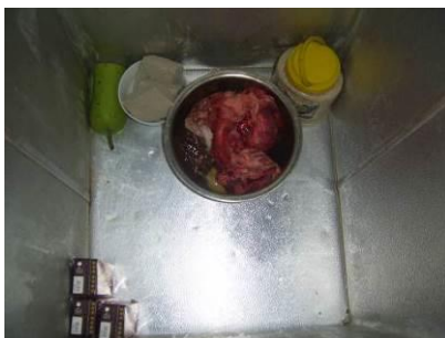
图 10 冰箱冷藏里的食物储存图

(3) “易变质食物保存”取3分,扣2分。扣分原因为冰箱冷藏里的部分食物没有隔离,直接放入冷藏(附图片)。