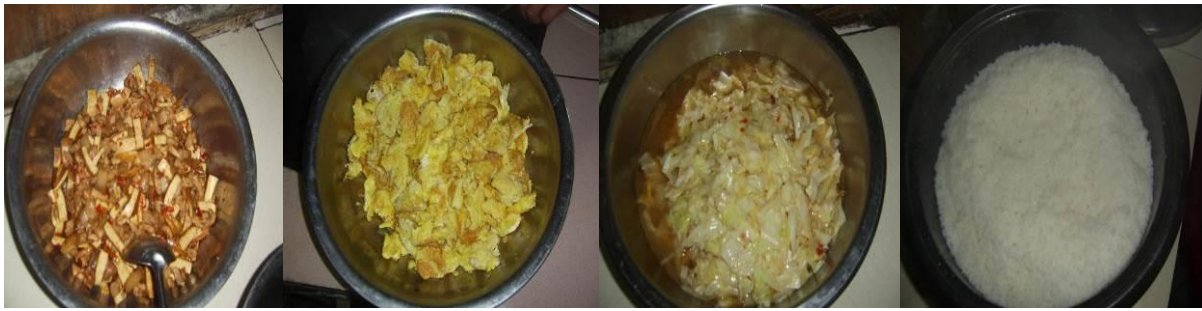
图 19 当日菜品组图