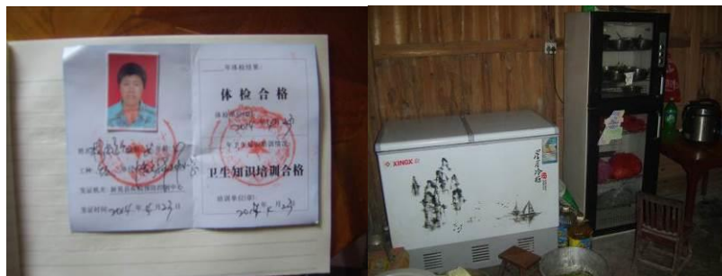
图 20 厨师健康证图