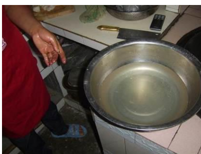
图 9 厨师的手部及穿拖鞋上班图

(1) “手部卫生”取 3 分, 扣 2 分。扣分原因为由于平时下地干活, 手上被草汁染黑, 一时洗不干净, 指甲里存有少许泥垢 (附图片)。