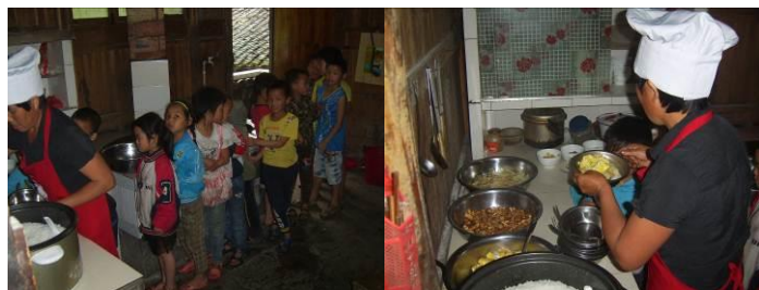
图 22 井然有序分餐组图