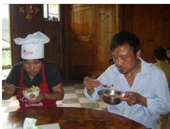
图 24 老师与学生用餐图