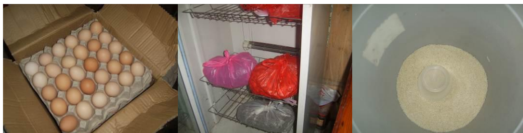
图 17 食材储藏组图 (蔬菜是本村采购, 现购现用)