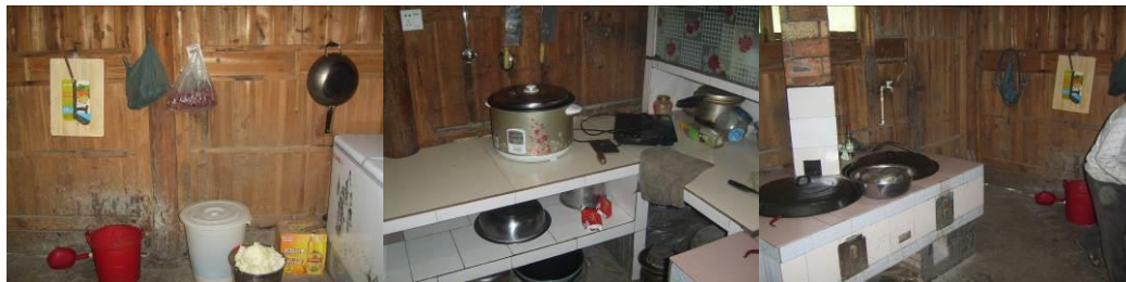
图 13 厨房工作台组图