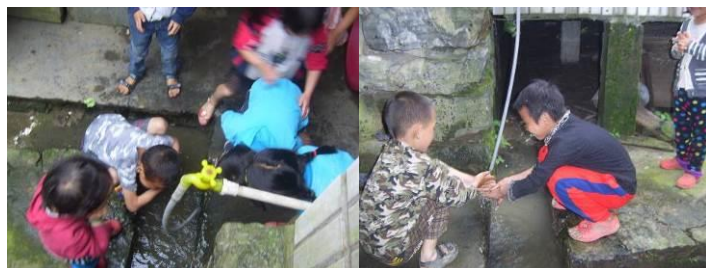
图 18 学生餐前洗手组图