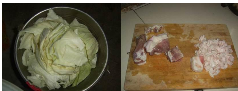
图 14 工作台生熟食分开组图