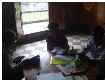
图 28 检查结束后与教职工和村干部交流图

点学校,校方克服重重困难,能做到这种程度,真是难能可贵,在此对教职工和村干部的努力表示衷心的感谢!希望校方在细节问题和制度继续加强完善。该校情况比较特殊,希望各项工作更加透明化,进一步接受社会各界的监督。