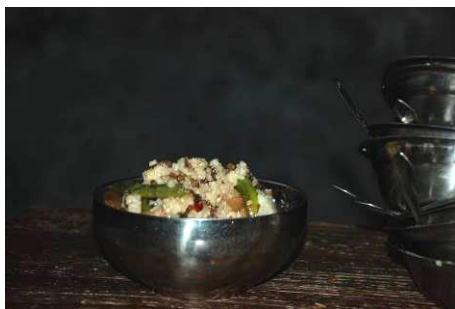
图 12 剩饭菜在正常范围