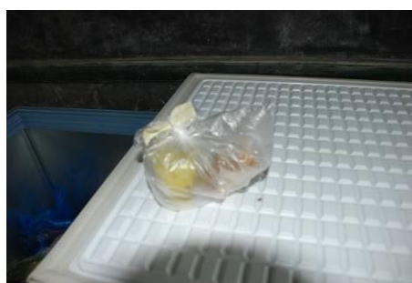
图 9 菜品留样及留样记录不合规范 (主食没有留样)