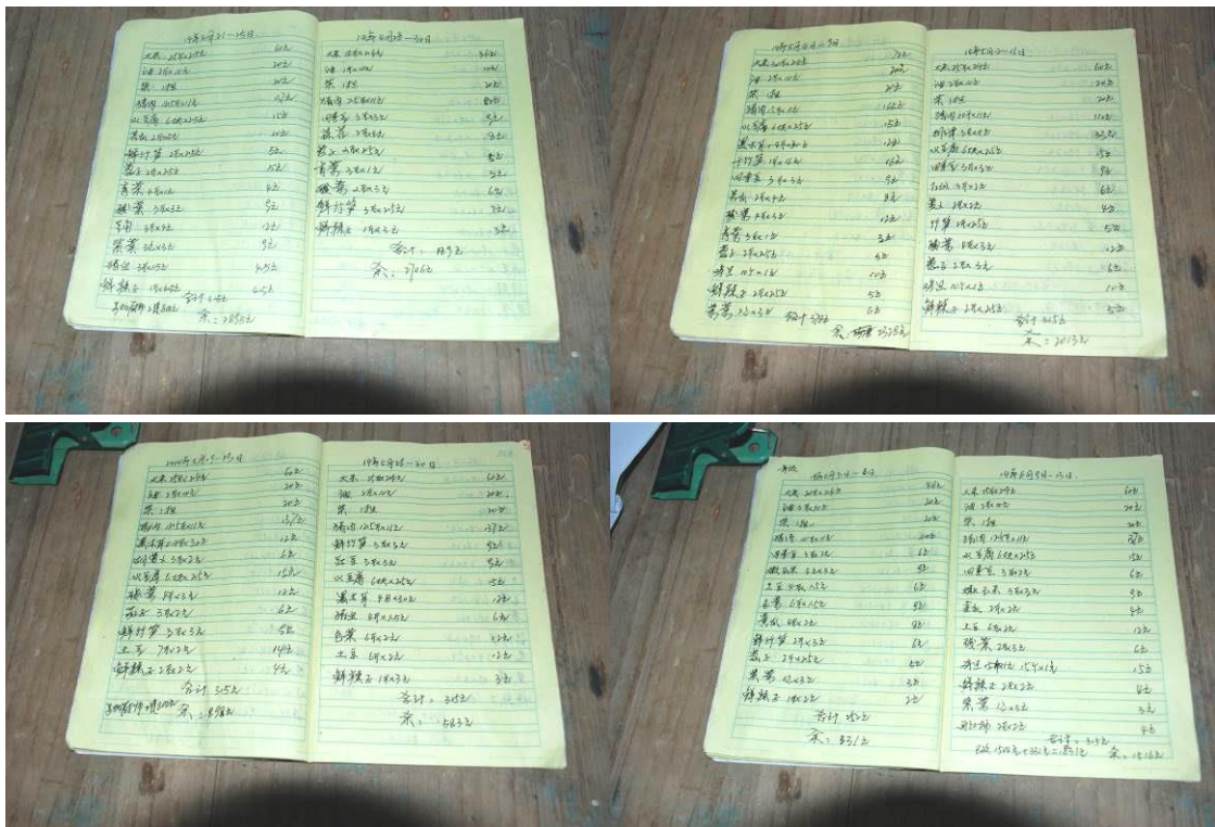
图 14 现金流水帐