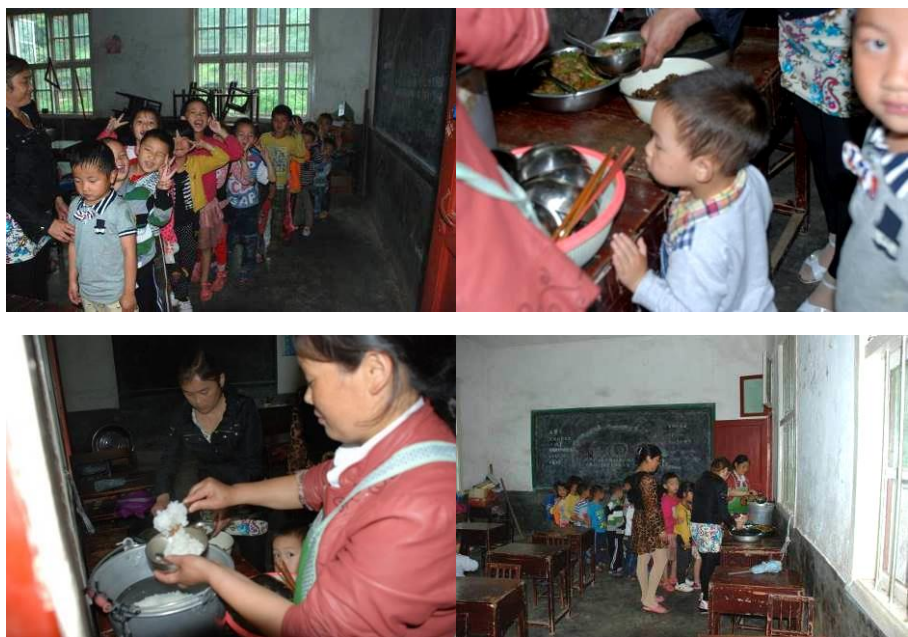
图 10 学生在教室排队分餐图组