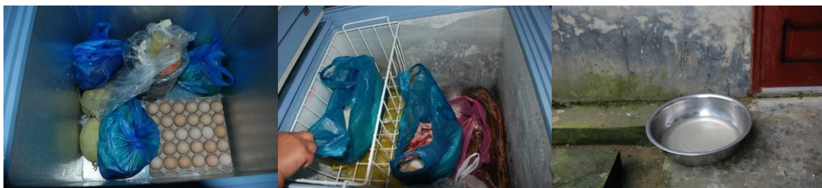
图 4 食材储存图组