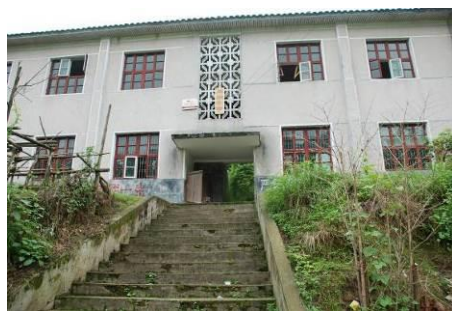
图 1 学校外观组图