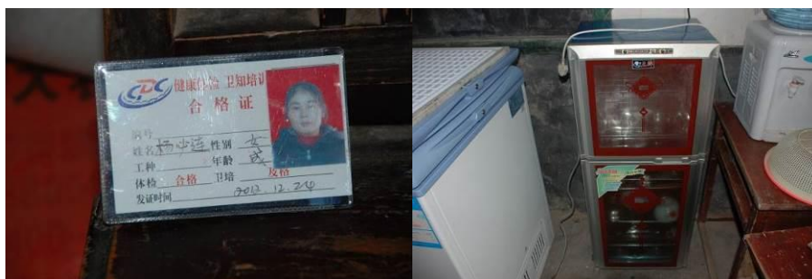
图 7 健康证已过期

(2) “菜品留样”项扣除 2 分, 扣分原因为菜品留样不合规范, 留样份量太少、没有留样记录, 主食没有留样。(见图 9)