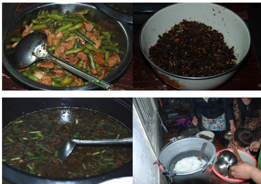
图 6 当天菜品及主食

学校当天菜品是四季豆炒肉、烧酸菜、酸菜汤，主食为米饭。菜品味道很好。(见图 6)