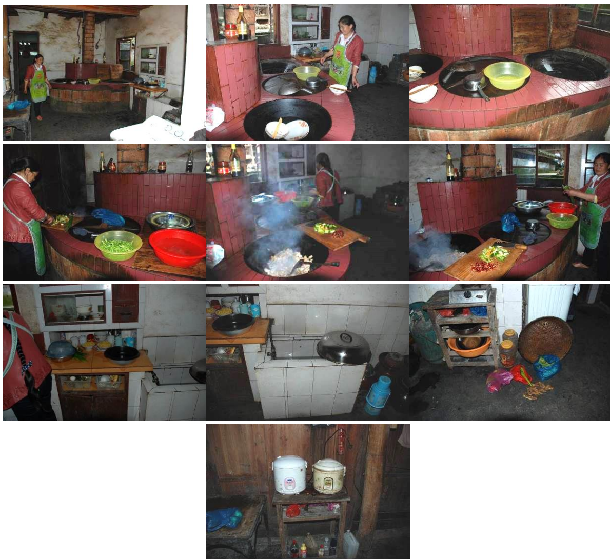
图 3 厨房及厨师图组

(3) “学生饭前洗手情况”项扣除 2 分, 扣分原因为学校没有的洗手池, 无洗手条件, 但老师打了水给学生洗手, 只有部分学生餐前洗手; (见图 5)