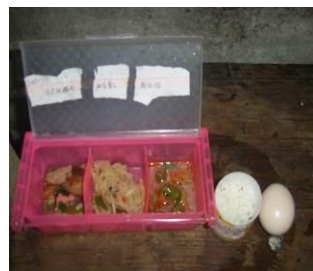
图 21 厨师健康证 图 22 厨房设备正常使用 图 23 经改进后的菜品留样