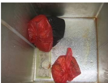
图 14 易变质食物妥善保存