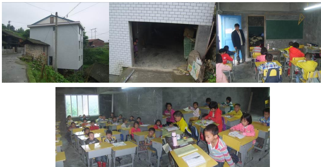
图 3 目前学校师生工作学习环境组图

该校现有 2 个年级,教学班 3 个,为一二年级和学前班,共有学生 42 人,教师 2 人,厨师 1 人。