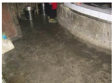
图 13 墙面地面卫生