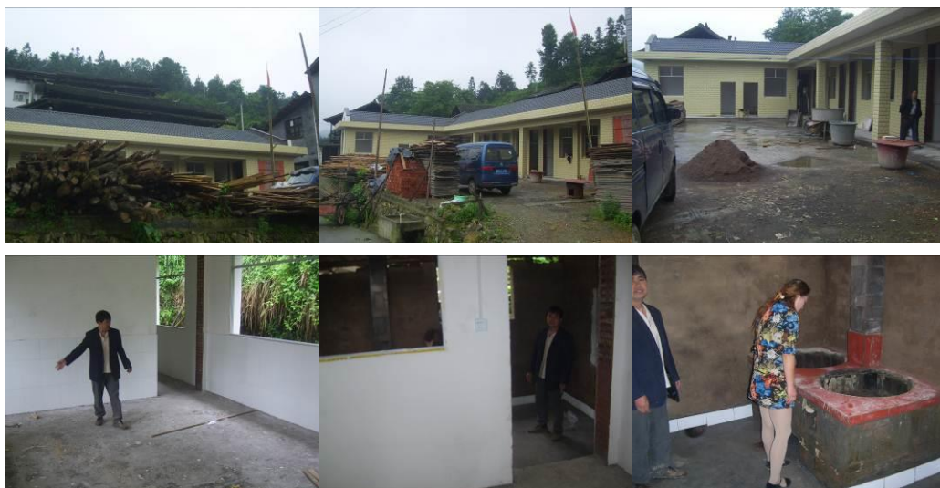
图 5 正在改建施工中的校舍组图