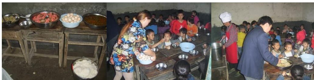
图 24 井然有序分餐