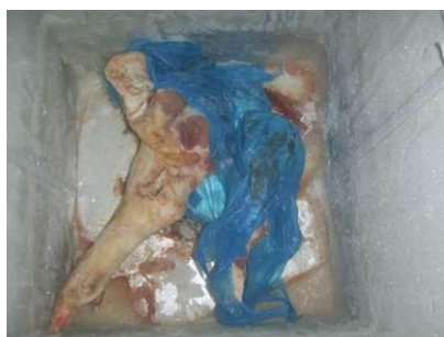
图 8 冰箱食物储存组图

(2) “生熟食存放”取 0 分, 扣 5 分。扣分原因为冰箱里有异味, 且肉类食材有包装袋放在上面, 没有包装, 存在一定的安全隐患 (附图片)。