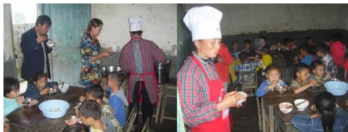
图 27 老师与学生用餐