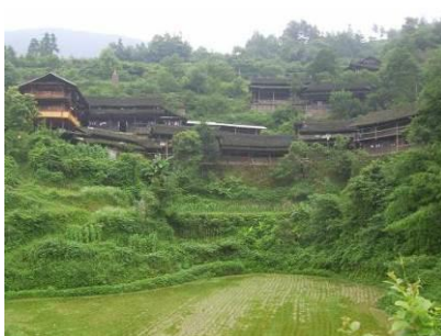
图 2 侗族人家传统的木式吊角楼图

新晃位于湖南省最西部, 沅水支流舞水的中游, 总面积 1508 平方公里, 东部与芷江县接壤, 南、西、北三面分别与贵州省天柱、镇远及万山特区为邻。全县辖 7 个镇、14 个乡、2 个民族乡: 新晃镇、波洲镇、兴隆镇、鱼市镇、凉伞镇、扶罗镇、中寨镇、步头降苗族乡、洞坪乡、大湾罗乡、方家屯乡、晏家乡、林冲乡、天堂乡、黄雷乡、凳寨乡、茶坪乡、新寨乡、贡溪乡、李树乡、禾滩乡、碧朗乡、米贝苗族乡。1984 年被列入国家首批对外开放县, 1998 年被列为怀化市优先发展“一体两翼”中的一翼。湖南省委书记杨正午欣然题名为“湘西明珠”。