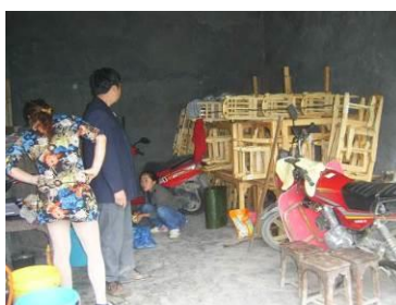
图 6 爱心人士为学校捐赠的新餐桌凳子暂存放在村民家中图