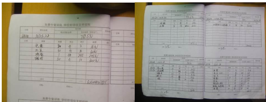
图 29 入库登记组图

(3) “入库登记”取 3 分，扣 2 分。扣分原因为没有专门的入库登记，登记上只有一人签字，不透明，无法得到有效的监督。