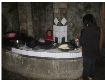
图 10 部分村民帮厨, 支持免费午餐组图