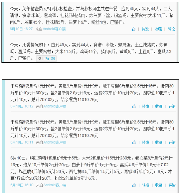
图 7 就餐人数的微博截图

当日就餐人数：学生 42 人+厨师 1 人+老师 2 人+稽核员 1 人=46 人（稽核员缴餐费 5 元）。实际用餐人数与该校微博公示内容基本一致。