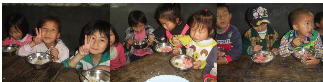
图 25 学生先吃鸡蛋再用餐