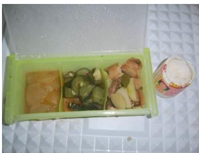
图 19 前一日菜品留样图

(1) “菜品留样”取 1 分, 扣 4 分。扣分原因为有菜品留样, 但不规范, 且没有相关登记。