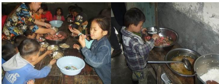
图 26 老师为学生加餐与学生自己加餐