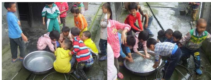
图 17 学生餐前洗手图