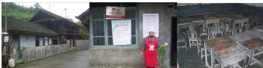
图 4 临时食堂组图