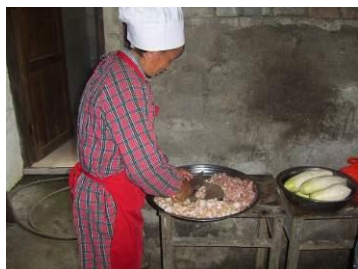
图 9 厨师正规着装工作图