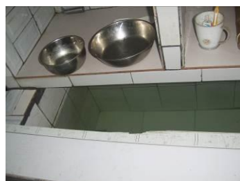
图 11 厨房工作台组图