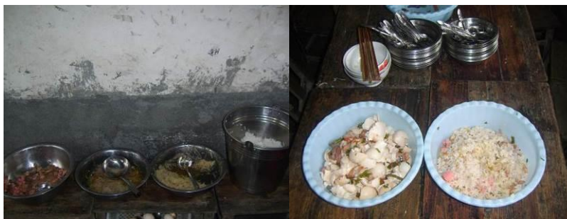
图 20 当日剩菜剩饭

(2) “浪费情况”取 1 分, 扣 4 分。扣分原因为绝大多数学生吃的比较干净, 没有剩菜剩饭, 但部分学生由于特殊原因剩下一些饭菜; 调查当日厨师对饭菜使用量没有估算好, 餐后盆里和桶里剩下不少米饭和菜, 校方回应, 盆里剩下的饭菜老师晚上和第二上午还能吃。