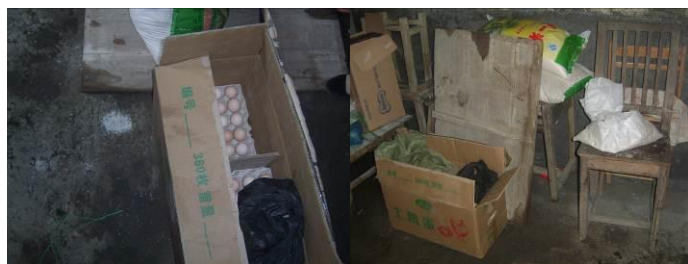
图 16 食材储藏组图