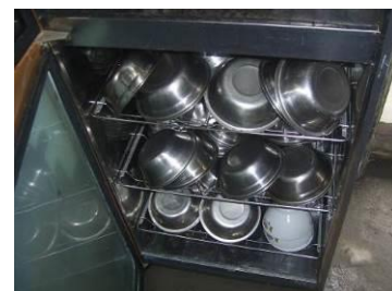
图 15 餐具集中存放与消毒