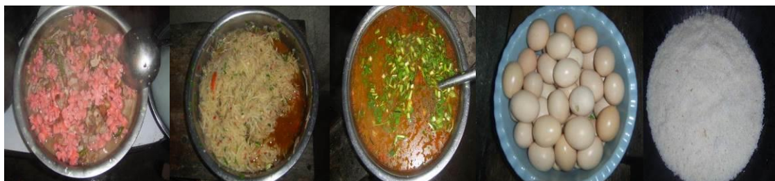
图 18 当日菜品组图