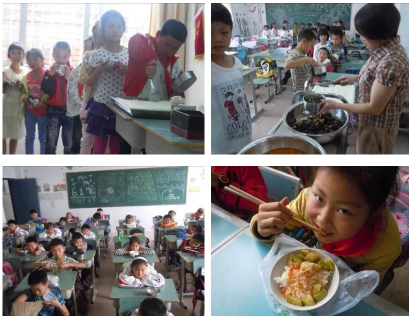
图 6 就餐组图