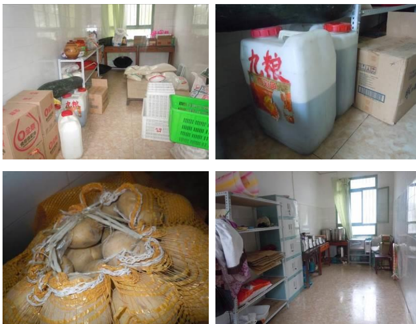
图 4 食材储存情况