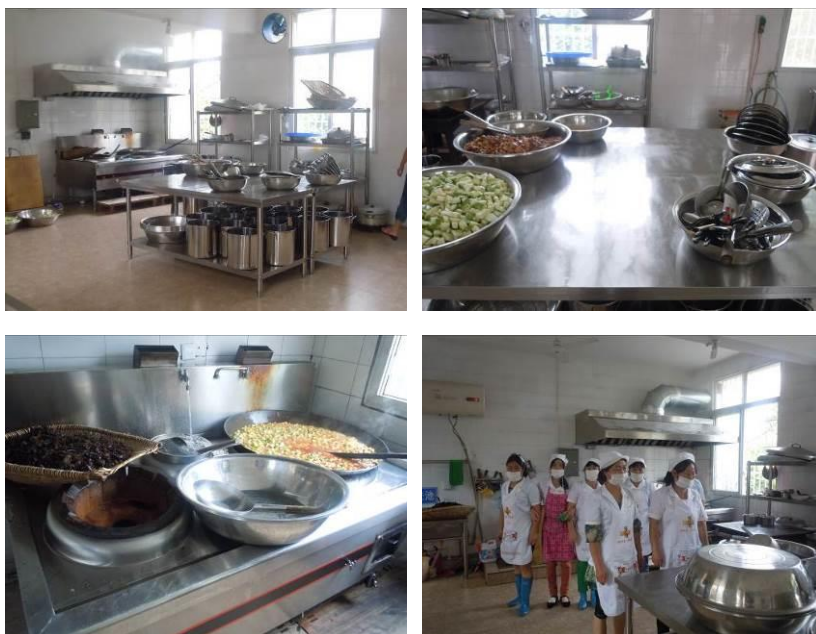
图 3 厨房环境及厨师情况

关于“餐前洗手”，调查当日，该校学生就餐前均未进行洗手，调查人员注意到该校人数较多，暂不具备统一洗手条件，故根据评分规则该项评分取 3 分（受客观条件限制，现场未提取到有效照片，但有沟通录音）；