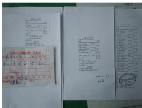
图 8 没有采购人员及验收人员签字的原始凭证

关于“原始凭证”，调查当日，从该校出示的原始凭证来看，部分蔬菜类食材的采购不能提供原始凭证，且出示的原始凭证没有采购人员及验收人员签字，信息不完整，根据评分规则该项评分取 3 分（见图 8）；