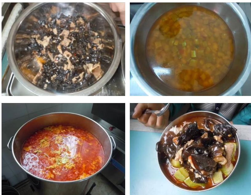
图 5 调查当日午餐菜品