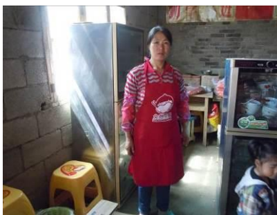
图 3 未戴工作帽在岗的炊事员

关于“厨工工服着装”，调查当日，调查人员注意到在岗厨师均没有按要求着白色工作装，仅系了戴“免费午餐”Logo 的围裙（图 3），根据评分规则，该项评分取 3 分。