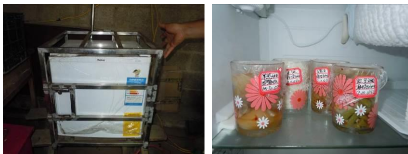
图 13 上锁的食品留样专用冰箱及储存的食品留样

关于“菜品留样”，调查当日，调查人员在该校厨房食材储存区域的食品留样专用冰柜里面查见了调查前一日食品留样，查见的食品留样取样数量达标，存放规范，标签完整，可视为有效留样（图 13），但该校却未对食品留样进行规范记录（无食品留样工作记录表），根据稽核评分规则，该项评分取 3 分。