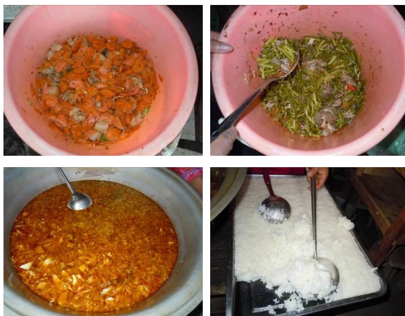
图 11 调查当日午餐菜品组图

调查当日, 该校午餐饭菜质量良好, 完全符合考核要求。午餐菜品及就餐现场情况详见图 11 及图 12。