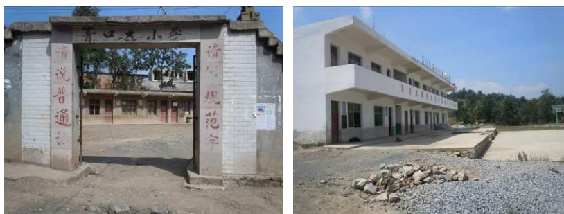
图 2 学校大门及校园环境