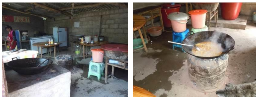
图5 厨房全景及煤炉

关于“易变质食物保存”，调查当日，调查人员在厨房冰柜里注意到，库存的猪肉被直接暴露存放于冰柜内部，且冰柜内部可见明显的猪肉渗出的血渍（图6），但该冰柜系冻存猪肉的专用冰柜，并未见其他食材混合存放，暂无食品安全隐患，根据评分规则，该项评分取3分。