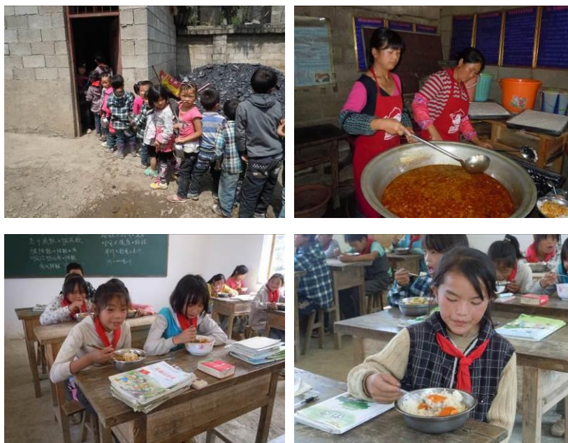
图 12 就餐组图