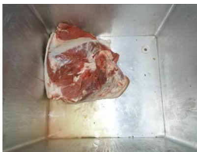
图6 暴露存放于冰柜中的猪肉

关于“易变质食物保存”，调查当日，调查人员在厨房冰柜里注意到，库存的猪肉被直接暴露存放于冰柜内部，且冰柜内部可见明显的猪肉渗出的血渍（图6），但该冰柜系冻存猪肉的专用冰柜，并未见其他食材混合存放，暂无食品安全隐患，根据评分规则，该项评分取3分。