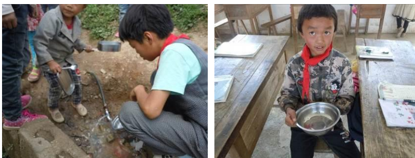
图8 学生正在清洗餐具（左）及正在展示自带餐具的学生（右）

关于“食材储藏”，调查当日，调查人员注意到位于厨房食材储存区域的部分食材存在明显混合存放（见图9），根据稽核评分规则，该项评分取3分。