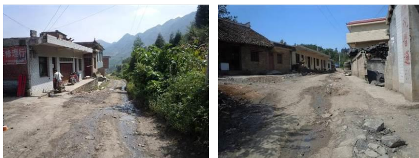
图1 箐口小学周边路况

自纳雍县城至姑开乡的路况整体良好,大部分系硬化路面,但自姑开乡至箐口小学约20公里路段则为未硬化的泥石路面,路况条件非常差,据师傅说下雨天特别差,几乎不能通行。结束对该校的调查后,调查人员原路乘摩托车回到姑开乡(30元),换乘面包车到维新镇(10元),再转乘客车回到纳雍县城(25元)。