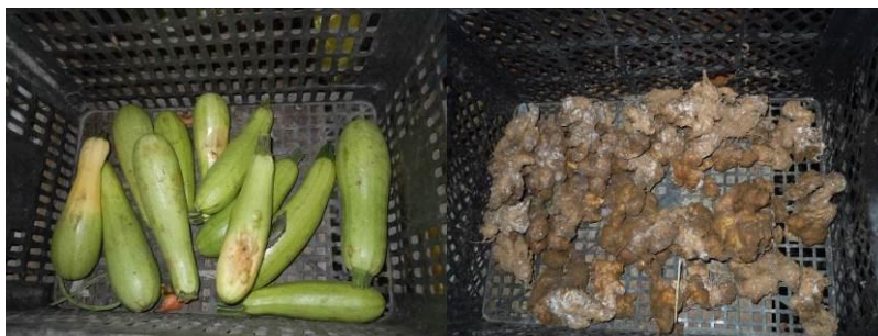
图10 已出现变质迹象的南瓜及老姜

关于“当前储存食材变质腐坏情况”，调查当日，调查人员注意到位于厨房食材储存区域的部分食材出现变质迹象，且没有及时清理（图10），根据稽核评分规则，该项评分取0分。