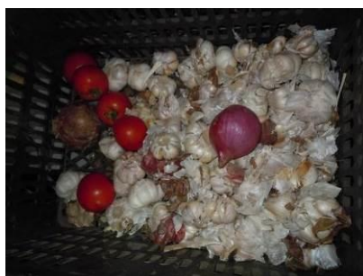
图9 混合存放的大蒜和西红柿

关于“食材储藏”，调查当日，调查人员注意到位于厨房食材储存区域的部分食材存在明显混合存放（见图9），根据稽核评分规则，该项评分取3分。