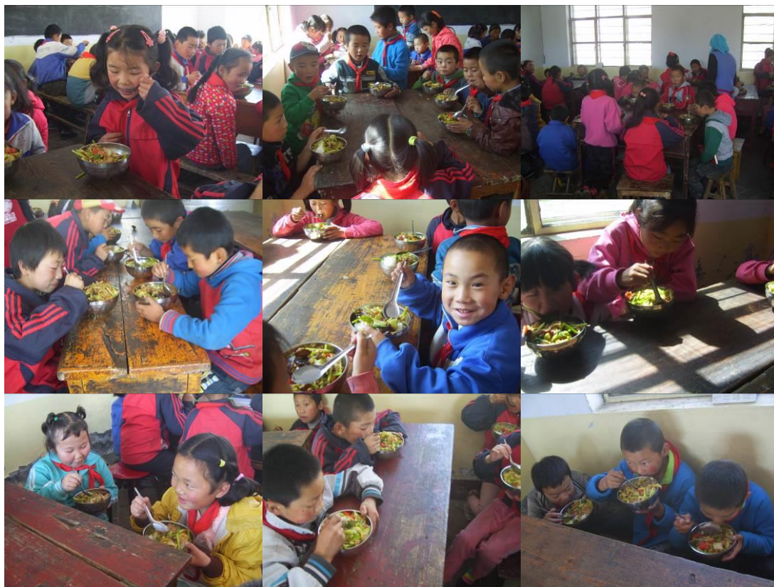
图 18 学生用餐组图