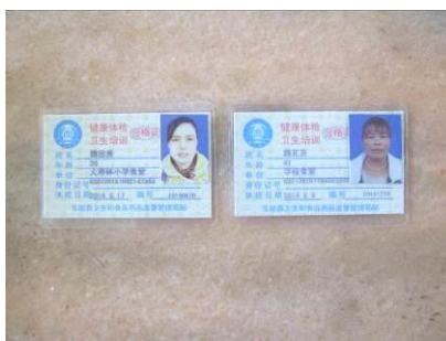
图 14 厨师健康证图