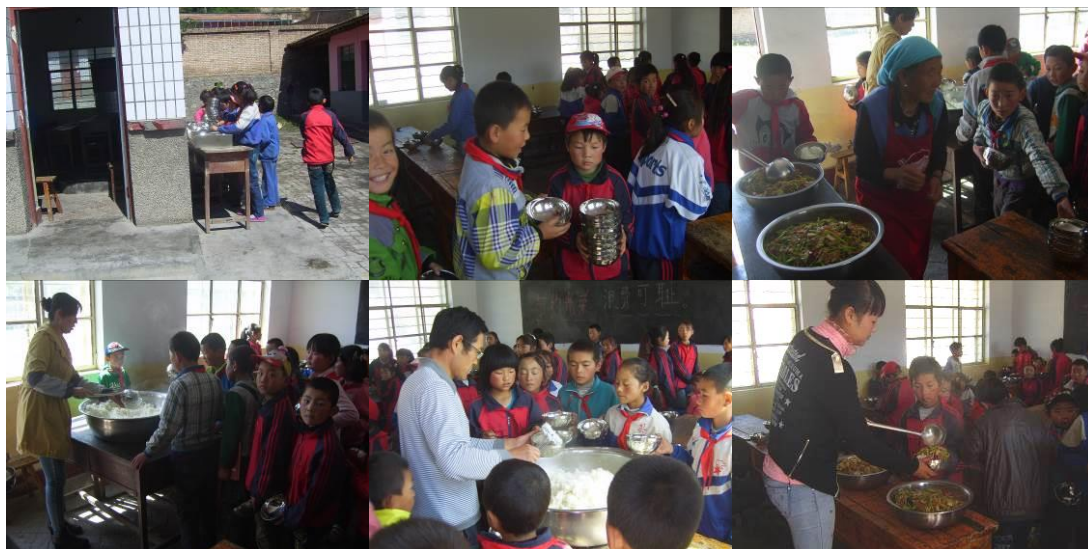
图 17 分餐组图