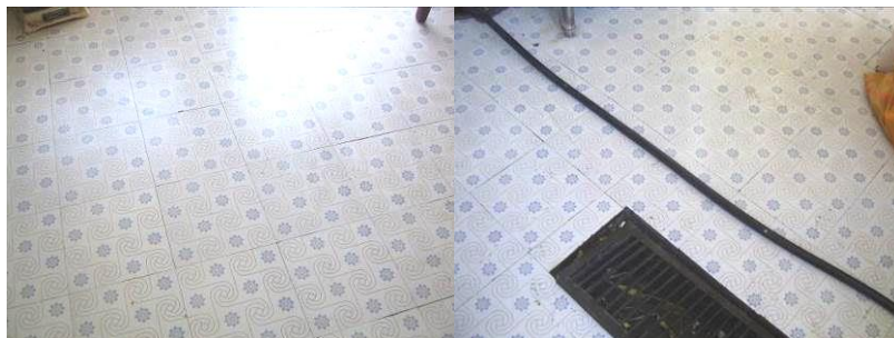
图 10 地面卫生干净整洁组图