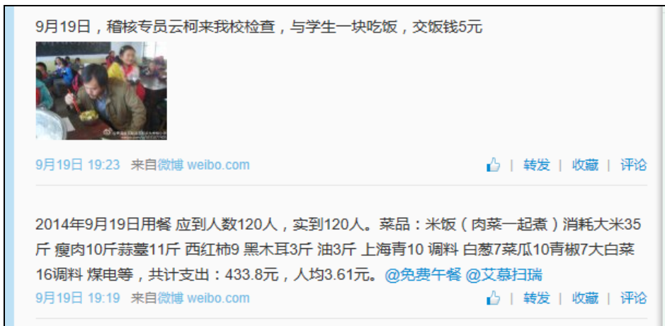
图 3 就餐人数的微博截图

当日就餐人数: 学生 109 人 (请假 1 人) + 厨师 3 人 (含 2 人帮厨) + 老师 6 人 (请假 1 人) + 稽核员 1 人 = 119 人 (稽核员缴餐费 5 元)。实际用餐人数与该校微博公示内容基本一致, 不足之处为没有公示具体的请假人数。