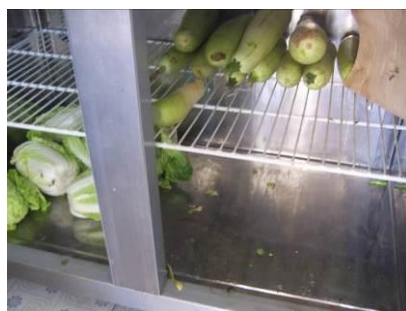
图5 冰箱储存的易变质食物图

(3)“餐前洗手”取3分,扣分原因为学校洗手环境差,学生多,学校没有要求学生餐前洗手,只有部分学生主动洗手(附图片)。