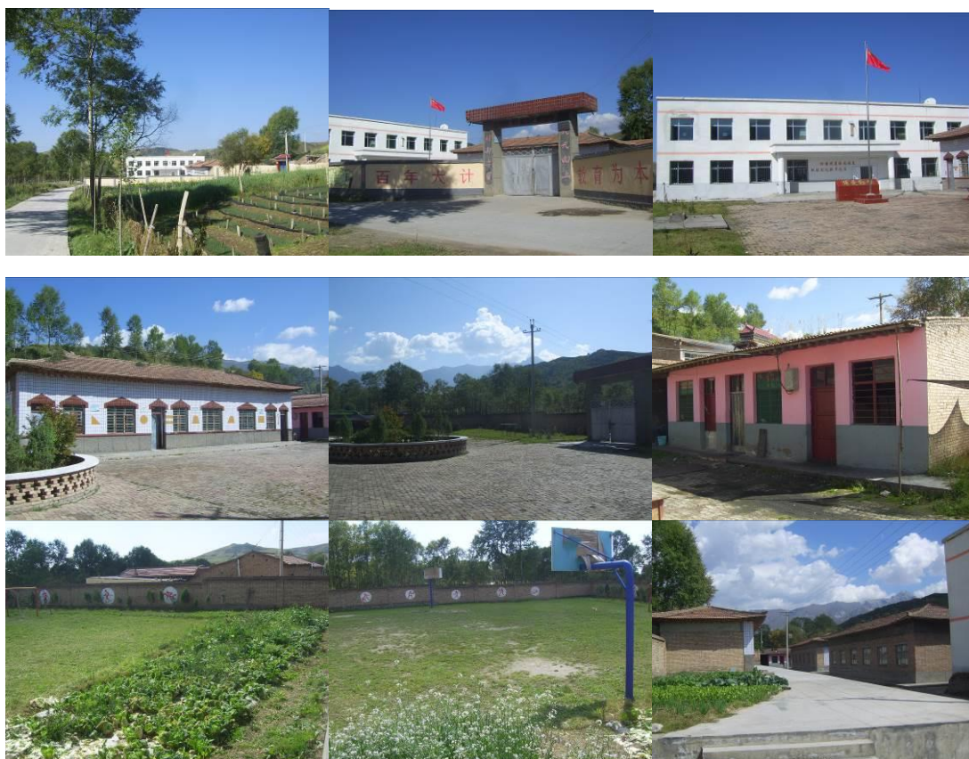
图 2 学校组图