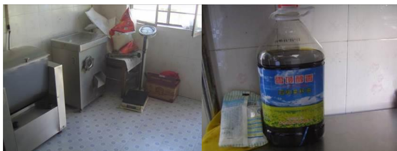
图 12 食材储藏组图