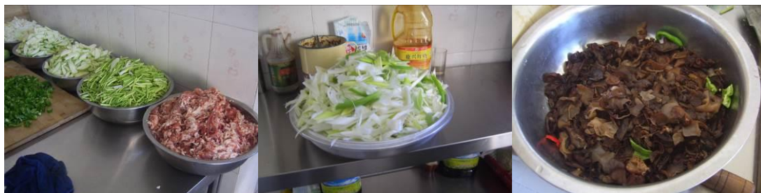
图 9 工作台生熟食分开组图