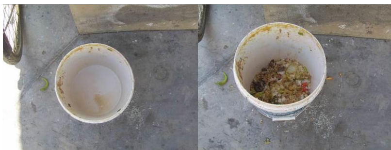
图 21 剩菜剩饭组图 (一百多人用餐, 这些剩菜剩饭属于正常)