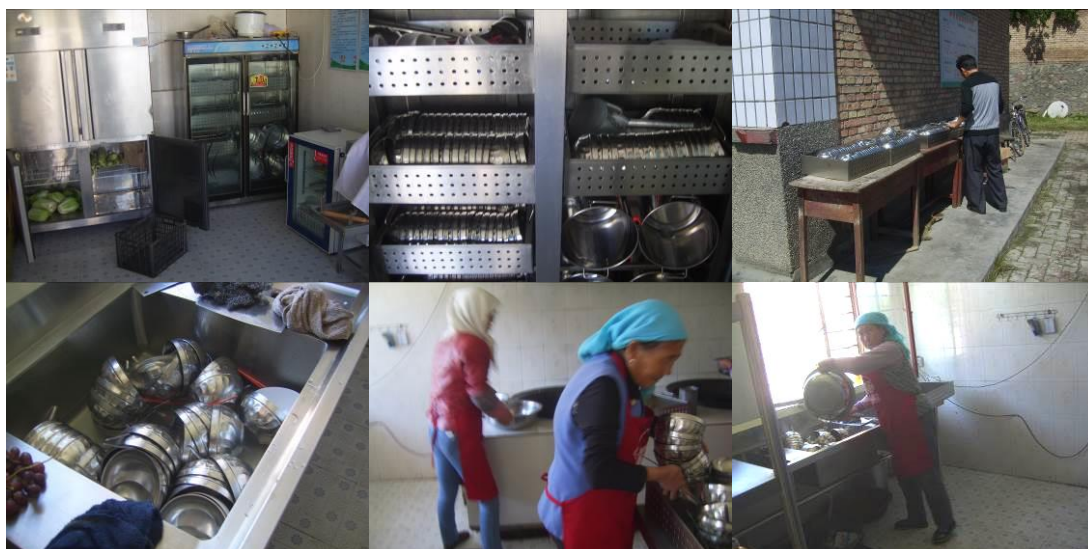
图 11 学生餐具由厨师统一清洗消毒组图