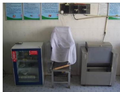
图 15 厨房设备正常使用图