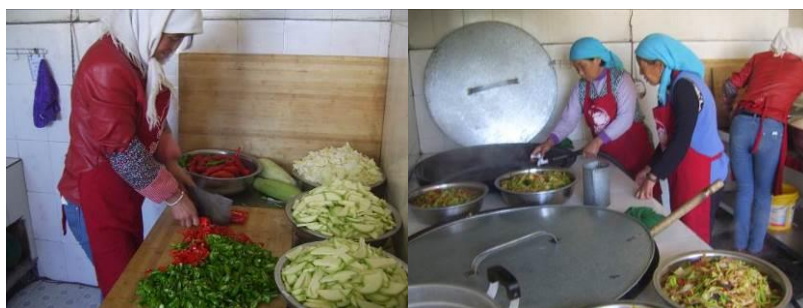
图7 厨师正规着装工作组图