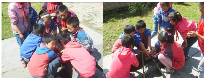
图6 学生餐前洗手组图

(3)“餐前洗手”取3分,扣分原因为学校洗手环境差,学生多,学校没有要求学生餐前洗手,只有部分学生主动洗手(附图片)。