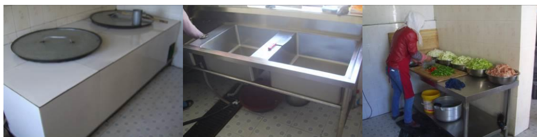
图8 厨房工作台组图