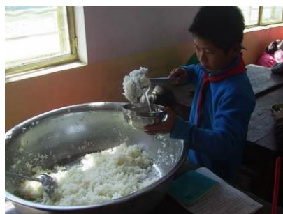
图 19 没吃饱的学生加饭菜图