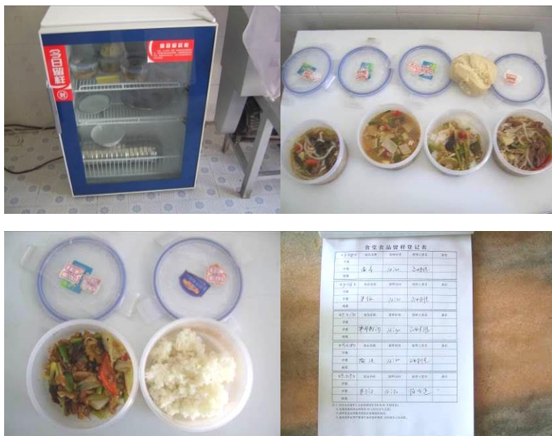
图 16 菜品留样与相关登记组图