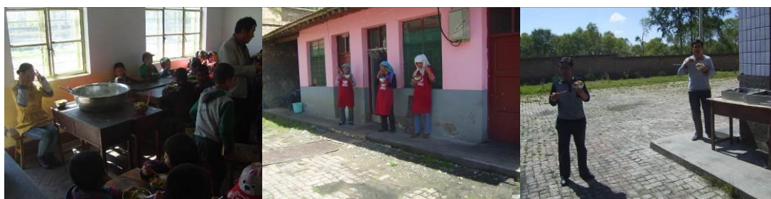
图 20 教职工用餐组图