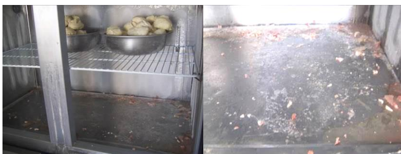
图 4 冰箱冷冻间储存的食物组图

(1) “生熟食存放”取 0 分, 扣分原因为冰箱冷冻间储存的肉类等食物没有严格包装隔离, 冰箱内虽无异味, 但很不干净, 存在一定安全隐患 (附图片)。