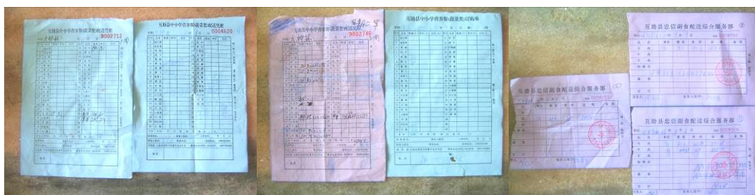
图 23 原始凭证组图