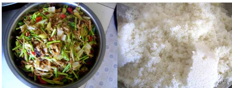
图 13 当日菜品组图

当日菜品为炒烩菜 (蒜苔、西红柿、黑木耳、大葱、菜瓜、青椒, 白菜和猪肉), 主食为大米。