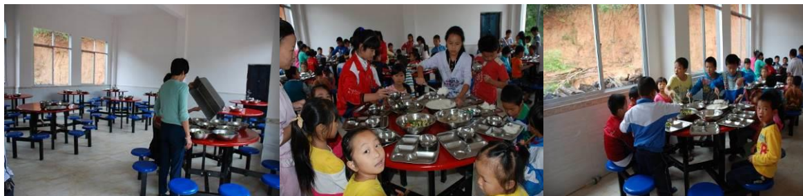
图 9 学生分餐图组（秩序良好）