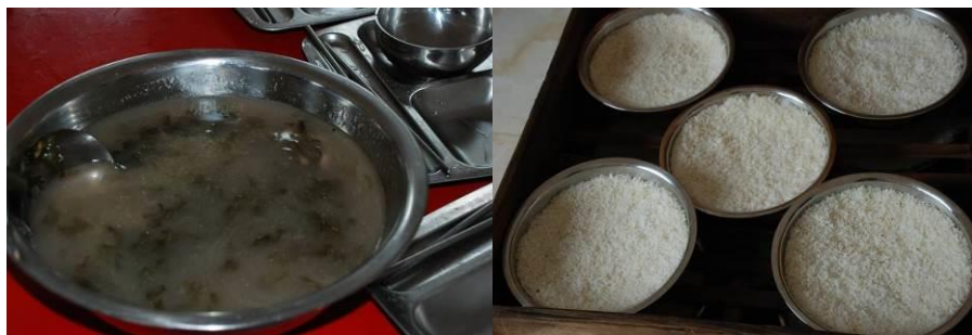
图 6 当天菜品