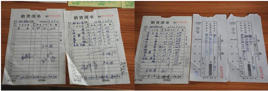
图 13 原始凭证