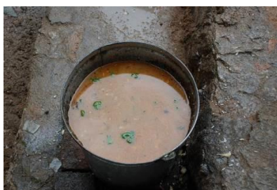
图 11 剩饭菜在正常范围