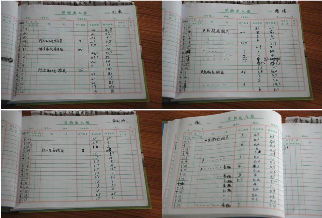
图 14 入库、出库登记