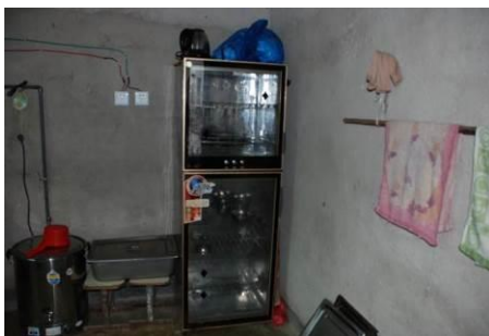
图 7 设备正常使用