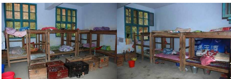
图 2 学生寝室