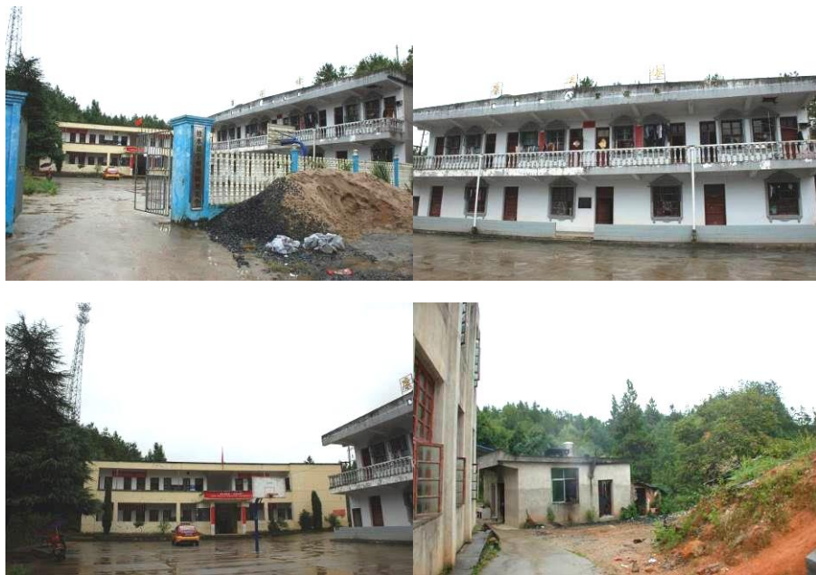
图 1 学校外观组图

免费午餐于 2014 年 3 月 23 日在该校正式开餐。中国社会福利基金会免费午餐基金向该校提供一笔开餐资金，用于购置冰箱等或厨房用品等，1 名厨师 800 元/月的工资及全体教职工及学生 3 元/人/餐的午餐费。学校有 2 名厨师，免费午餐承担其中一位厨师的工资（800 元/月），另一位厨师 4000 元/学期的工资学校另找渠道解决了。该校有寄宿生 48 人，学校每学期收学生 100 斤干柴，寄宿生带米到校，学校帮做熟，不做菜，学生自带菜，学校不收取餐费。