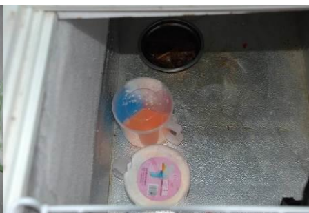
图 8 菜品留样不合规范