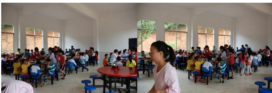
图 10 学生在餐厅用餐图组