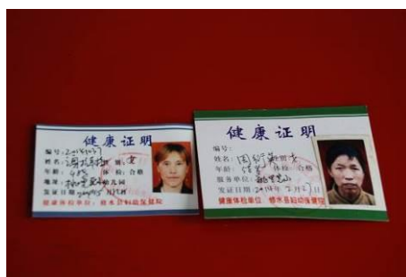
图 6 健康证在有效期内

“菜品留样”项扣除 2 分, 扣分原因为菜品留样不合规范, 留样没有贴有效标签, 没有留样记录 (见图 8)