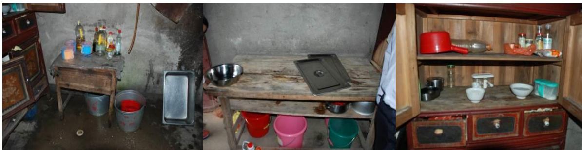
图4 厨房及厨师组图