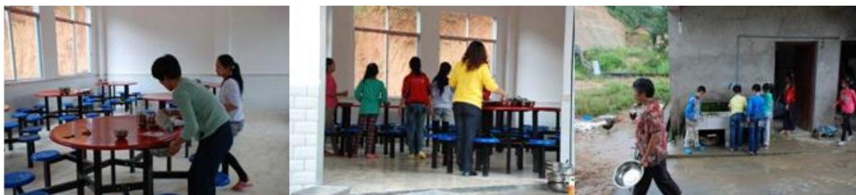
图 12 餐后学生和厨师一起打扫餐厅、洗餐具