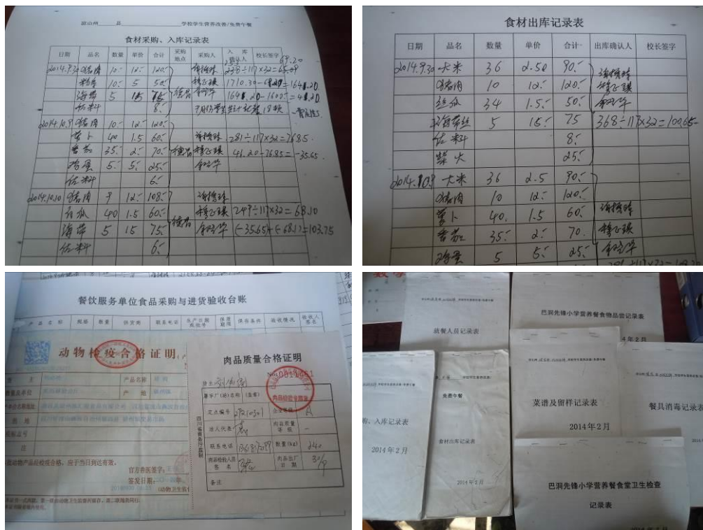
图 14 午餐账目管理组图