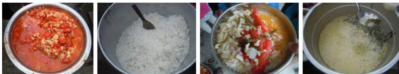
图 8 调查当日饭菜组图（由于拍摄技术的原因，素炒白萝卜没有拍到）

关于“饭菜份量”，调查当日，从调查人员现场观察来看，当天的备餐量稍显不足，部分准备加饭的学生无饭菜可加，而根据对该校五六年级同学进行的匿名调查统计结果来看，关于饭、菜是否够吃的选项中均有超过 1/3 的学生选择“有时不够吃”。根据稽核评分规则，该项评分取 0 分。调查当日的饭菜组图见图 8: