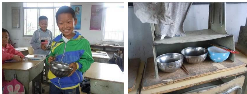
图6 学生自行保管的餐具

关于“食材储存”，调查当日，调查人员注意到该校的大米储存欠规范，库存大米是放在炊事员家的堂屋里的，现场较为随意的放置在屋子中间的凳子上，稍不注意还有可能掉在地上（图7）。根据稽核评分规则，该项评分取3分；