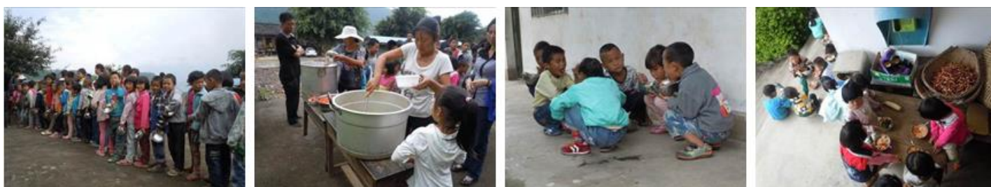
图 12 就餐现场组图