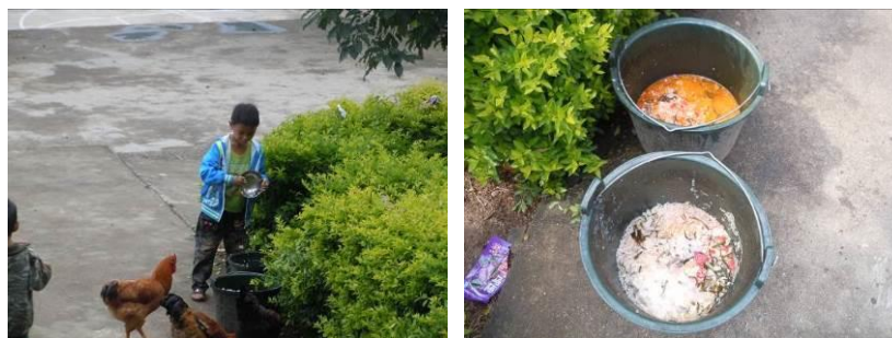
图 11 正在倾倒饭菜的学生及就餐结束后的泔水桶