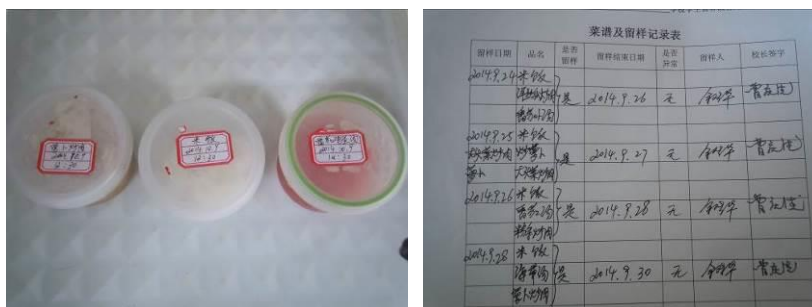
图9 现场查见的食品留样及工作记录表（时间记录错误）

关于“菜品留样”，调查当日，调查人员注意到该校日常食品留样虽取样数量达标，但标签记录不规范，取样时间记录成了用餐时间，食品留样工作记录表没有精确记录取样时间（图9）。根据稽核评分规则，该项评分取3分；