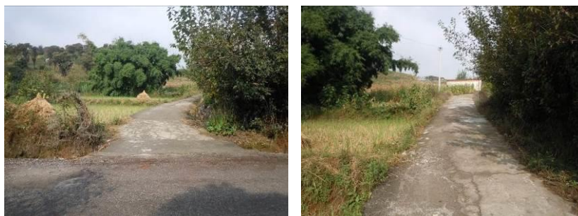
图1 先锋小学周边路况

10月11日,调查人员自西昌市旅游集散中心客运站乘坐前往德昌县的客运班车,约1.5小时后抵达德昌县城(17元),换乘前往茨达乡方向的客运面包车,在先锋小学所在的巴洞乡先锋村路边下车(3.5元),步行3分钟左右入校。自德昌县城至先锋小学的路况一般,为简单硬化路面(图1),交通方便,客运面包车很多。结束对该校的调查后,调查人员在学校路边乘坐过路客运面包车返回德昌县汽车站(3.5元),换乘客运班车回到西昌市(16元)。