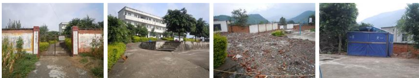
图 2 学校大门及校园环境

先锋小学位于四川省凉山州德昌县南部的巴洞乡先锋村, 德昌县城至巴洞乡的路边, 距离巴洞乡约 2 公里, 距离德昌县城约 8 公里。该校所处地区为低山丘陵地区, 地势相对平坦, 学校周边居民生活水平一般, 学生家庭收入主要以务农及外出务工为主要经济来源。该校目前仅有一幢三层校舍, 原旧教室及学生厨房、公共厕所等均在今年暑假期间因 D 级危房而被拆除 (图 2), 目前学校厨房系借用 500 米外炊事员自家厨房, 新的厨房尚在规划中, 尚无重建迹象。该校系国家营养改善计划覆盖学校, 目前拥有学前班及一至六年级共 7 个教学班, 在校学生总人数 106 人 (其中学前班 21 人), 教职工 11 人 (其中炊事员 2 人), 全校午餐总就餐人数 117 人 (其中免费午餐基金拨款 32 人), 自 2013 年 4 月起接受免费午餐基金资助并与国家营养改善计划配套实施, 为全校师生供应午餐正餐。