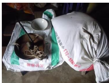
图8 随意放置在炊事员家里的大米

关于“食材储存”，调查当日，调查人员注意到该校的大米储存欠规范，库存大米是放在炊事员家的堂屋里的，现场较为随意的放置在屋子中间的凳子上，稍不注意还有可能掉在地上（图7）。根据稽核评分规则，该项评分取3分；