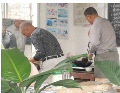
图10 正在做菜的老师

关于“师生同餐”，调查当日，该校教师没有与学生一同就餐，而是在办公室自行做饭菜(图10)。根据稽核评分规则，该项评分取1分；