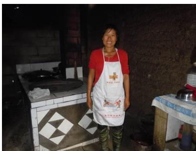
图4 当日在岗炊事员

关于“厨工头部卫生”及“厨工工服着装”，调查当日，调查人员注意到在岗炊事员没有严格按照要求着装上岗，但个人卫生状况良好（图4）。根据稽核评分规则，该两项分别取3分；