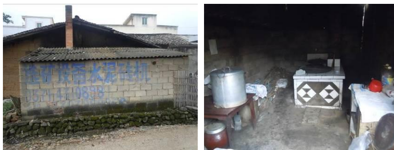
图5 厨房外部环境及内部情况

关于“墙地面卫生”，调查当日，调查人员注意到借用的家庭厨房整体环境卫生状况一般，墙面为未粉刷的水泥砖墙面，灶台上方及其他卫生死角可见部分油污或烟尘，地面简单硬化（图5）。根据稽核评分规则，该项评分取3分；