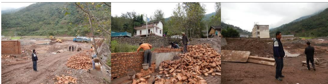
图3 学校扩建改造施工组图

目前学校正在进行大规模扩建改造施工, 由国家投资约 300 万元左右, 由县教育局招标施工。