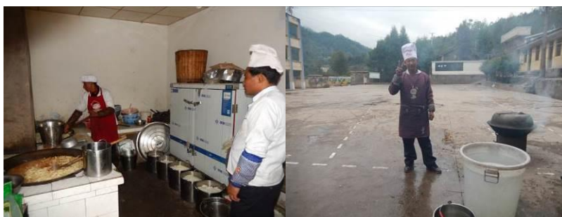
图10 纠正后的厨师正规着装工作组图