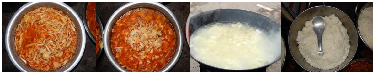
图 15 当日菜品组图