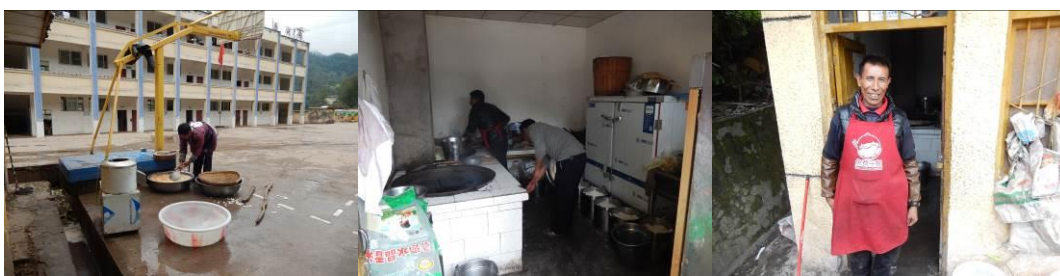
图 6 厨工头部卫生组图

(1) “厨工头部卫生”取 1 分, 扣分原因为现场的三名厨师均没有戴工作帽, 部分厨师的头发不太干净 (附图片)。