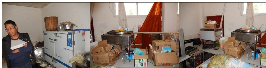
图 22 厨房未使用的设备组图