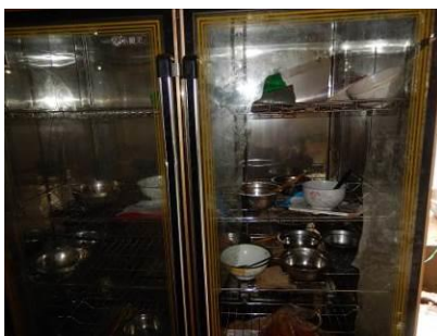
图 16 消毒柜图

(1) “设备维护”取 0 分, 扣分原因为消毒柜一扇门的玻璃已破损, 没有及时维修, 校方回应: 已上报对接人, 相关人员目前还没有通知学校如何维修 (附图片)。