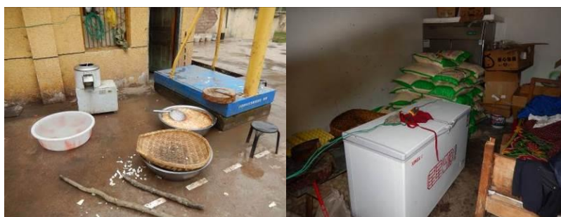
图 21 厨房设备正常使用组图