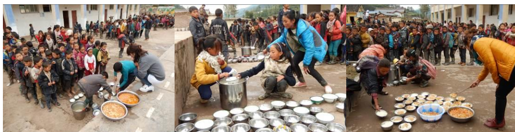
图 23 井然有序分餐组图