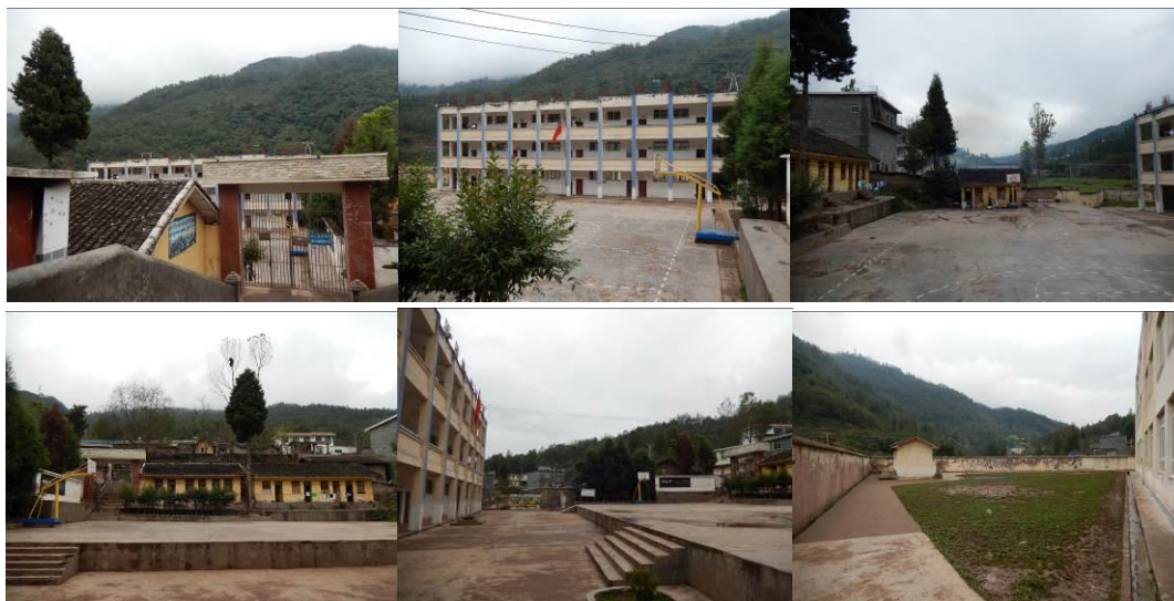
图 4 学校组图

该校现有 6 个年级, 9 个教学班, 为一至六年级共有学生 464 人, 教师 14 人, 厨师 4 人。