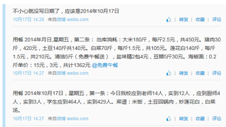
图5 就餐人数的微博截图

人数与该校微博公示内容基本一致。不足之处为，没有公示清楚学生与老师具体的请假人数，没有公示调查人员在校用餐信息。