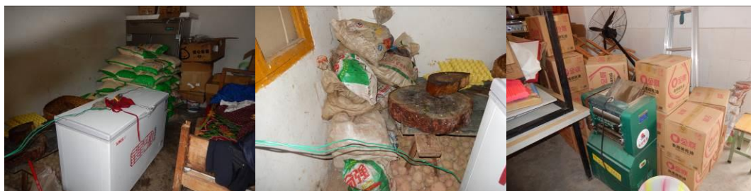
图 13 食材储藏组图