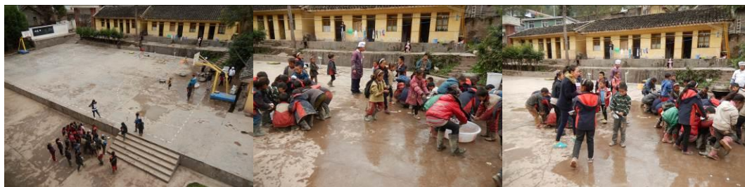
图 14 餐前洗手组图