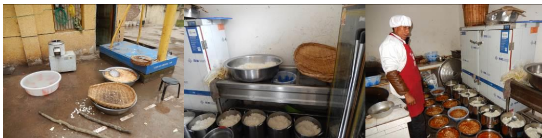
图 12 工作台生熟食分开组图