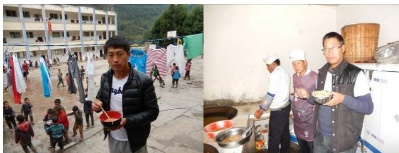
图 26 教职工用餐组图