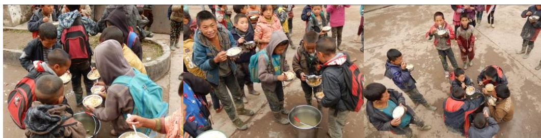
图 25 没吃饱的学生加饭菜组图