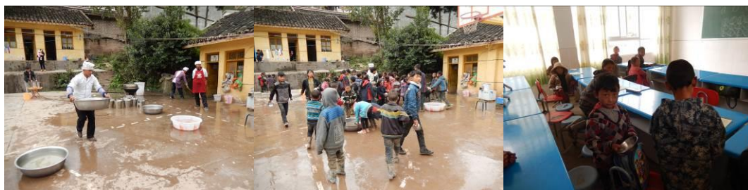
图9 学生的餐具清洗存放组图

(5) “是否消毒”取 3 分, 扣分原因为学生餐具均由自己清洗, 存放在课桌里, 存在安全隐患。校方回应, 每周厨师都要为学生餐具集中统一消毒一次。(附图片)