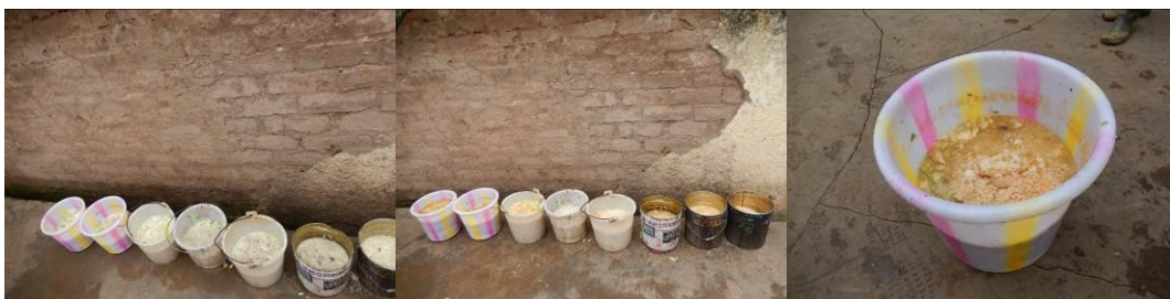
图 18 剩菜剩饭组图

(3) “浪费情况”取 3 分, 扣分原因为通过调查人员观察该校浪费明显 (附图片): 左图为没有及时清空的泔水桶, 右图为校方准备的一个空桶, 在四百多人用餐后的剩菜剩饭, 中图为部分学生把剩菜剩饭倒在没有清空的泔水桶里,