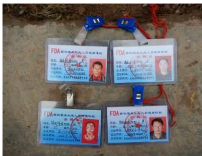
图 19 厨师健康证图