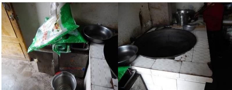
图 11 厨房工作台组图