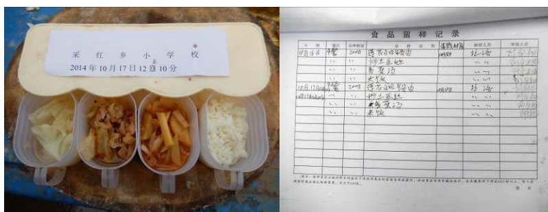
图 20 纠正后的菜品留样及登记组图