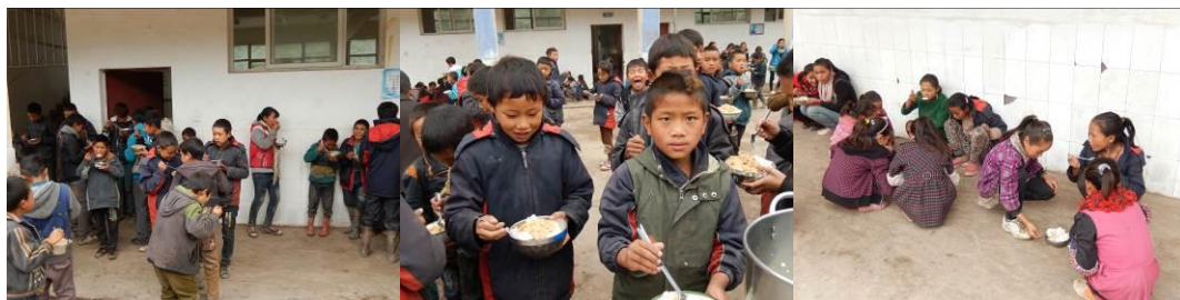
图 24 学生用餐组图