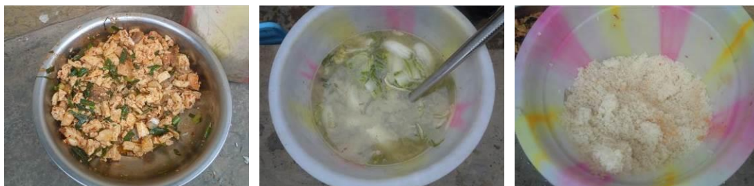
图 8 调查当日饭菜组图