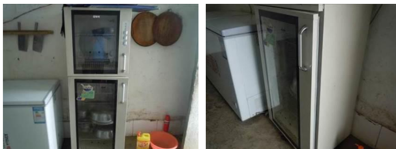
图 9 已无法正常使用的消毒柜

关于“设备维护”,调查当日,调查人员注意到位于厨房的餐具消毒柜故障,不通电,且柜门也不能关闭,无法正常使用(图9)。根据稽核评分规则,该项评分取0分;