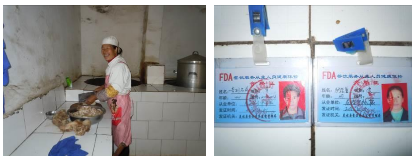
图 7 调查当日在岗的炊事员之一及其健康证