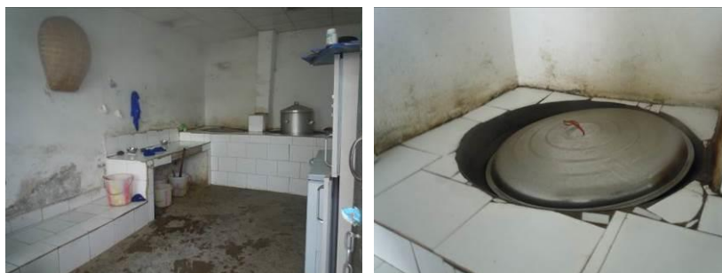
图 4 厨房全景及墙面局部

关于“墙地面卫生”，调查当日，调查人员注意到厨房墙面有明显墙皮剥脱现象，且存在部分卫生死角（图 4）。根据稽核评分规则，该项评分取 3 分；