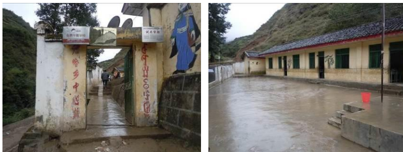
图2 学校大门及校园环境