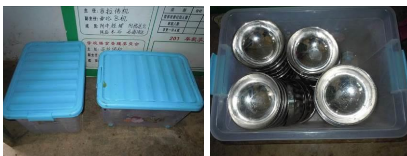
图 6 统一放入收纳箱的学生餐具

关于“餐具消毒”，调查当日，调查人员注意到学生餐具虽统一用塑料收纳箱分班管理，但由于餐具消毒柜已坏，故没有执行餐具消毒，且部分学生餐具的卫生状况不乐观（图 6）。根据稽核评分规则，该项评分取 1 分；