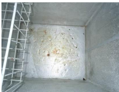
图 5 冰柜内部卫生情况

关于“餐具消毒”，调查当日，调查人员注意到学生餐具虽统一用塑料收纳箱分班管理，但由于餐具消毒柜已坏，故没有执行餐具消毒，且部分学生餐具的卫生状况不乐观（图 6）。根据稽核评分规则，该项评分取 1 分；