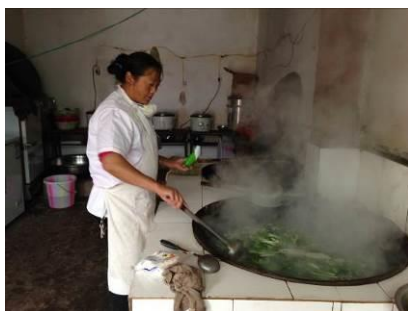
图4 调查当日在岗炊事员

关于“厨工头部卫生”，调查当日，在岗炊事员没有戴工作帽上岗，但头发束起盘头，自身头发干净。根据稽核评分规则，该项评分取3分；