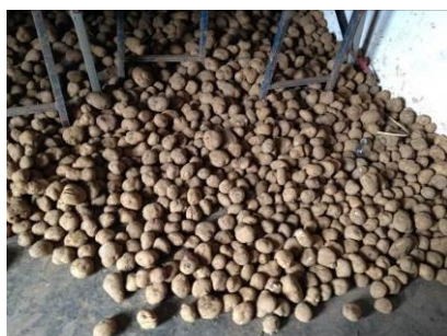
图 7 堆放在地上的大量库存土豆

关于“食材储藏”，调查当日该校蔬菜类食材存放规范，但存放于另一间屋子的土豆直接堆放于地上，且库存量还较大（图 7）。根据稽核评分规则，该项评分取 3 分。