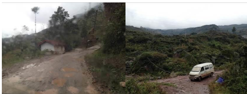
图1 龙窝乡至大湾村小的路况及调查人员所乘车辆

10月17日,调查人员自马边县汽车站搭乘当日上午9时开往四川宜宾的客运班车,于当日下午近3点抵达宜宾西门汽车站(63元),搭乘出租车回到家里(9元)。