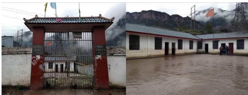
图 2 学校大门及校园环境