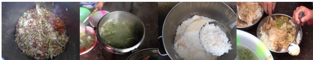
图 8 调查当日饭菜组图