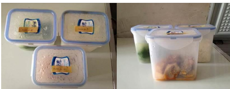
图10 现场查见的食品留样（标签未精确记录取样时间）

关于“菜品留样”，调查当日，调查人员在厨房冰柜查见的食品留样取样数量达标，冻存环境符合要求，但注意到标签未精确记录取样时间，同时未建立食品留样工作记录表（图10）。根据稽核评分规则，该项评分取3分；