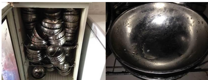
图 6 消毒柜内的学生餐具及特写

关于“食材储藏”，调查当日该校蔬菜类食材存放规范，但存放于另一间屋子的土豆直接堆放于地上，且库存量还较大（图 7）。根据稽核评分规则，该项评分取 3 分。