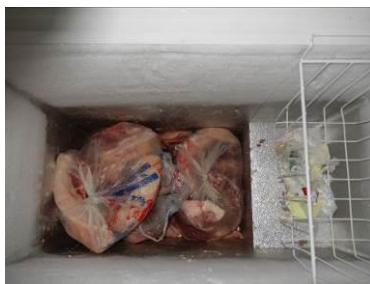
图 15 纠正后冰柜储存的肉类食材已隔离储存图