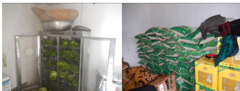
图 14 食材储藏组图