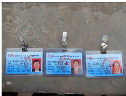
图 21 厨师健康证图