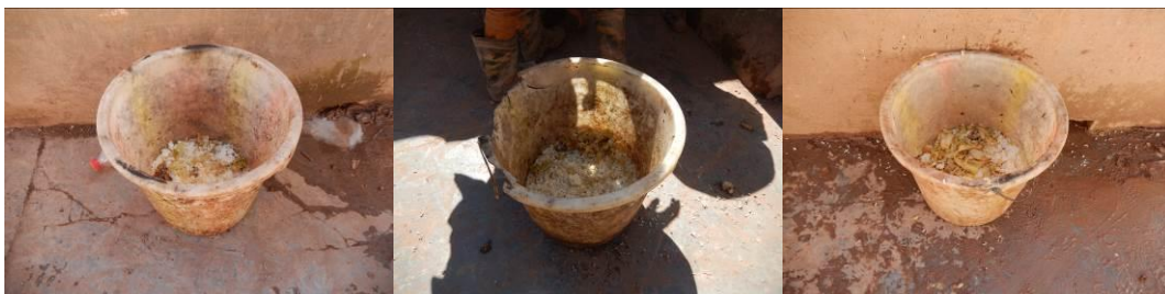
图 20 剩菜剩饭组图

(3) “浪费情况”取 3 分，扣分原因从泔水桶的剩菜剩饭情况看，大多为白米饭倒掉的较多。调查人员通过观察学生用餐全过程，发现孩子们碗里的米多菜少，学生因无菜而倒掉米饭是浪费的主要根源（附图片）。