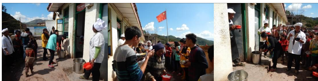
图 25 教职工用餐组图