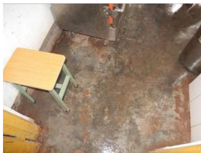
图 13 地面卫生图