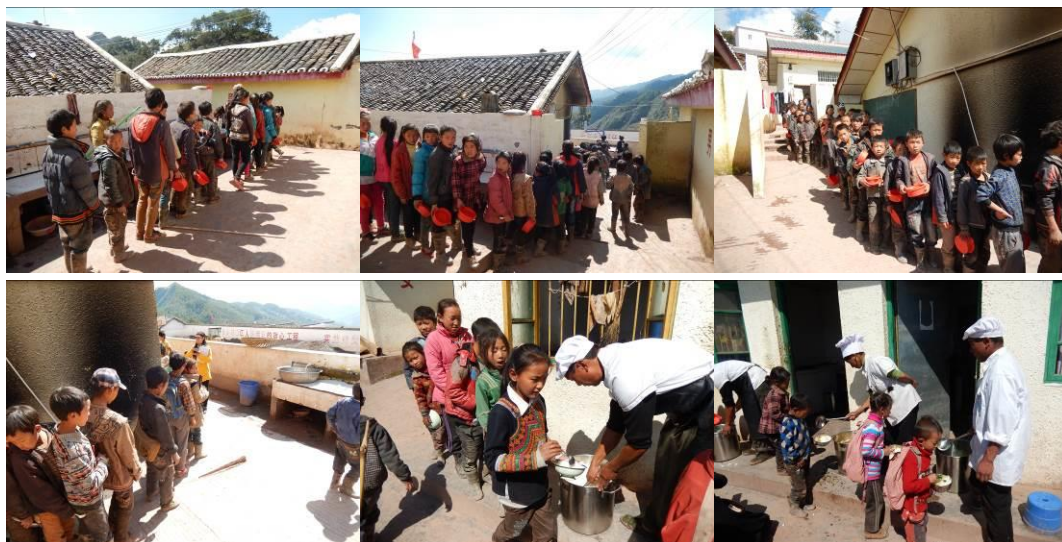
图 23 井然有序分餐组图