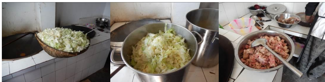
图 12 工作台生熟食分开组图