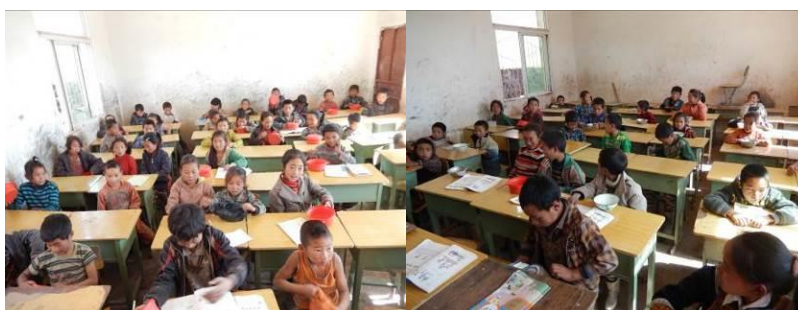
图 8 学生的餐具存放组图

(2)“是否消毒”取 3 分,扣分原因为学生餐具均由自己清洗,存放在课桌里,存在安全隐患。校方回应,每周厨师都要为学生的餐具集中统一消毒一次。(附图片)。