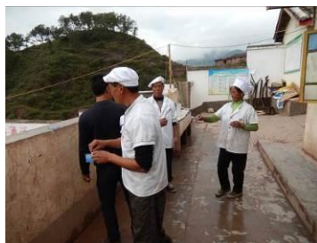
图 10 厨师正规着装工作图