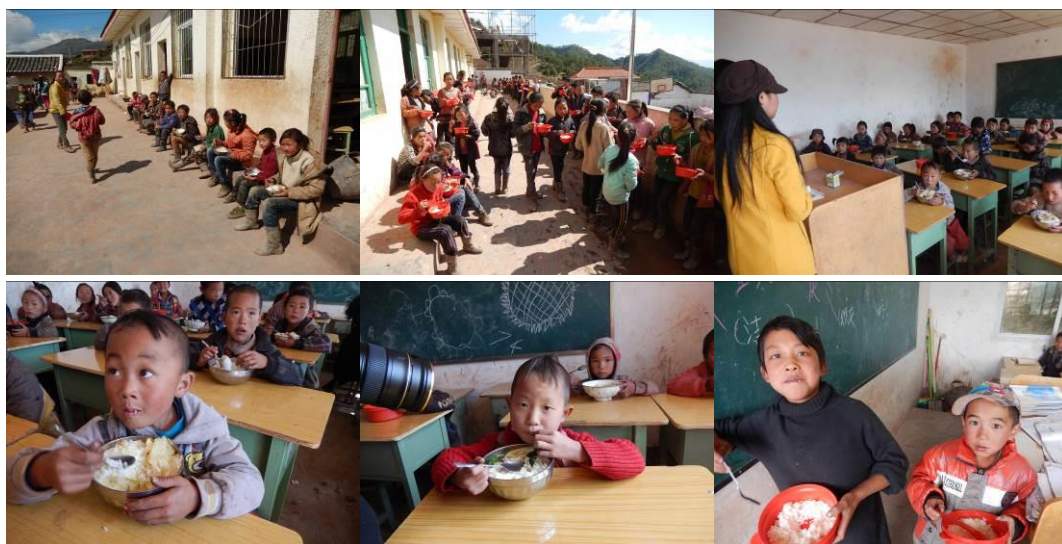
图 24 学生用餐组图