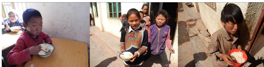
图 18 学生碗中的饭菜比例组图

(1) “饭菜份量”取 0 分，扣分原因为调查人员通过观察学生用餐全过程，发现孩子们碗里的米多菜少，结合在学生中的调查访谈和当日的剩菜剩饭情况，综合分析该校学生存在吃不饱、吃不好的现象（附图片）。