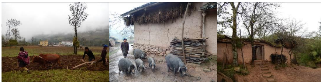
图 3 凉山美姑人生活组图

美姑县是最早被国家认定的“141 个”贫困县之一。2004 年,美姑县辖 1 个镇(巴普)、35 个乡(觉洛、巴古、农作、瓦古、尔其、拖木、炳途、瓦西、采红、苏洛、竹库、典补、龙门、洒库、九口、柳洪、龙窝、子威、尔合、哈洛、尼哈、乐约、树窝、合姑洛、候古莫、牛牛坝、依果觉、峨曲古、佐戈依达、拉木阿觉、洛莫依达、井叶特西、依洛拉达、候播乃拖、洛俄依甘)。