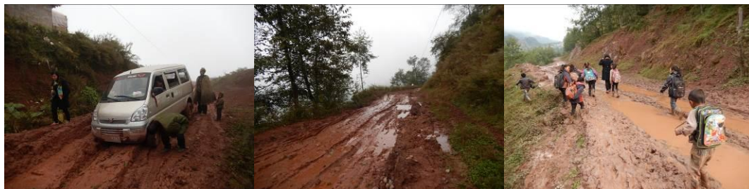
图 1 探访途中路况组图

10 月 20 日, 与品牌部赵俊霞于上午 8:10 从美姑县城乘面包车至新桥 (票价 10 元/2 人), 包面包车至哈洛乡 (车费 100 元/2 人)。这段山路非常崎岖, 刚下过雨路况较差, 大多为泥巴路, 水坑较多。距哈洛乡约 7 公里处面包车陷入深泥坑无法前行, 我们与路人帮司机把车推出泥坑后, 付了车费步行近两个小时山路, 于 10:50 到达哈洛乡中心小学, 对该校进行调查。下午 14:30 调查结束后, 我们一起追踪学生四都金石等同学的回家行程, 翻山越岭两个半小时到达学生家哈洛大队够俄村, 夜宿四都金石同学家。