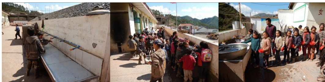
图 16 餐前洗手组图