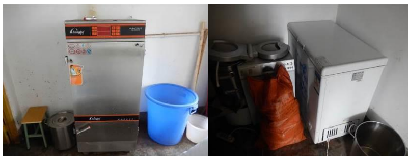
图 22 厨房设备正常使用组图