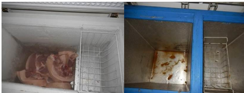
图 7 冰柜内部组图

(1)“易变质食物保存”取 1 分,扣分原因为一台冰柜内储存的食材没有包装,另一台冰柜已坏但没有及时清理走,内部有异味(附图片)。