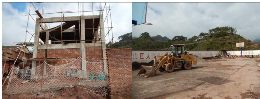
图4 学校扩建改造施工组图