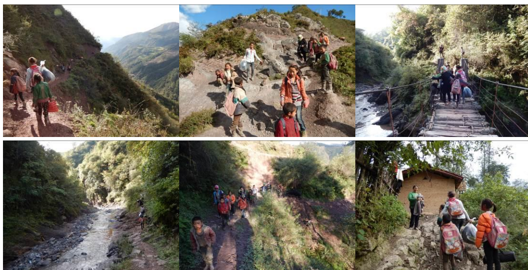
图 2 追踪学生放学回家全程路况组图