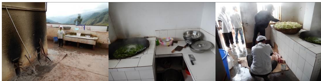
图 11 厨房工作台组图