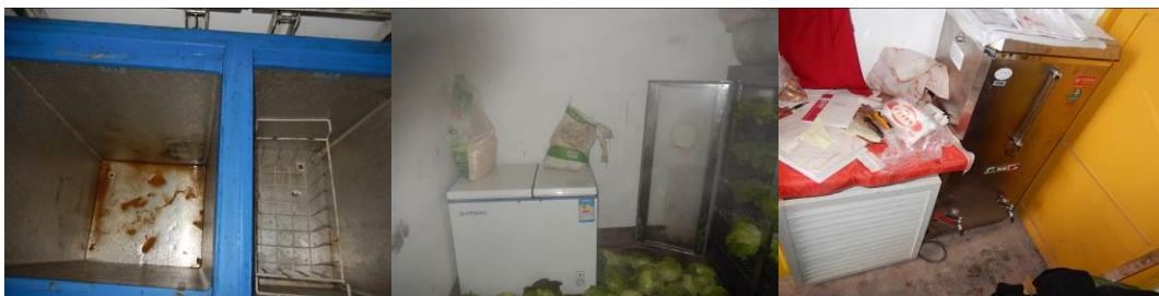
图 19 部分设备组图

(2) “菜品留样”取 1 分，扣分原因为没有菜品留样和相关留样登记，校方回应校长请假不知情，也一直没有搞过菜品留样，下次一定按要求做。