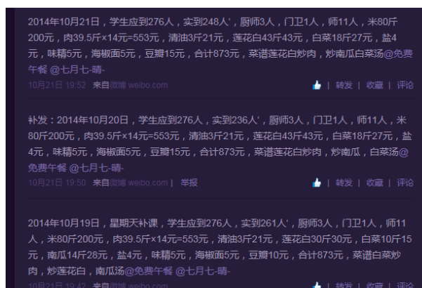
图6 就餐人数的微博截图

当日就餐人数:学生235人(请假33人)+厨师3人+老师9人(请假1人)+调查人员2人=249人(调查人员缴餐费10元)。实际用餐人数与该校微博公示内容不一致,主要体现在:其一,校方提供的学生应到人数总数为270人,提供的各班级应到人数的总和为268人,各班级实到人数的总和为235人;其二,微博公示的学生应到用餐人数为276人,实到用餐人数为236人;其三,微博公示没有调查人员在校的就餐情况。