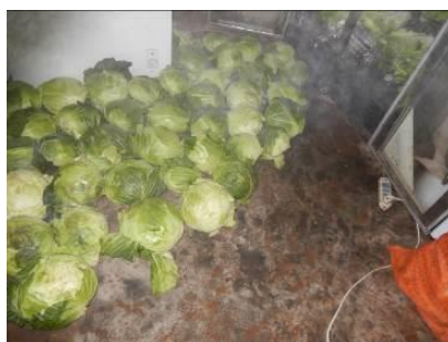
图 9 排放在地面上的食材图

(3)“食材储藏”取 3 分,扣分原因因为储存的莲花白直接排放在地面上,没有采取安全隔离措施(附图片)。