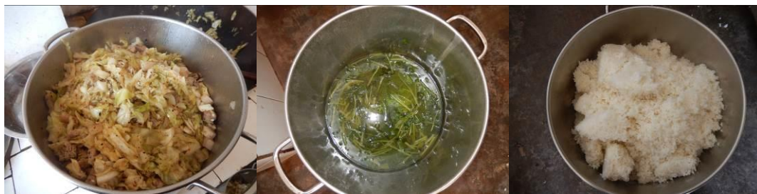
图 17 当日菜品组图