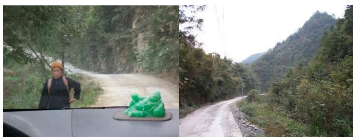
图 1 路况