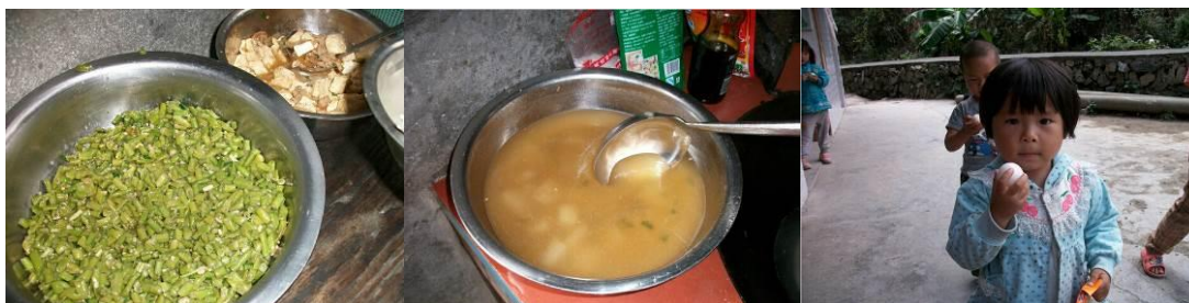
图 10 当日午餐

(5) “饭菜异物”取 5 分, 原因为: 在校与师生同餐, 当日供餐没有发现异物。