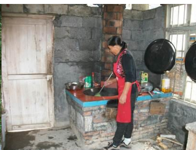
图 6 厨师