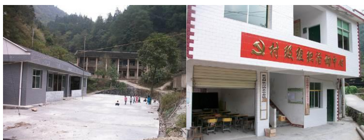
图 2 学校