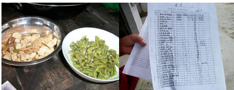
图 14 菜品留样