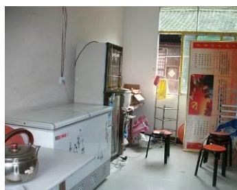
图 8 储藏室