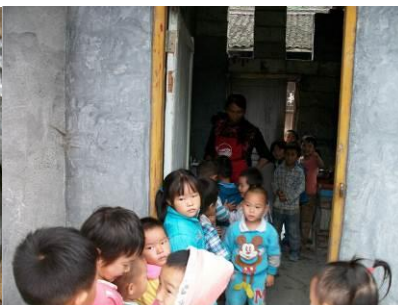
图 12 分餐