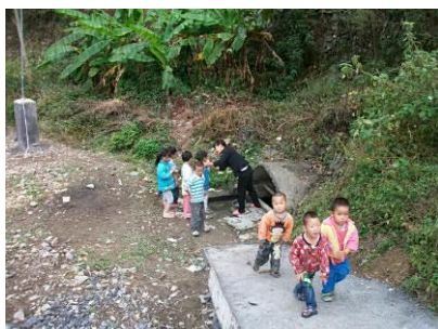
图 5 餐前洗手

(6)“餐前洗手”取 5 分,原因为:该校学生均年幼,留守儿童居多。餐前,孩子们会在水井边排队,由学前班老师负责洗脸和洗手。