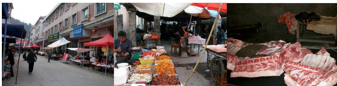
图 3 集市 (中寨)