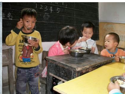
图 13 用餐