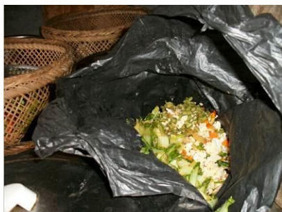
图 11 餐余 (10月20日)

(4)“浪费情况”取 5 分, 原因为: 调查人员连续两天到校, 该校餐余不多, 均用塑料袋装盛。