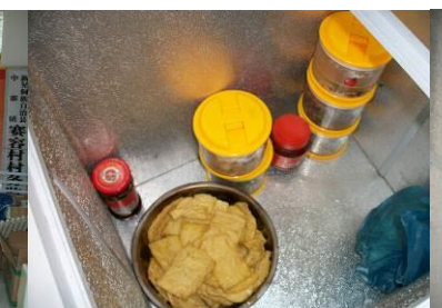
图 9 冰柜