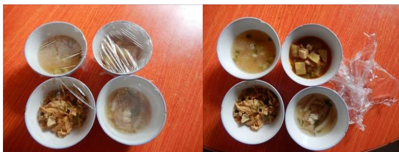
图 14 菜品留样组图

(1) “菜品留样”取 1 分, 扣分原因为通过查看前两天的菜品留样不达标, 留样不全, 只有菜品没有米饭, 且没有相关留样登记 (附图片)。