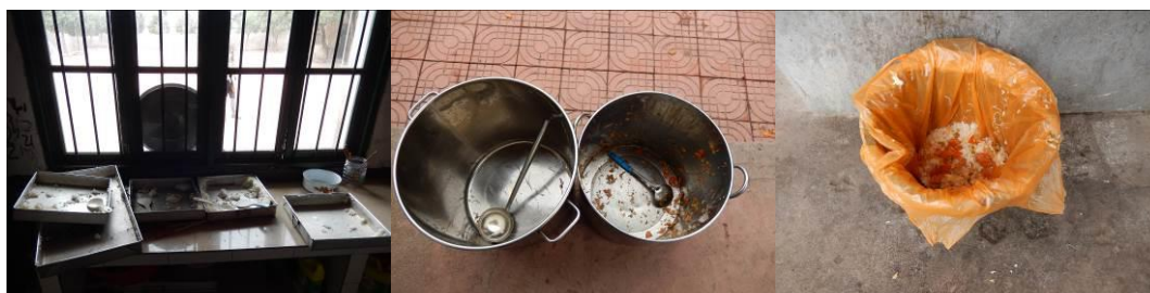
图 16 剩菜剩饭组图

(3)“浪费情况”取 3 分，扣分原因为学生用完餐后，洗碗的学生很少，且泔水桶的剩菜剩饭也不多。后来调查人员与校长查看学生餐具存放情况的时候意外发现，该校 60% 的学生碗里都有剩菜剩饭，且有 10% 左右的学生有大半碗没吃完，经过询问他们普遍说带回家喂猪喂鸡。校方回应，怕学生不够吃，饭打的量都较多（附图片）。