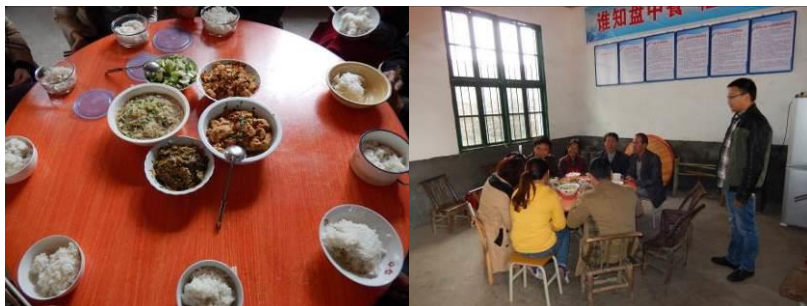
图 15 教职工用餐组图

虽然学生的菜老师也吃，但老师每天加两个菜。校方回应老师加菜是老师工作太辛苦，担心老师吃不好（附图片）。