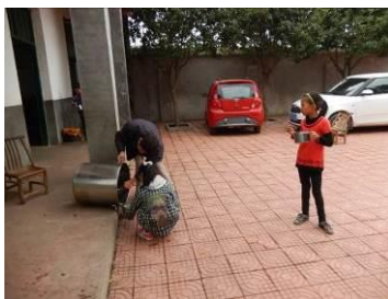
图 23 没吃饱的学生加饭菜图