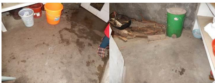
图 11 地面卫生组图