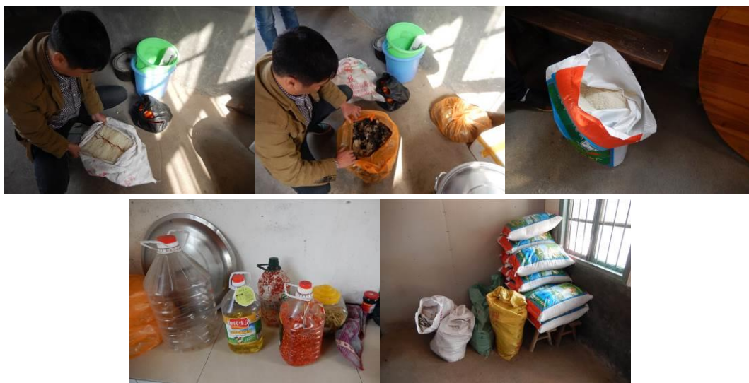
图 12 食材储藏组图