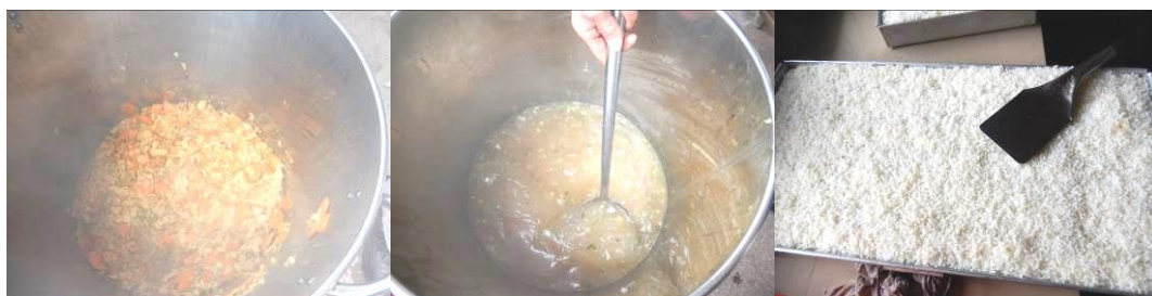
图 13 当日菜品组图

当日饭菜质量情况概述: 通过品尝当日饭菜, 感觉口味比较可口, 咸淡适中。经老师介绍, 结合查看一周的微博公示, 菜品不重复。通过观察学生用餐全程, 老师分餐组织比较严密, 最后把桶里的菜全部分给有需要的学生。