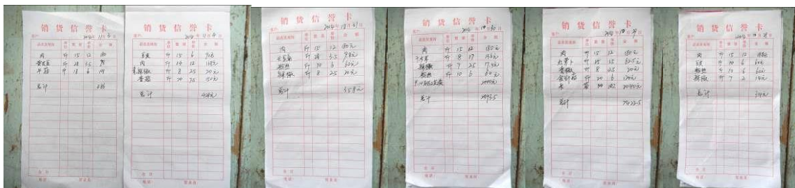
图 24 原始凭证组图

(1) “原始凭证”取 3 分, 扣分原因为有原始凭证, 但不完整, 没有学校相关人员签字, 没有供货商签字盖章, 不能保障食材供应的绝对安全 (附图片)。