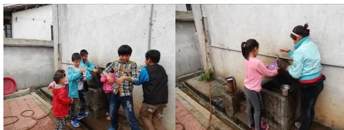
图 8 洗手学生组图

(4) “餐前洗手”取 3 分, 扣分原因为餐前只有少部分学生洗手。校方回应山里娃没有餐前洗手的习惯, 学校也讲了, 但没有强制要求 (附图片)。