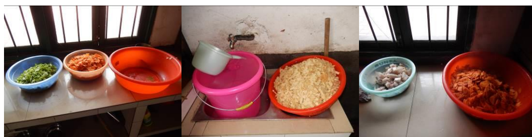
图 10 工作台生熟食分开图