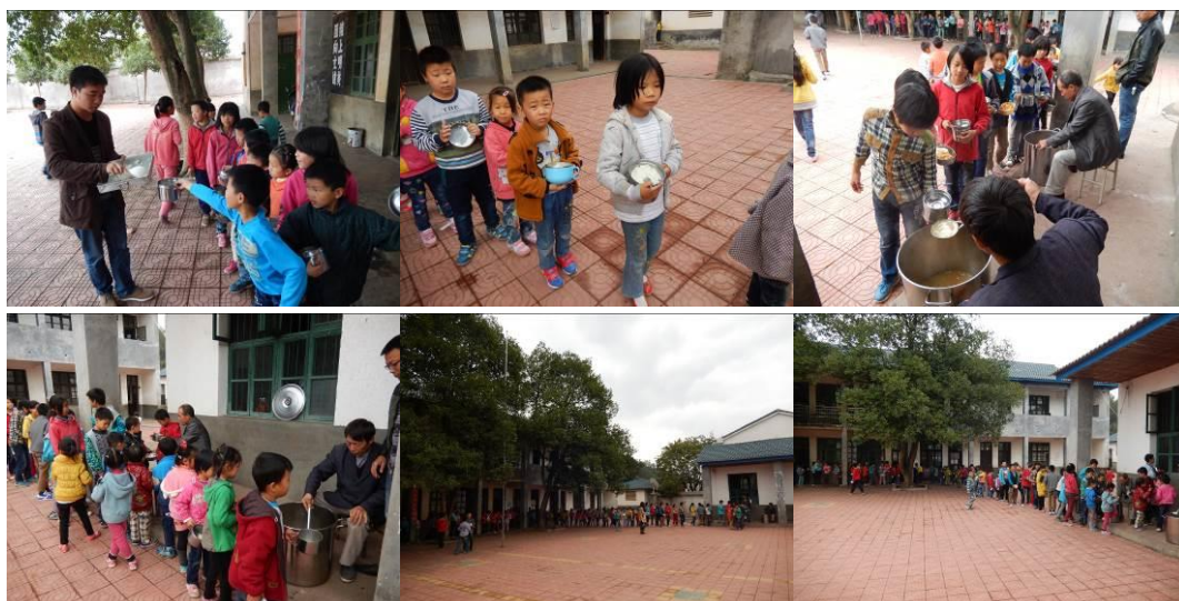
图 21 井然有序分餐组图