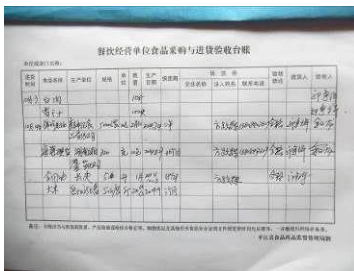
图 25 采购台账图

(3)“现金流水账”取 3 分,扣分原因为有现金流水账,但不完整,没有相关人员签字,不能做到有效监督(附图片)。