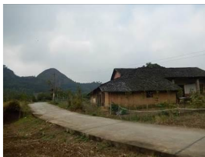
图 2 大塘村民居组图

长寿镇原名“古江洲”, 又名“将军镇”, 地处汨罗江上游, 平江县东部, 现辖 3 个居委会, 51 个行政村。