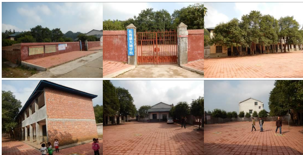
图 3 学校组图

该校现有 6 个年级, 7 个教学班, 为一至六年级和学前班, 共有学生 104 人, 教师 8 人, 厨师 1 人。