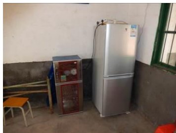
图 20 厨房设备正常使用图