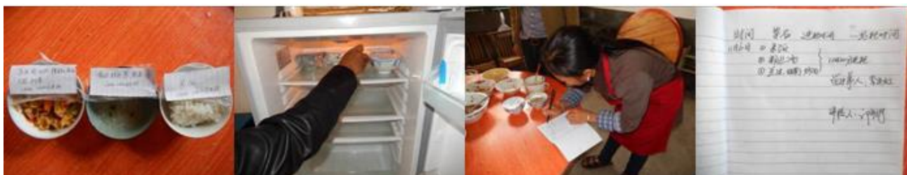
图 19 纠正后的菜品留样储存与登记组图