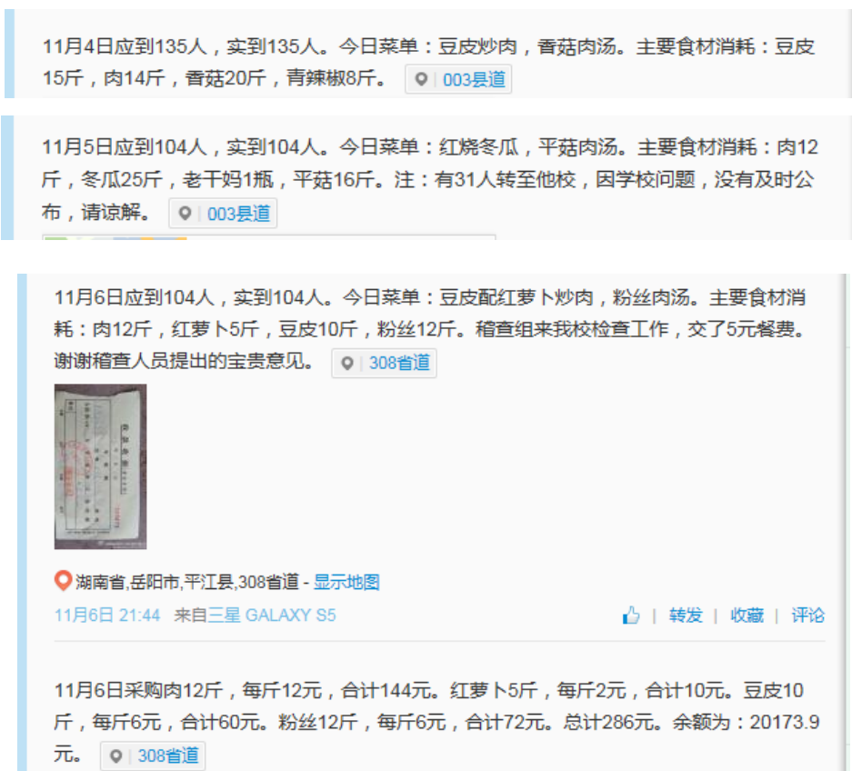
图 4 就餐人数的微博截图

当日就餐人数: 学生 104 人+厨师 1 人+老师 8 人+稽核员 1 人=114 人(稽核员缴餐费 5 元, 实际用餐人数与微博公示内容不一致。出现的问题有:(一)没有公示教职工用餐人数;(二)微博公示一直没有体现主食大米饭, 也无大米的使用与消耗记录情况。