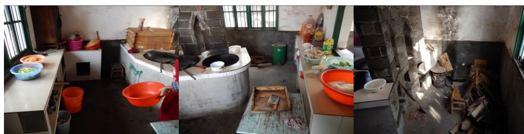
图 9 厨房工作台组图