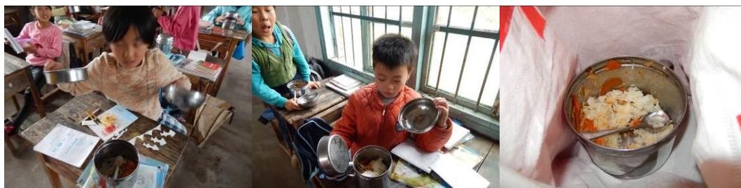
图 17 学生餐具内的剩菜剩饭组图