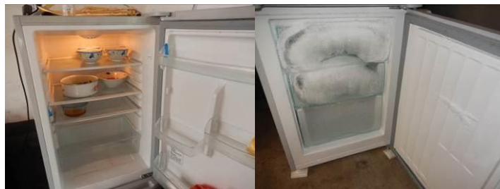
图 7 冰箱内部组图

(3) “易变质食物保存”取 3 分, 扣分原因为冰箱的冷藏间内菜品留样是用保鲜膜包裹进行隔离储存, 冰箱内还存放三个碗, 里面有食物没有采取包装隔离措施, 存在一定安全隐患 (附图片)。