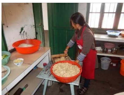
图 5 厨工头部卫生图

(1) “厨工头部卫生”取 3 分, 扣分原因为现场的一名厨师没有戴工作帽, 但头发比较干净。厨师回应, 有时戴有时不戴, 学校也没有严格规定。(附图片)。