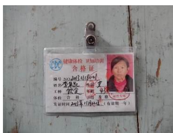
图 18 厨师健康证图