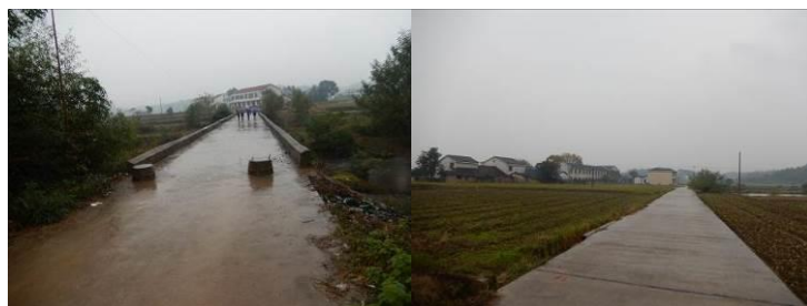
图 1 路况组图

11 月 7 日, 全天中雨。上午 8:00 从天岳汽车站乘小巴车至安定镇官塘(票价 5 元), 在官塘汽车站转乘浏阳社港方向的小巴车至徐家江桥(又名同济桥)(车费 2.5 元), 9:20 到达, 步行 1 华里至岳田村。时间尚早故走访村民, 10:00 进校进行调查。由于调查当日学校进行期中考试, 中午不开餐, 稽核员通过向部门负责人请示汇报后, 对该校现有情况进行了调查。中午 11:30 离校, 步行至徐家江桥, 12:00 乘小巴车至官塘汽车站(车费 2.5 元), 换乘至平江县城的小巴车返回天岳汽车站(票价 5 元), 夜宿车站附近海天宾馆(住宿费 150 元/天)。