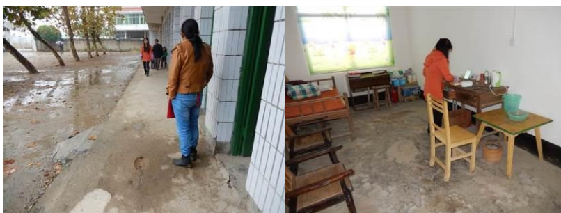
图3 漏雨的教学楼与老师宿舍的旧家具组图

施工拌水泥,施工队撤走后把操场搞的像垃圾场,相关部门也不管不问,现在荒草遍地,教学楼年久失修,在雨天漏雨也得不到及时维修,学校多次向相关部门反映都没有任何效果,老师很无奈。调查人员在村子里走访,转了半个多小时才在别墅群里发现一座土房子。这里官、民比较富裕,但教育却发展滞后,值得关注和思考。