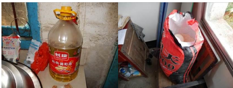
图 11 食材储藏组图