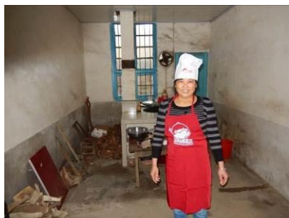
图6 厨工正规着装图