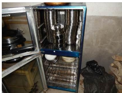
图 10 学生的餐具存放图