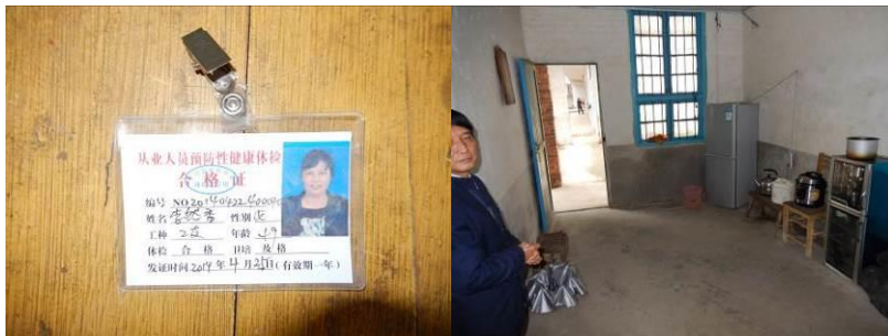
图 12 厨师健康证图