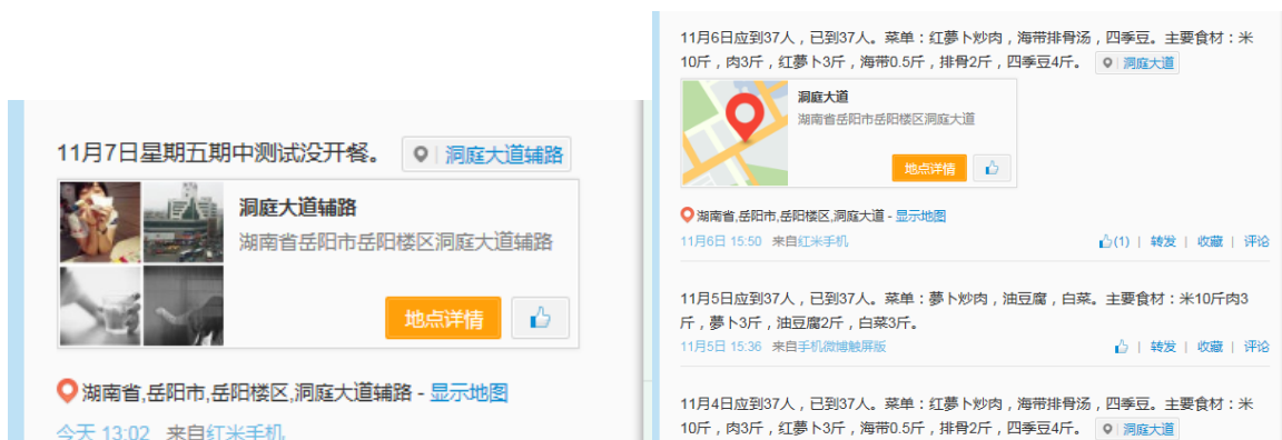
图 5 近日就餐人数的微博截图