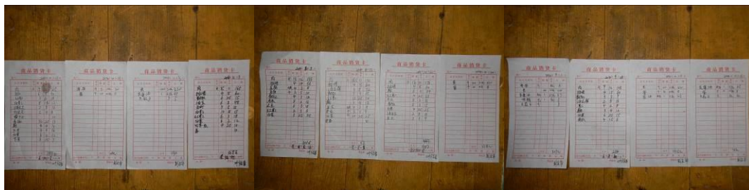
图 14 原始凭证组图

(3)“原始凭证”取 3 分,扣分原因为有原始凭证,但不完整,只有供货商签字,没有学校相关人员签字,不能保障食材供应的绝对安全(附图片)。