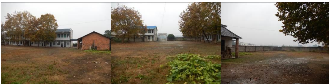
图 4 学校组图