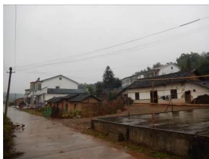
图 2 岳田村民居图

安定镇位于平江县南部, 东北接三市镇, 西南近浏阳市社港镇, 东南邻思村乡, 西北接三阳乡。1995 年, 大桥乡、长田乡、安定镇合并为安定镇。