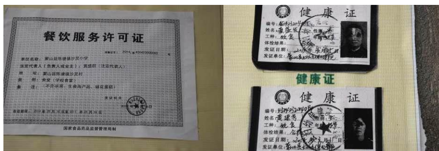
图 6 餐饮许可证及厨师健康证在有效期内