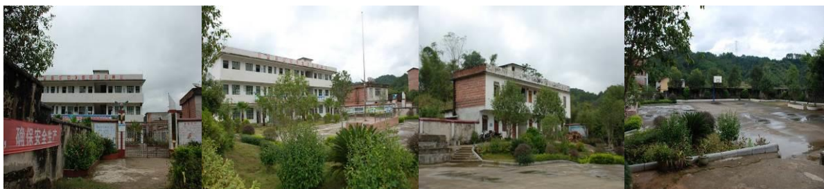
图 1 学校外观

免费午餐于 2014 年 5 月 20 日在该校正式开餐。中国社会福利基金会免费午餐基金向该校提供一笔开餐资金(用于购置冰箱等或厨房用品等)以及现在 2 名厨师 800 元/月/人的工资及 14 名教职工 3 元/人/餐的午餐费。现 121 名义务教育阶段学生由国家营养改善计划提供 3 元/人/餐的午餐费, 免费午餐向 28 名学前班儿童提供 3 元/人/餐的午餐费, 午餐不收取学生费用。