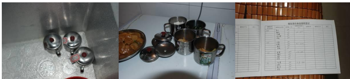
图 8 菜品留样合规范