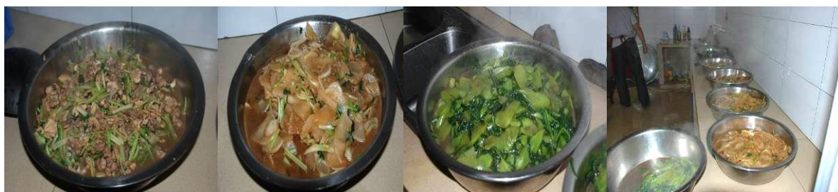
图 5 当天菜品

学校当天菜品是芹菜炒鸡肉、炒萝卜、炒莴笋，主食为米饭。菜品丰富，口味好。（见图 5）未见食品中有异物。