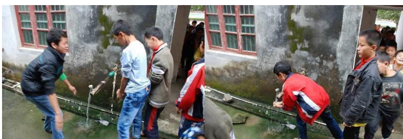
图 4 学生餐前排队洗手