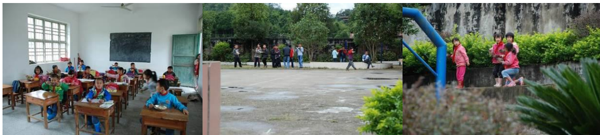
图 10 学生在教室或操场用餐