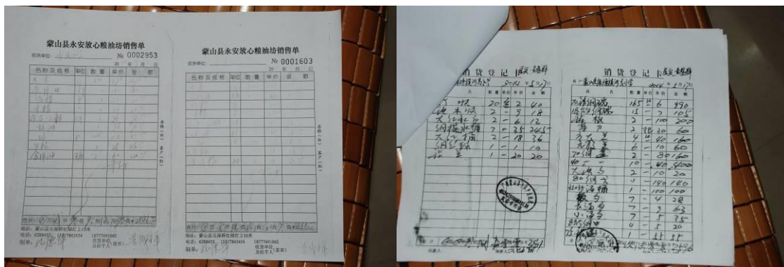
图 12 原始凭证