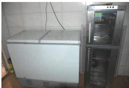
图 7 设备正常使用