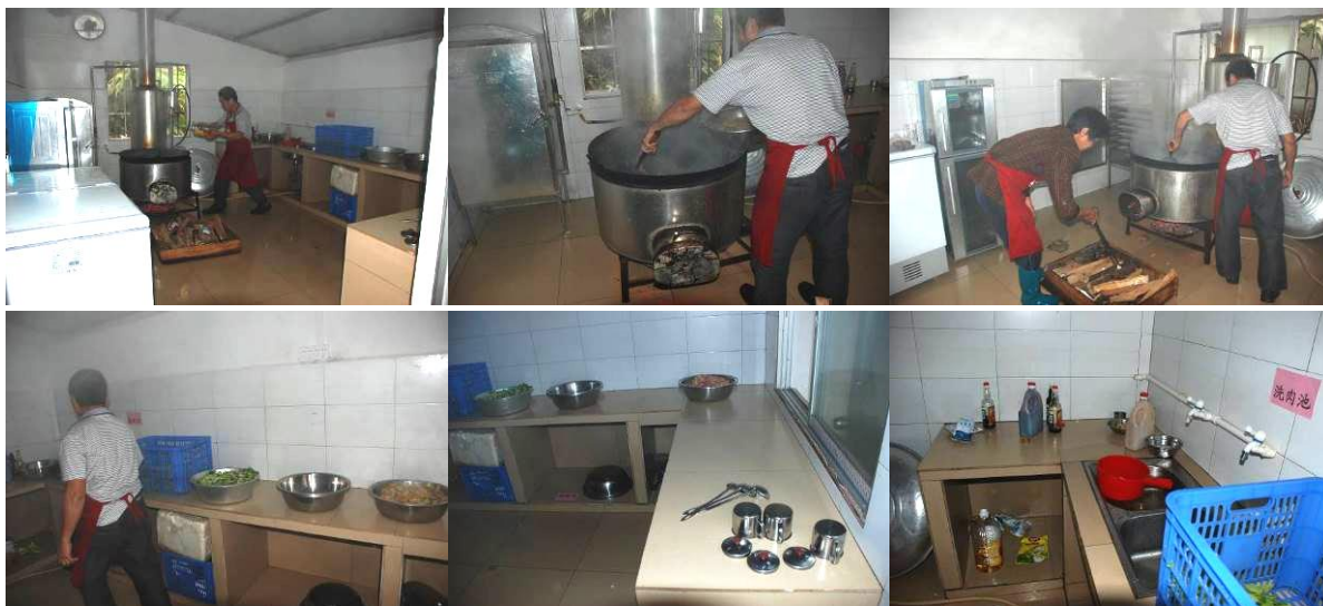
图 3 厨房及厨师