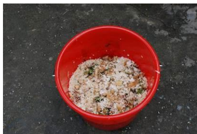
图 11 剩饭菜在正常范围