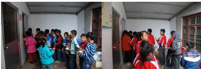
图 9 学生排队分餐（秩序良好）