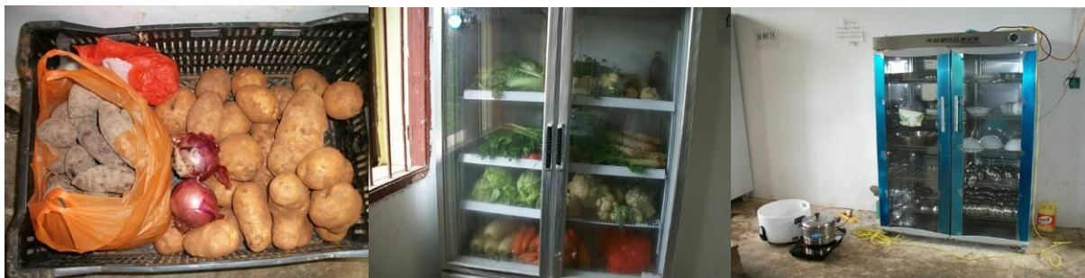
图 8 冰柜及库存