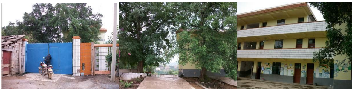
图3 幼儿园（学前班，小学旧校区）