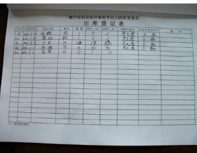
图 19 出库登记表