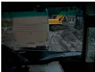
图 1 路况

学前班的免费午餐工作分工如下: 陈艳老师负责资金管理, 王磊老师负责微博及账务管理, 采购则由四名老师 2 人一组轮流负责(以周为单位, 每周采购 2 次)。