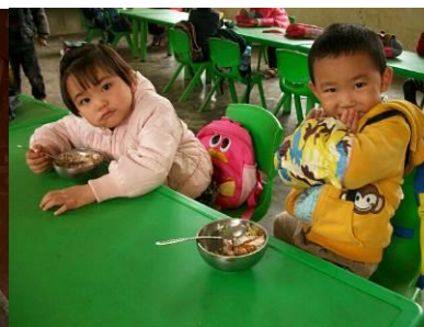
图 12 用餐