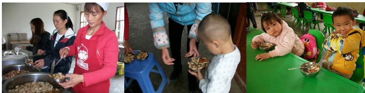
图 11 分餐

(4) “浪费情况”取 5 分，原因为：基本光盘，个别有丢弃的情况，但由于是小碗，不存在浪费。餐余桶较满，经了解，由于下雨积水，该校餐余桶已有三天没有清理。