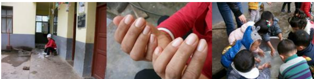
图 5 厨师

(6) “餐前洗手”取 5 分, 原因为: 下课后, 老师用大盆盛水, 组织孩子们分班级分男女排队洗手。