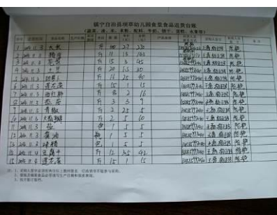
图 18 进货台账