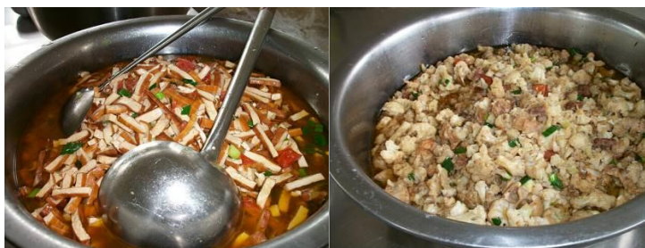
图 10 供餐菜品