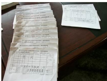
图 16 食品、食材采购清单