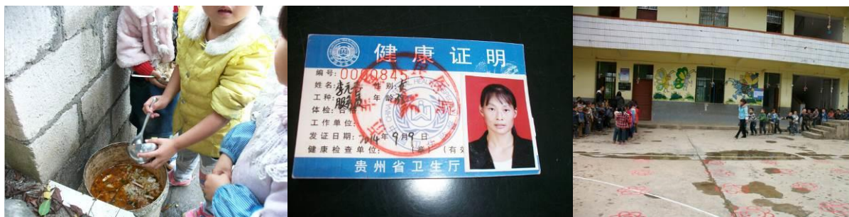
图 13 餐余