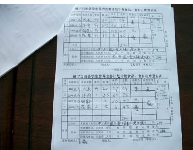
图 17 食品、食材出库登记表