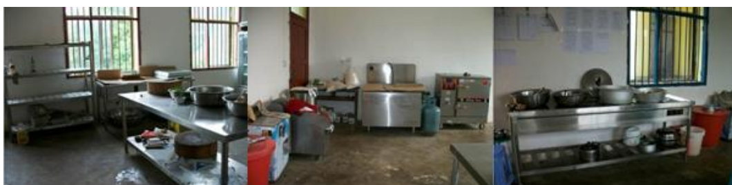
图 7 厨房及设备