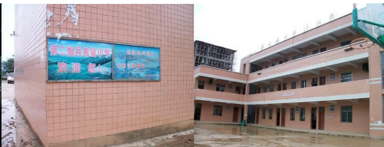
图 2 小学(今年 9 月启用的新校区)