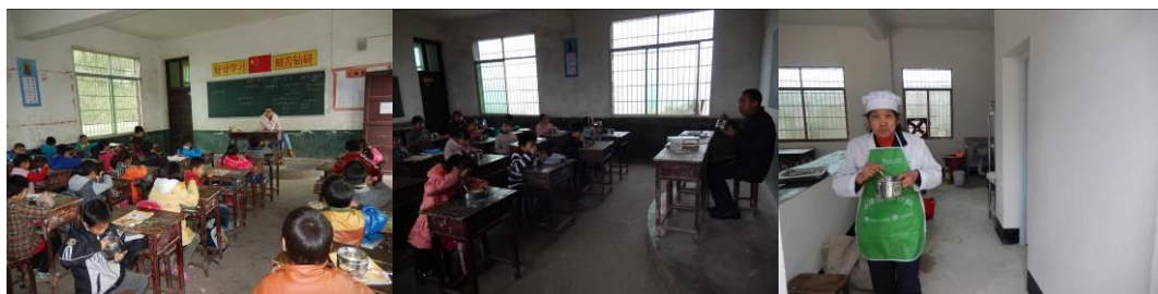
图 23 教职工用餐组图