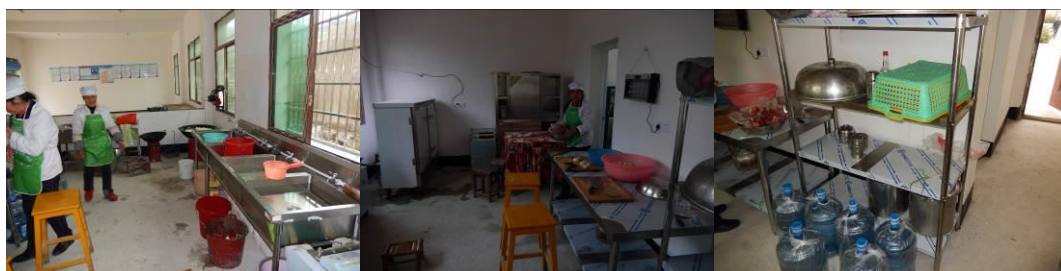
图 8 厨房工作台组图