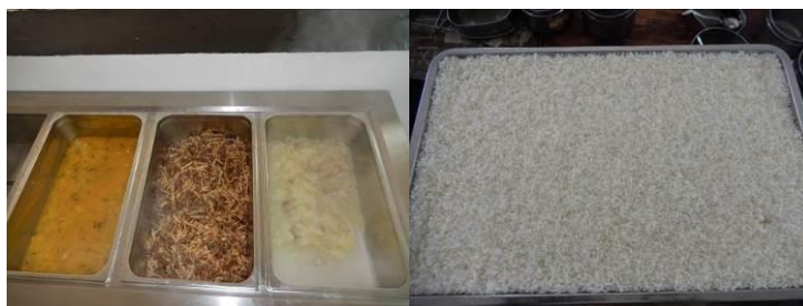
图 13 当日菜品组图