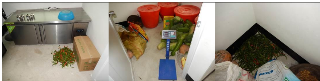
图 5 部分食材储存组图

(3) “餐前洗手”取 3 分, 扣分原因为餐前只有少部分学生洗手。校方回应学校用水困难, 水是在村里接的, 经常不定时停水, 学校准备了备用水箱, 没有强制要求所有学生餐前洗手 (附图片)。