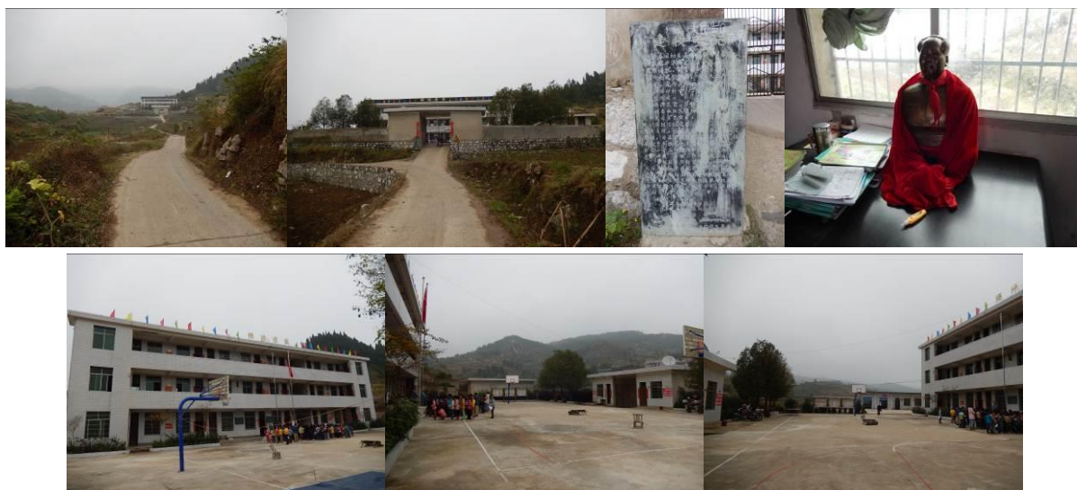
图 2 学校组图

该校现有 6 个年级, 7 个教学班, 为一至六年级和学前班, 共有学生 154 人, 教师 9 人, 门卫 1 人, 厨师 2 人。