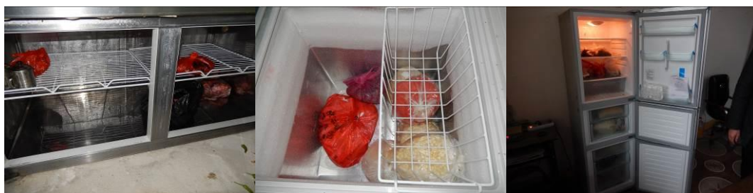
图11 易变质食物妥善保存组图