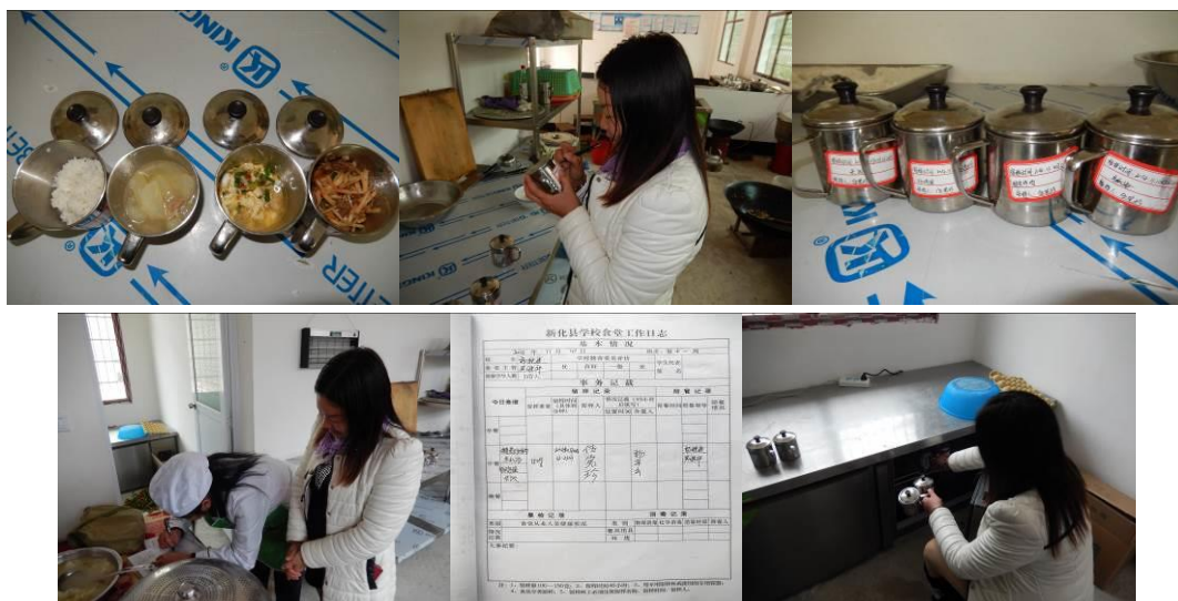
图 18 纠正后的菜品留样储存与登记组图