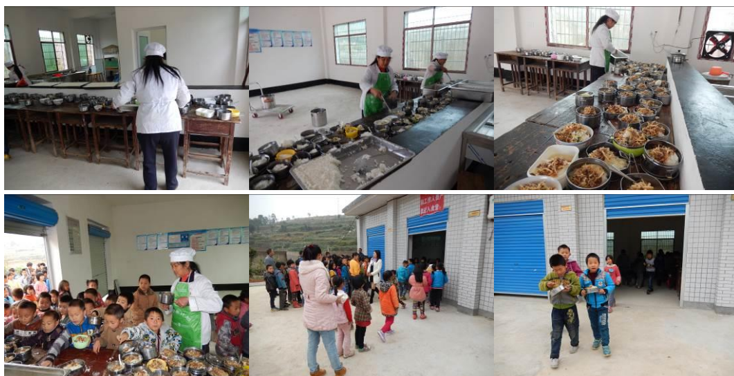
图 20 井然有序分餐组图