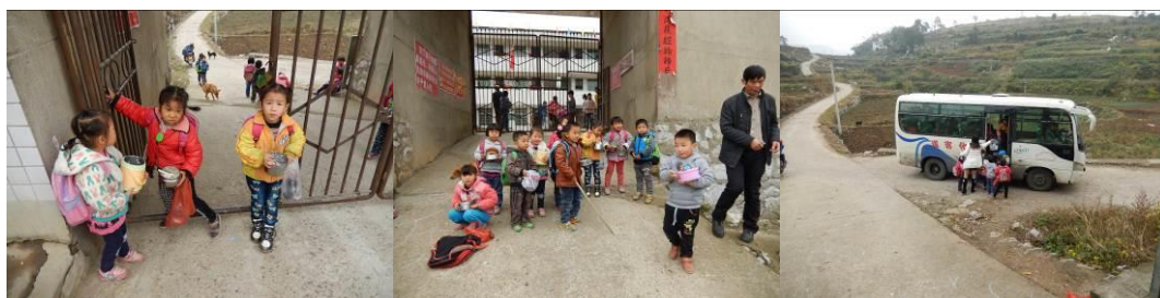
图 22 学前班学生用餐组图