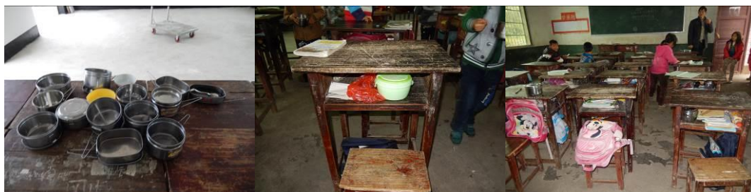
图 4 学生的餐具清洗存放组图

(1) “餐具消毒”取 3 分, 扣分原因为学校用水困难, 有时停水, 学生餐具均由自己带回家由家长清洗, 餐后学生将餐具放在书包里。部分学生用塑料袋包装餐具, 开餐前厨师将学生餐具集中在厨房进行统一消毒后, 再进行分餐 (附图片)。