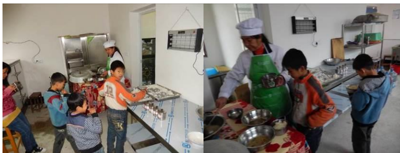
图 24 没吃饱的学生添加饭菜组图