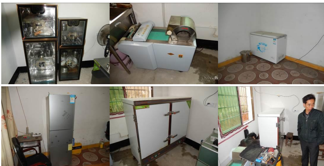
图 19 厨房设备正常使用与出现故障及时维修组图