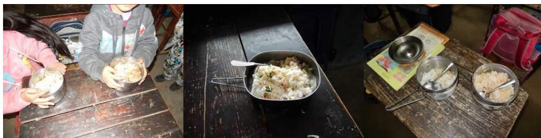
图 16 学生餐具内的剩菜剩饭组图