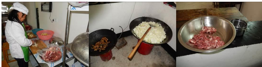
图9 工作台生熟食分开组图