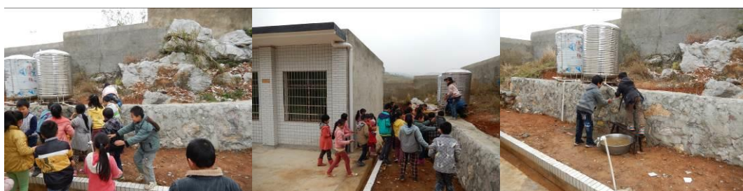
图 6 餐前部分洗手的学生组图

(3) “餐前洗手”取 3 分, 扣分原因为餐前只有少部分学生洗手。校方回应学校用水困难, 水是在村里接的, 经常不定时停水, 学校准备了备用水箱, 没有强制要求所有学生餐前洗手 (附图片)。