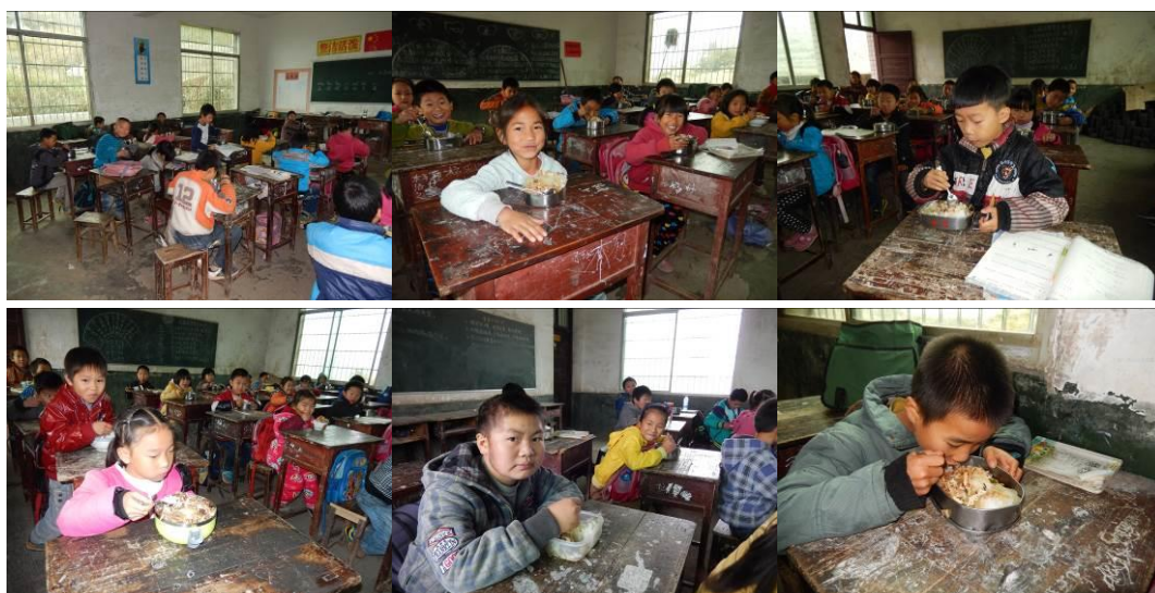
图 21 学生用餐组图