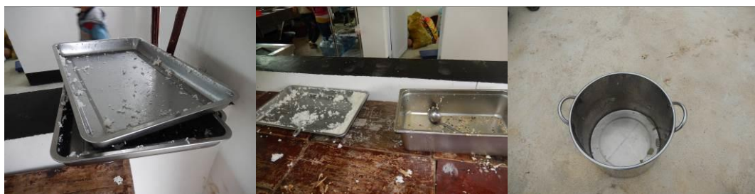
图 15 剩菜剩饭组图