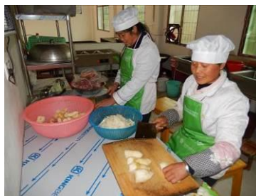
图 7 厨师正规着装图