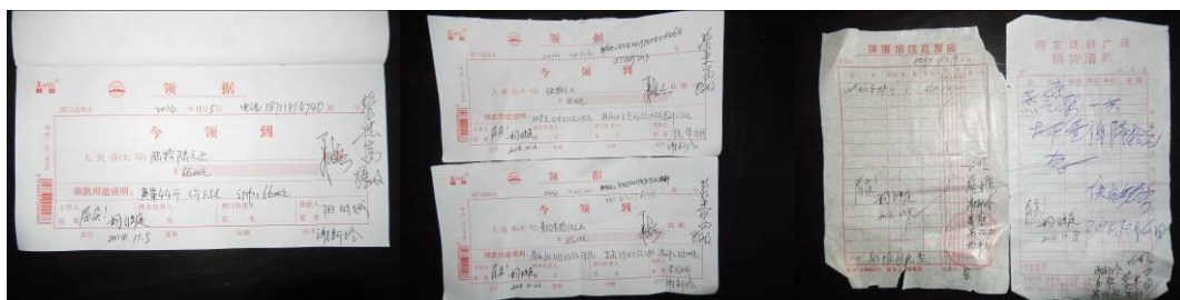
图 25 原始凭证组图