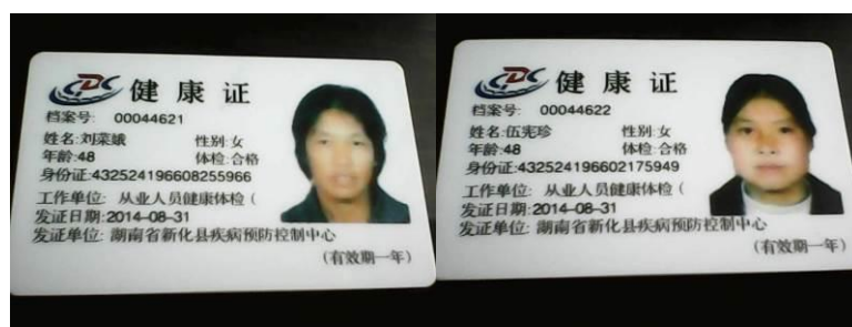
图 17 厨师健康证组图