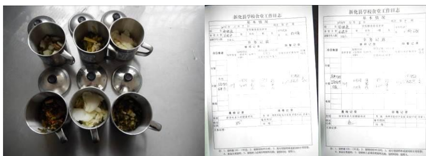
图 14 菜品留样组图

(1) “菜品留样”取 3 分, 扣分原因为通过查看, 前两天的菜品留样不达标, 留样不全, 只有菜品没有米饭。相关留样登记比较全面, 但部分菜品名称写成了食材名称, 调查后已纠正 (附图片)。