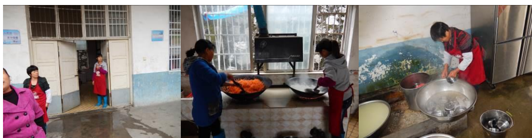
图 6 厨师着装组图

(1) “厨工头部卫生”“厨工工服着装”各取 3 分, 扣分原因为四个厨师均未戴帽子, 有一名厨师没有穿工作服, 其头部卫生和衣服都比较干净 (附图片)。