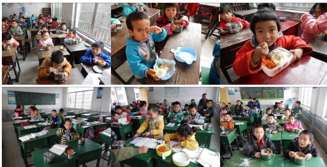
图 26 学生用餐组图