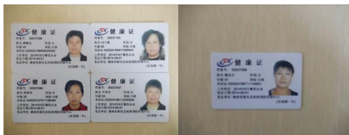
图 21 厨师与采购员健康证组图