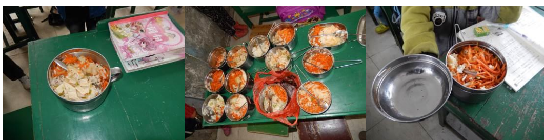
图 19 学生餐具内的剩菜剩饭组图