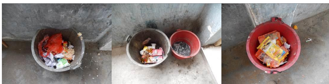
图 20 学生吃完零食后的垃圾残余组图