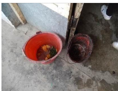
图 15 厨师倒掉的菜品留样图