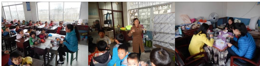
图 17 教职工用餐组图

(2) “师生同餐”取 3 分, 扣分原因为老师虽然与学生吃的一样, 但只有少部分老师同学生共同用餐。大多数老师在办公室用餐, 没有组织学生用餐, 使学生用餐秩序较乱, 不能关注学生的用餐情况, 造成部分班级剩菜剩饭情况严重 (附图片)。