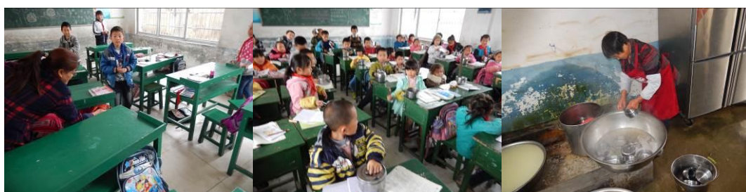
图 8 学生的餐具存放清洗组图

(3) “餐具消毒”取 3 分，扣分原因为学校正在建设新厨房，目前水管较少，用水困难，学生餐具均由自己带回家由家长清洗，餐后学生将餐具存放在书包里，部分班级的学生对餐具采用塑料袋包装，开餐前厨师将学生餐具集中在厨房进行统一消毒处理后，再进行分餐，学生自己保存餐具没有隔离措施的存在安全隐患（附图片）。