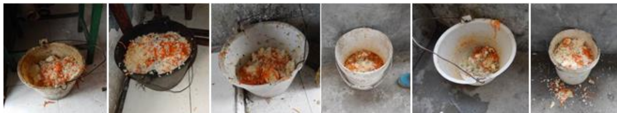
图 18 剩菜剩饭组图

常用餐。调查人员分析造成浪费严重的原因有: 一是学校在分餐方式上不够科学, 二是老师在组织用餐时不够严密, 三是学生在小卖部购买了大量零食。(附图片)。