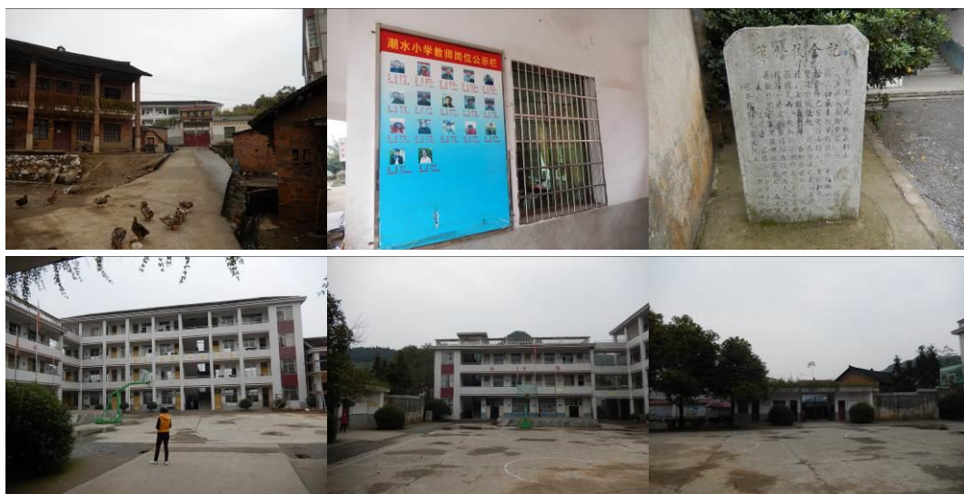
图 2 学校组图

该校现有 6 个年级，13 个教学班，为一至六年级和学前班，共有学生 498 人，教师 18 人，门卫 1 人，厨师 5 人（含采购员 1 人）。