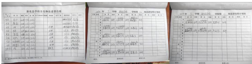
图 27 出、入库登记组图

(2) “现金流水账”取 1 分，扣分原因为只有上半年的现金流水账，校方回应：下半年从 9 月 2 日开始，由于免费午餐专款没有到位，许多大件食材为赊账，无法做账。免费午餐专款上周才到账 46612 元。校长说免费午餐专款先拨到县非税局，再进国库，经过财政局、教育局层层审批，需一两个月时间，遇到周末机关单位是不办公的，会一直拖延这么长时间。目前大米、肉大宗食材为赊账，无原始发票，两个多月肉欠 3 万多元，大米欠 2 万多元，其余食材是 高利贷借款付款，现利息为 3 千元左右，校长说专款虽下来了还不够还账的钱，有苦难言 （附图片）。