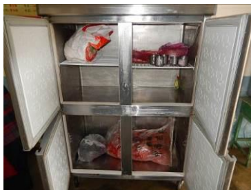
图 12 易变质食物妥善保存组图