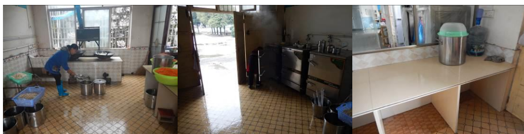
图 10 厨房工作台组图