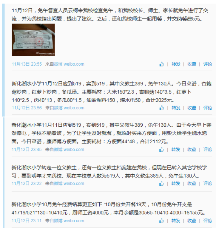
图 5 就餐人数的微博截图