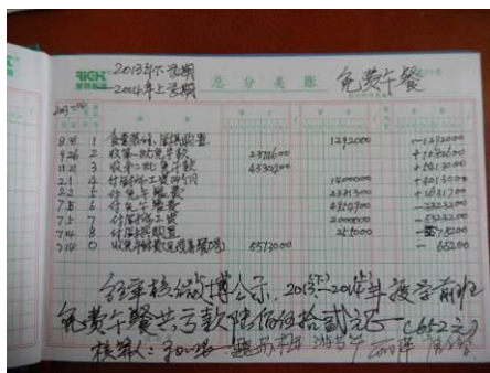
图 28 现金流水账图

(2) “现金流水账”取 1 分，扣分原因为只有上半年的现金流水账，校方回应：下半年从 9 月 2 日开始，由于免费午餐专款没有到位，许多大件食材为赊账，无法做账。免费午餐专款上周才到账 46612 元。校长说免费午餐专款先拨到县非税局，再进国库，经过财政局、教育局层层审批，需一两个月时间，遇到周末机关单位是不办公的，会一直拖延这么长时间。目前大米、肉大宗食材为赊账，无原始发票，两个多月肉欠 3 万多元，大米欠 2 万多元，其余食材是 高利贷借款付款，现利息为 3 千元左右，校长说专款虽下来了还不够还账的钱，有苦难言 （附图片）。