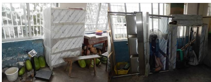
图 24 还未投入使用的新捐赠厨房设备组图