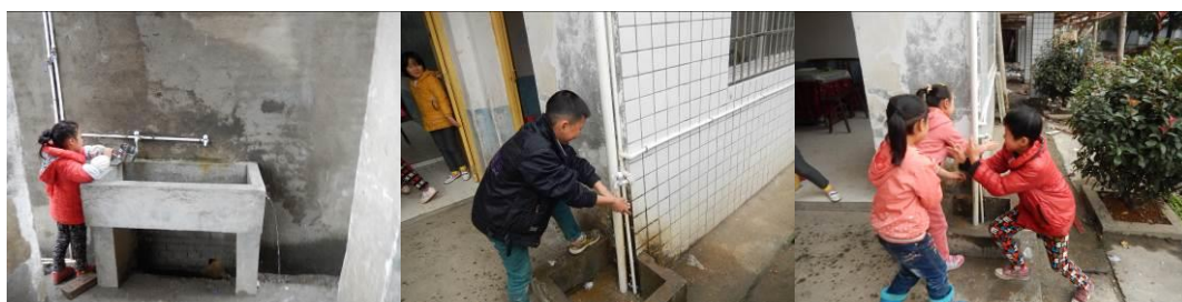
图 9 餐前极少部分洗手的学生组图

(4) “餐前洗手”取 1 分，扣分原因为餐前只有极少部分学生洗手。校方回应水管少、用水困难，未强制所有学生餐前洗手，新食堂建好后全面步入正规化管理（附图片）。