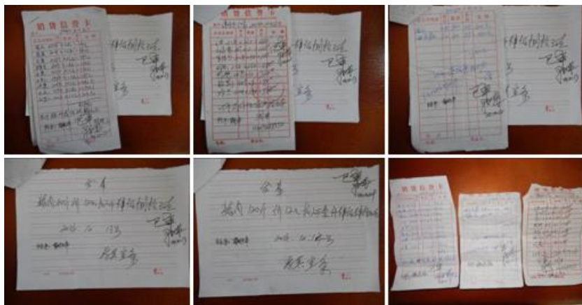
图 29 原始凭证组图