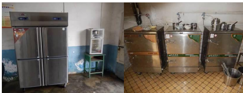
图 23 厨房设备正常使用组图