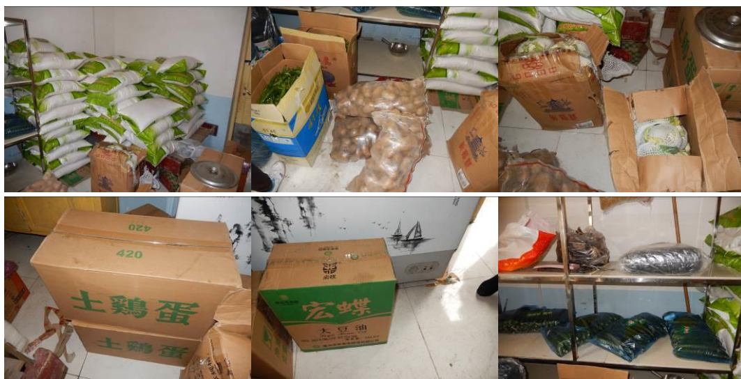
图 13 食材储藏组图