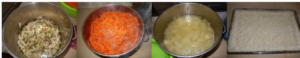
图 14 当日菜品组图