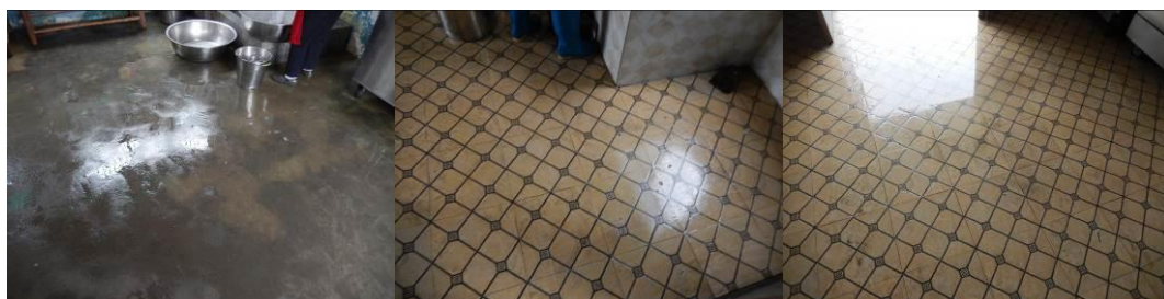
图 7 地面卫生组图

(3) “餐具消毒”取 3 分，扣分原因为学校正在建设新厨房，目前水管较少，用水困难，学生餐具均由自己带回家由家长清洗，餐后学生将餐具存放在书包里，部分班级的学生对餐具采用塑料袋包装，开餐前厨师将学生餐具集中在厨房进行统一消毒处理后，再进行分餐，学生自己保存餐具没有隔离措施的存在安全隐患（附图片）。