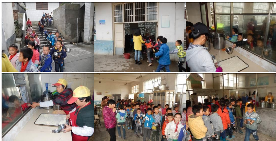
图 25 井然有序分餐组图