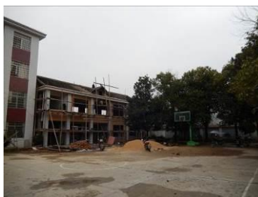
图 3 正在建设的新食堂图