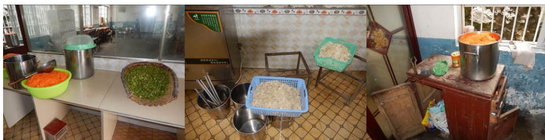
图 11 工作台生熟食分开组图