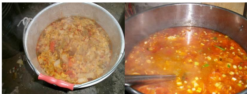
图 11 供餐菜品（小学的白菜汤） 图 12 供餐菜品（学前班的西红柿鸡蛋汤）