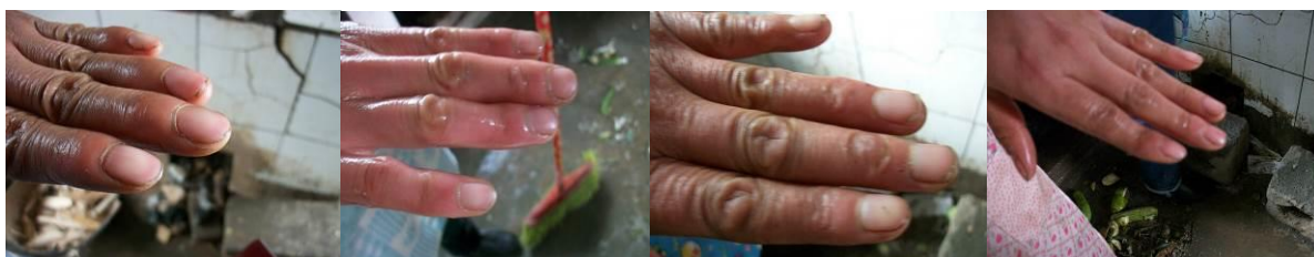
图 4 厨师手部卫生