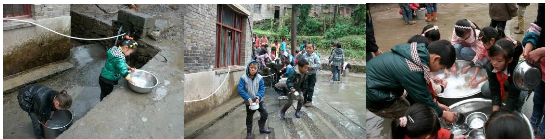
图 8 餐具清洗