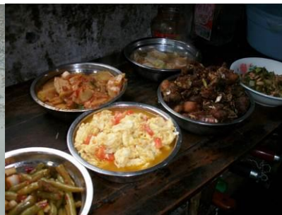
图 20 调查人员到校的加菜 (炒白菜和西红柿炒鸡蛋)