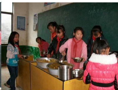
图 17 分餐