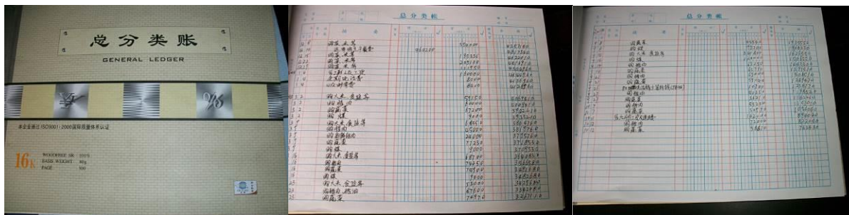
图 22 流水帐