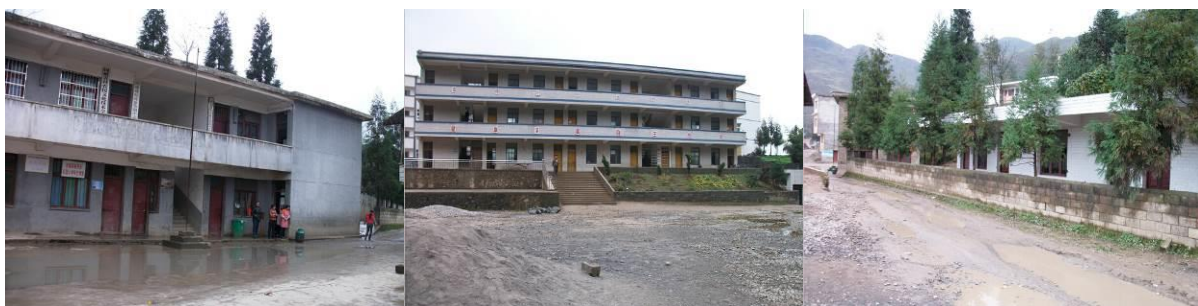
图 1 学校

该校设有学前班及小学, 学生人数 661 人 (其中学前班 83 人)。据张小七老师介绍, 厨师 5 人 (调查当天 4 人在岗), 老师 24 人 (含学前班老师 2 人)。学校无围墙, 操场未硬化, 各年级分别安排在两栋楼里。免费午餐具体工作分工如下: 顾光亮老师负责资金, 张小七老师负责账目、赵远友和金礼, 再随机加一位老师, 三人负责采购。