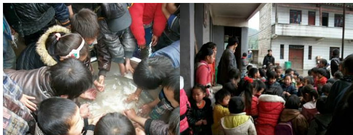
图 9 餐前洗手