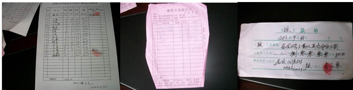
图 21 原始凭证

财务上需加强的工作是，请克服困难，及时登帐。学校解释，由于负责的老师家属生孩子，比较忙给耽误了。