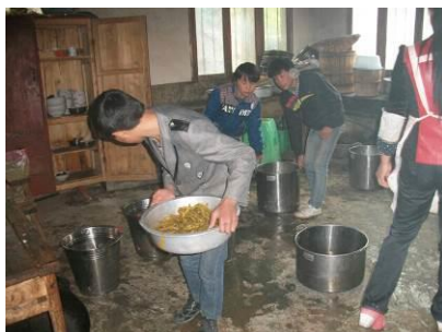
图 16 领餐