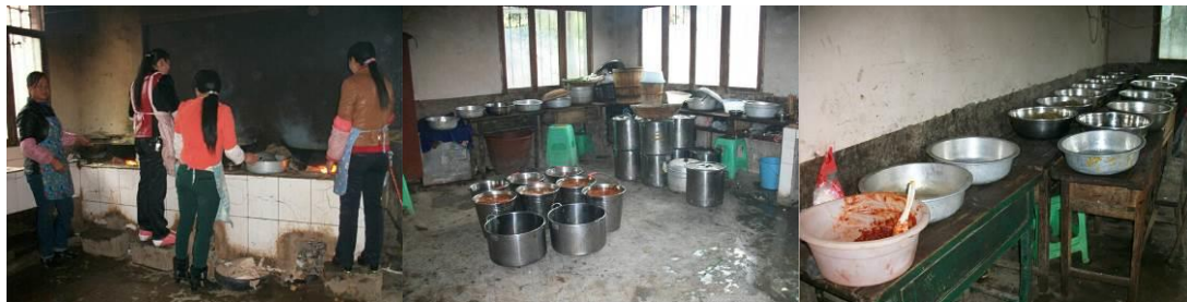
图 3 厨房及厨师

(3) “餐前洗手”取 5 分, 原因为: 学前班安排了餐前洗手, 但小学各年级没有相关组织。