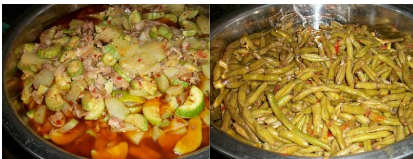
图 10 供餐菜品（小学与学前班相同的主菜）