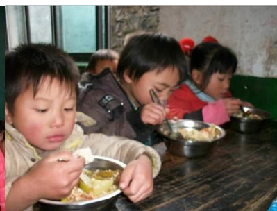
图 18 用餐