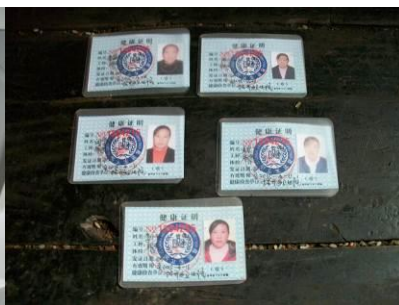
图 15 厨师健康证