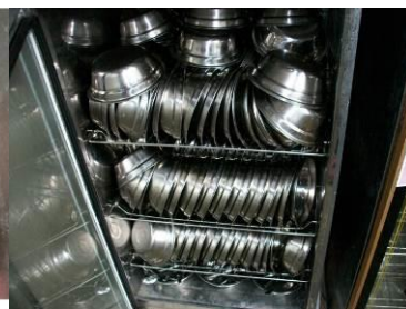
图 6 消毒柜