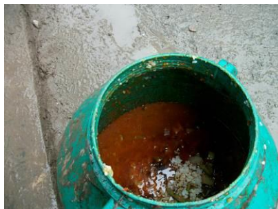
图 19 餐余