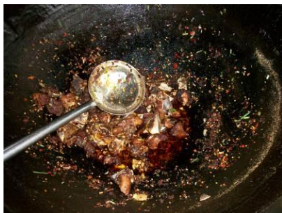
图 13 老师的小灶 (餐后剩余)

(4) “浪费情况”取 5 分, 原因为: 近 700 人用餐, 餐余不足半桶, 浪费很少。