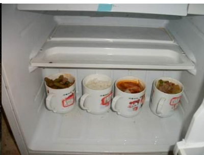
图 14 菜品留样