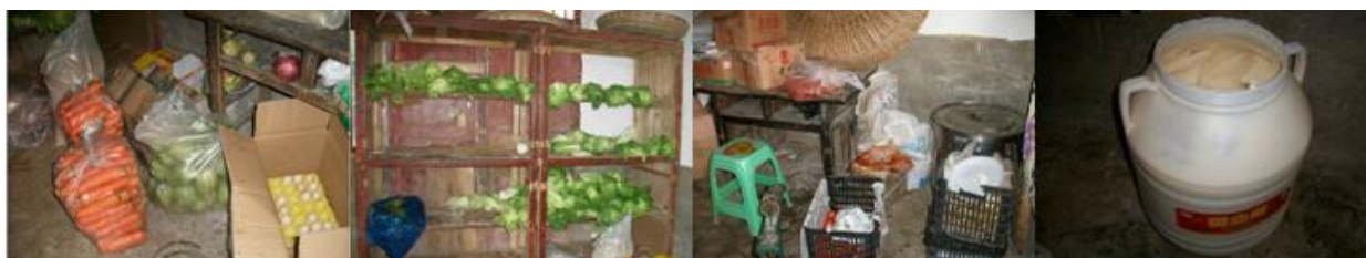
图 7 储藏室