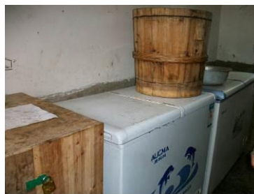
图 5 冰柜