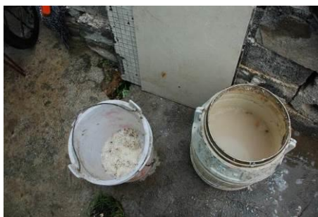
图 11 剩饭菜在正常范围