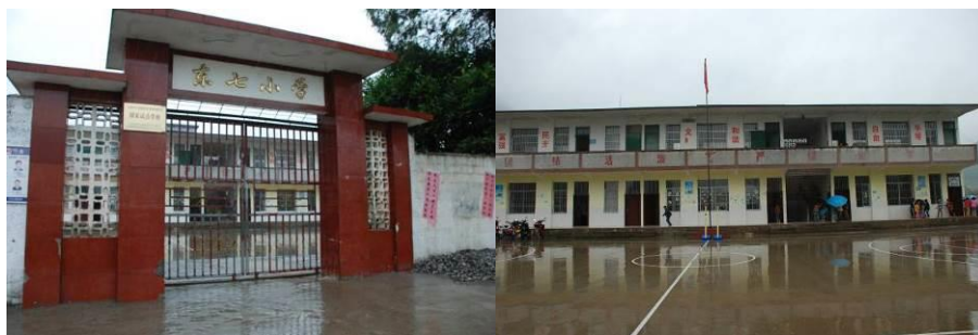
图 1 学校外观

免费午餐于 2011 年 12 月 14 日在该校正式开餐。中国社会福利基金会免费午餐基金向该校提供一笔开餐资金 (用于购置冰箱等或厨房用品等) 以及现在一位厨师 660 元/月/人的工资 (另一位厨师由当地财政发给工资 660 元/月) 及 12 名教职工 3 元/人/餐的午餐费。现 100 名义务教育内学生有由国家营养改善计划提供 3 元/人/餐的午餐费, 免费午餐向 49 名学前班儿童提供 3 元/人/餐的午餐费。该校无寄宿生, 学校除了做午餐外, 下午还为幼儿班儿童提供一餐营养粥, 收取 0.5 元/人/餐。