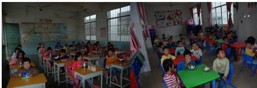
图 10 学生在教室用餐