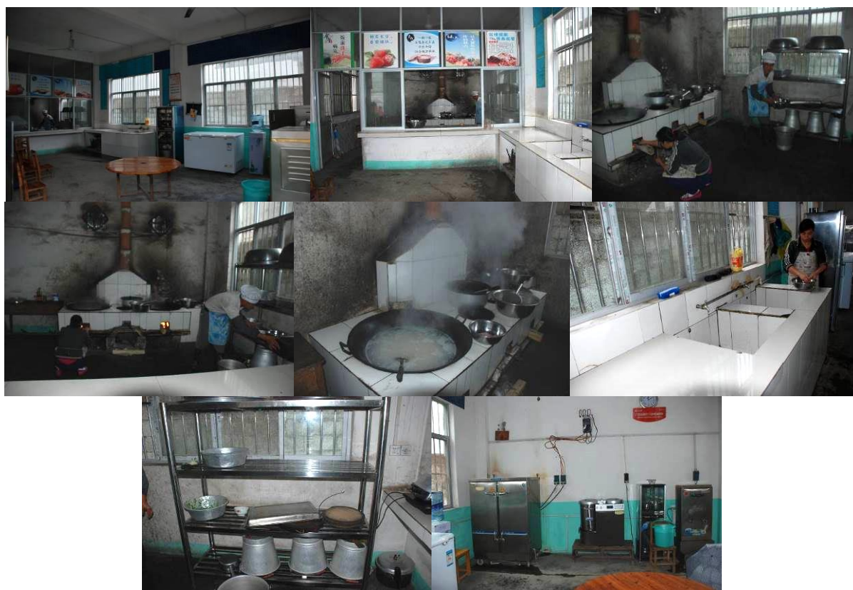
图 3 厨房及厨师