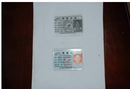
图 6 厨师健康证在有效期内