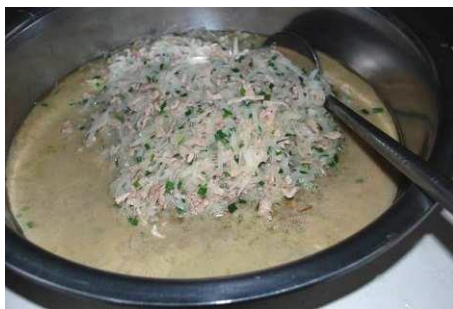
图 4 当天菜品

认真查看了该校 10 月份的微博公示,除了肉类及调料,只有 13 号有两个菜,其他均只一个菜,且大都是大白菜、包心菜及萝卜,菜品单调。