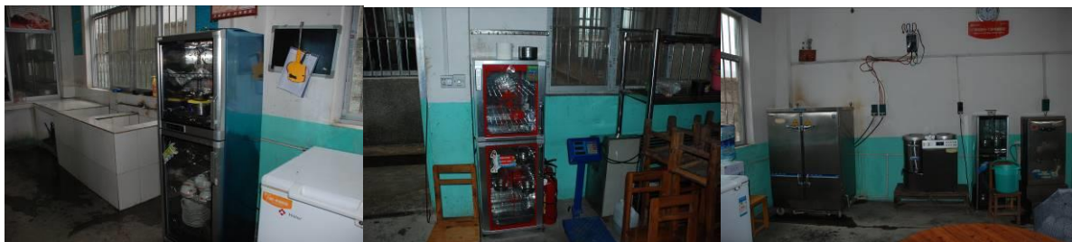
图 7 设备正常使用