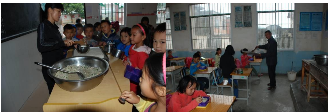
图 9 分班级分餐