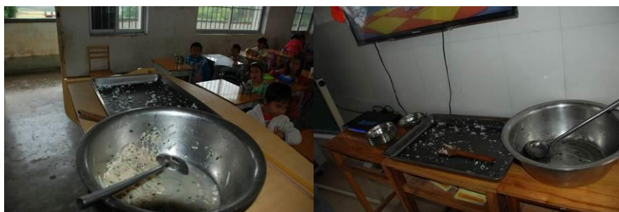
图 5 有的班级饭菜不足