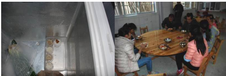
图11 菜品留样不合规范