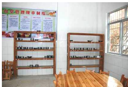
图5 大部分学生餐具不消毒