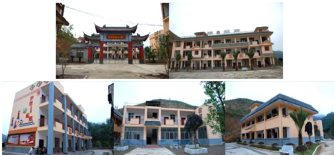
图 2 学校外观

免费午餐于 2014 年 5 月 19 日在该校正式开餐。中国社会福利基金会免费午餐基金向该校提供一笔开餐资金（用于购置冰箱等或厨房用品等）以及现在一名厨师 800 元/月/人的工资及 20 名教职工 3 元/人/餐的午餐费。现 49 名义务教育阶段学生有由国家营养改善计划提供 3 元/人/餐的午餐费，免费午餐向 20 名学前班儿童提供 3 元/人/餐的午餐费。午餐不收取学生费用。有寄宿生 17 人，寄宿生早、晚餐向学校购饭票：二两 2.4 元、三两 2.5 元。因厨师还要为寄宿生做早、晚餐，学校另补其 400 元/月。