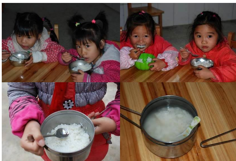
图 8 因菜品单调, 不喜欢吃番茄蛋汤的学生只吃米饭或开水泡饭