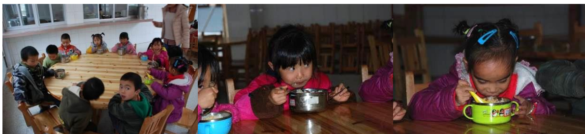
图 14 学生在餐厅用餐