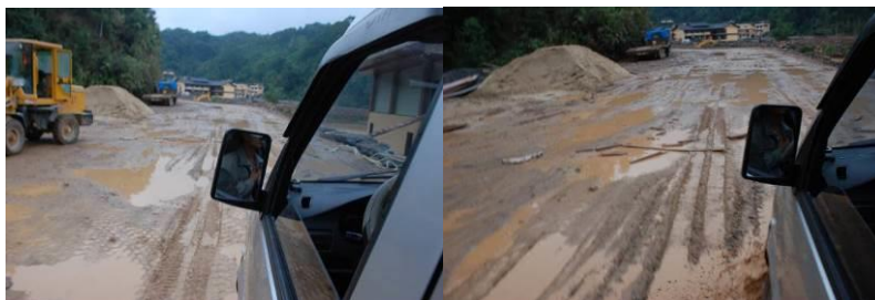
图 1 路况

11 月 11 日, 长坪瑶族乡民族小学 。上午 8:30 从宾馆外坐三轮摩托车 (5 元) 到长坪路口后, 正好碰上有小货车去长坪, 搭小货车 (10 元) 到长坪乡民族小学附近为 9:50。因时间太早, 在附近等到 11:10 才进校。下午 14:00 左右离校回县城。15:30 回到宾馆。