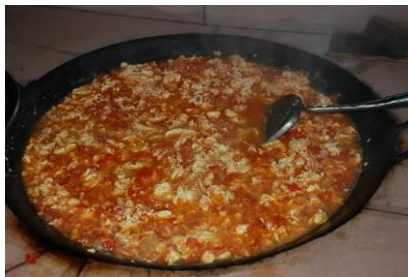
图 7 当天菜品