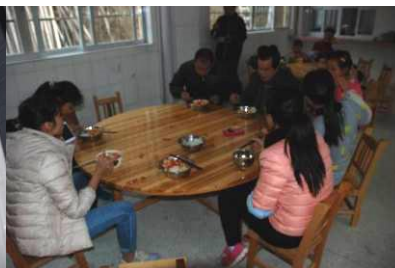
图12 老师在餐厅用餐（未加菜）