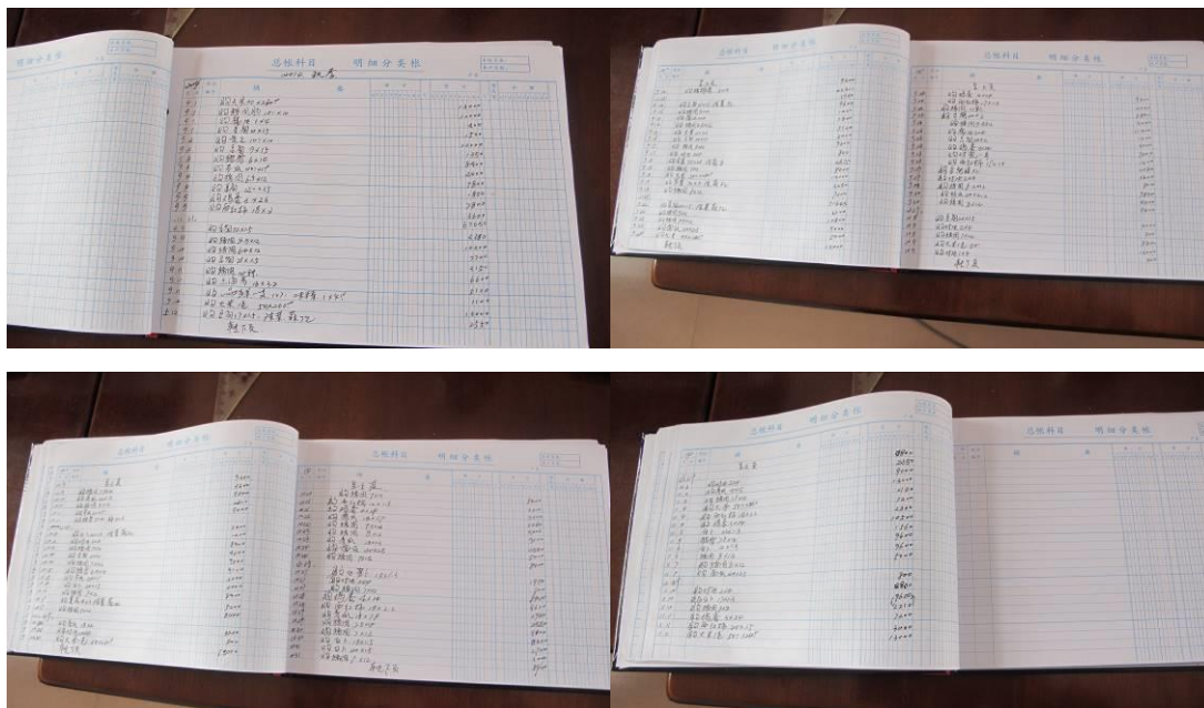
图 17 现金流水账