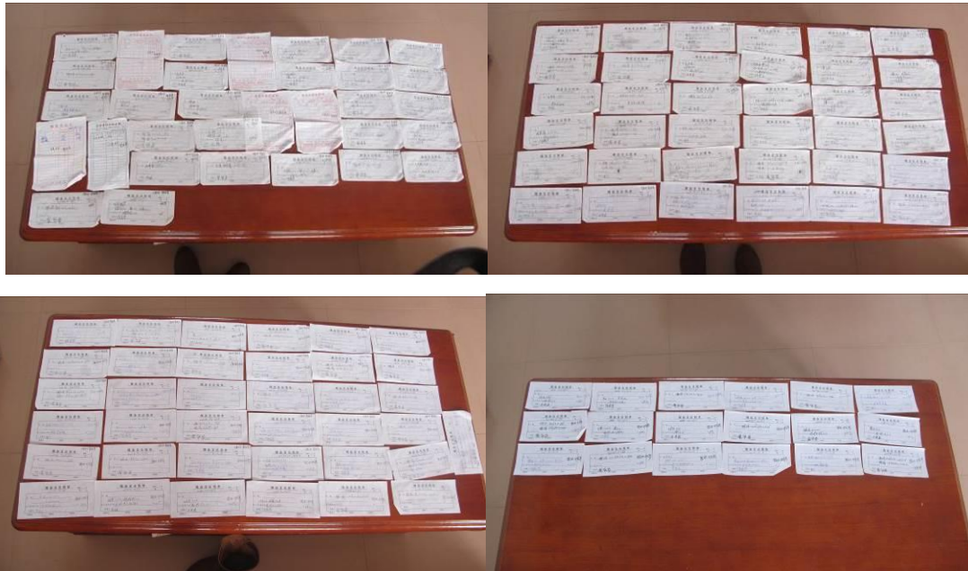
图 16 原始凭证