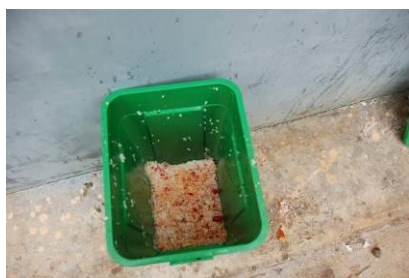
图 15 剩饭菜在正常范围