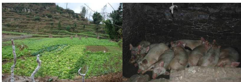
图 17 学校自力更生，种的菜及养的猪