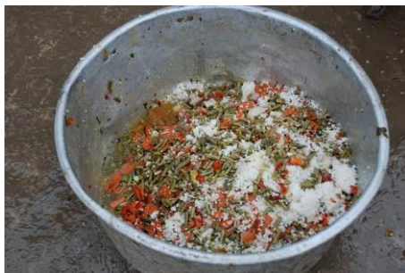
图 14 剩饭菜在正常范围