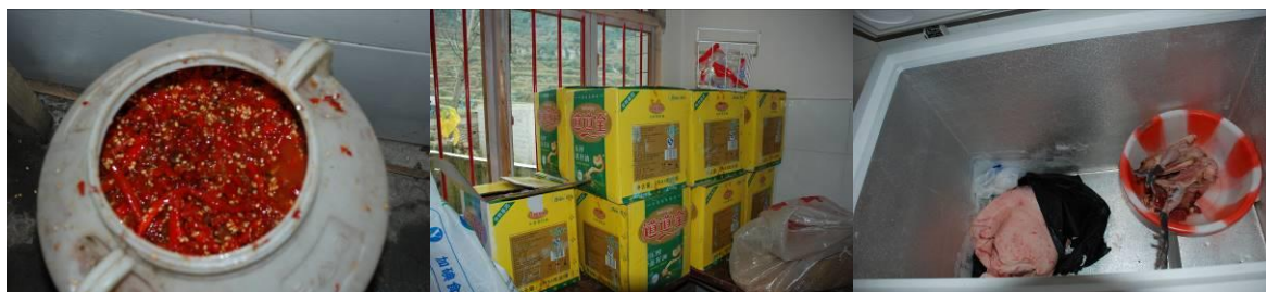
图 6 食材储藏合规范