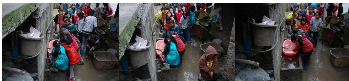
图 7 学生餐前排队洗手