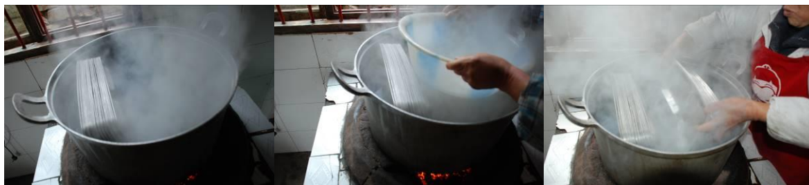
图 5 餐后蒸煮餐具