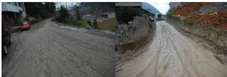
图 1 路况

12 月 9 日, 调查绮陌乡中山小学。早 9:40 从宏洲客运站乘车前往阿烈 (8 元)。后坐摩托车 (10 元), 约 10:40 到达中山小学, 下午 14:00 离校。校长用摩托车送至阿烈, 后租摩托车 (30 元) 回到县城。