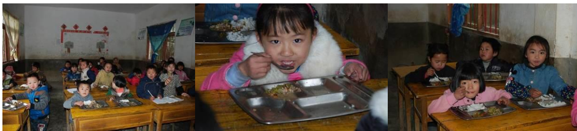
图 13 学生在教室用餐