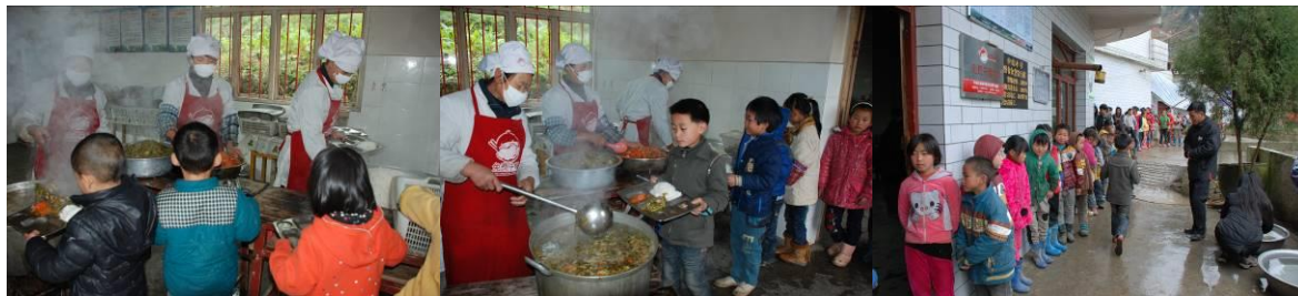
图 12 学生排队分餐（秩序良好）