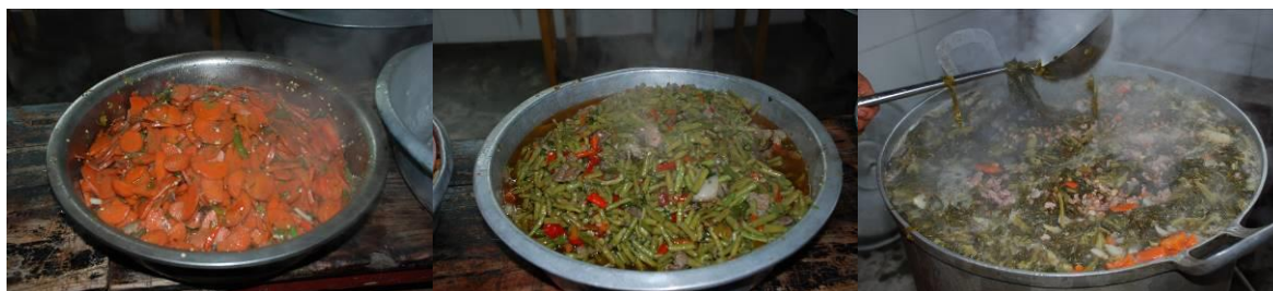
图 8 当天菜品

学校当天菜品是胡萝卜炒肉、豆角炒肉、酸菜红豆汤，主食为米饭。菜品丰富、分量充足，菜品口味尚可。(见图 8) 未见食品中有异物。