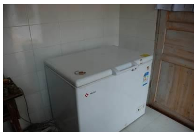
图 10 设备正常使用