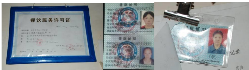
图 9 餐饮许可证及厨师健康证在有效期内