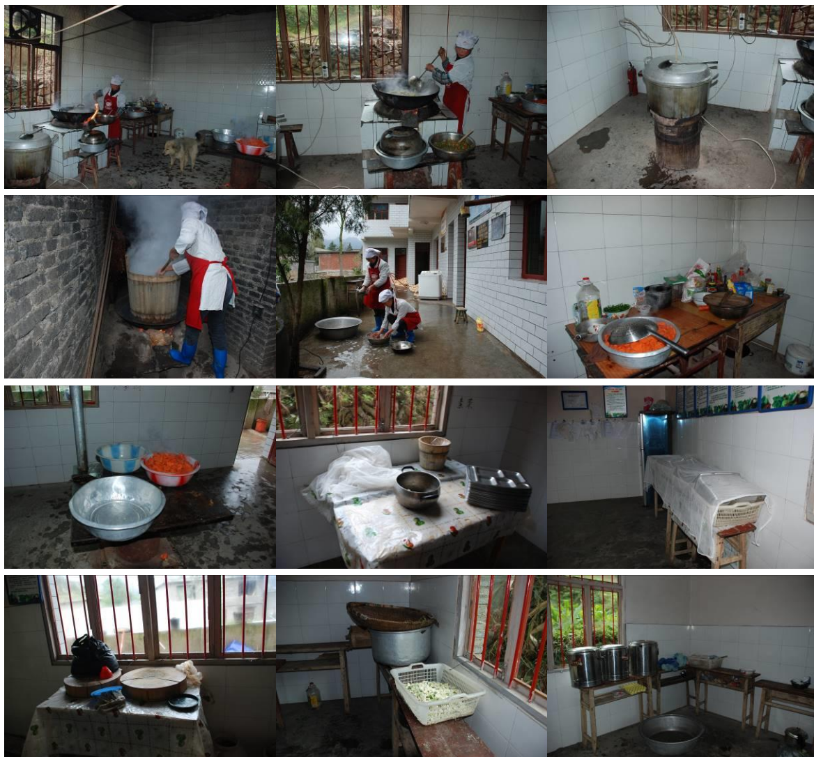
图 4 厨房及厨师

调查当天所见厨师个人卫生尚可，工作服帽穿戴整齐；消毒柜已坏多时且无法再修理，学生餐具用蒸蒸的办法消毒；食材储存合规范，未见有生熟食混合存放现象；未见有腐烂变质食材；学生餐前排队洗手。