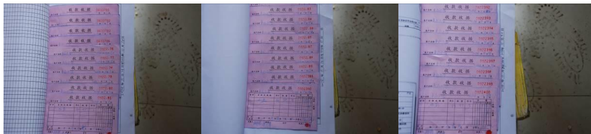
图 15 原始凭证