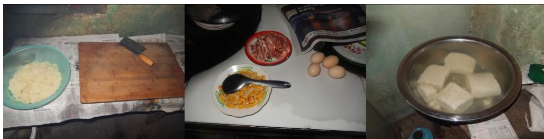
图11 工作台生熟食分开组图