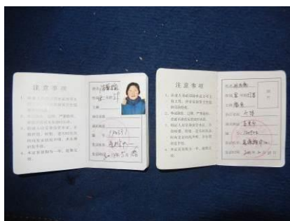
图 17 老师与厨师的健康证图