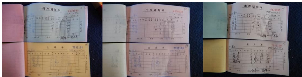
图 23 出库登记组图