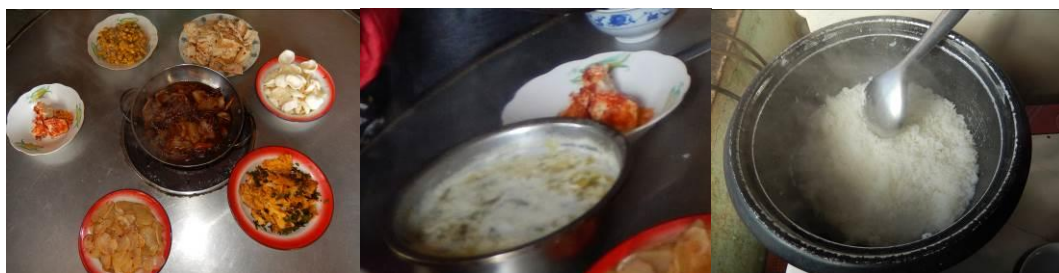
图 15 当日午餐菜品组图

当日饭菜质量情况概述: 午餐菜品为一肉五素菜一汤, 比较可口, 咸淡适中; 通过观察学生用餐全过程, 老师组织比较严密, 与学生同餐, 期间还为没吃饱的学生添加饭菜; 学生普遍吃的比较香, 与学生座谈情况基本反映良好。