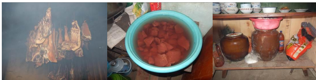
图 14 食材储藏组图（储存合格的食材）