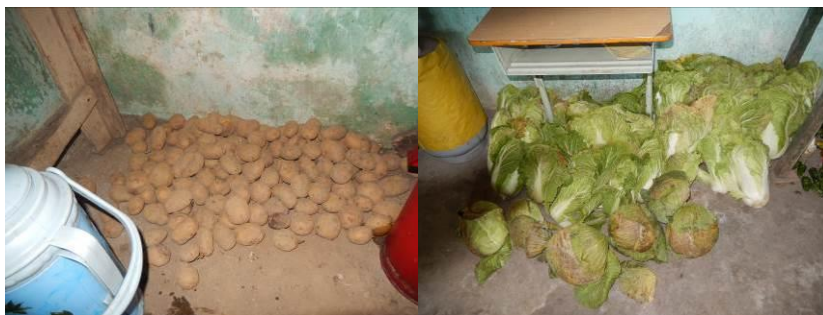
图8 食材储藏组图 (储存不合格的食材)

(4) “餐前洗手”取1分, 扣分原因为学生餐前没有洗手, 校方回应: 平时没有注意这方面的问题。