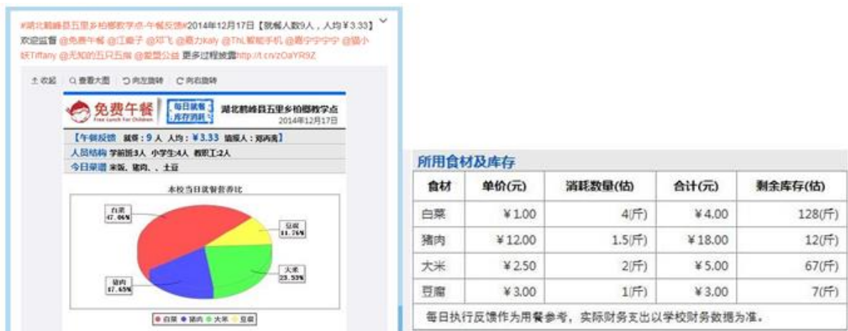
图 5 就餐人数的微博截图