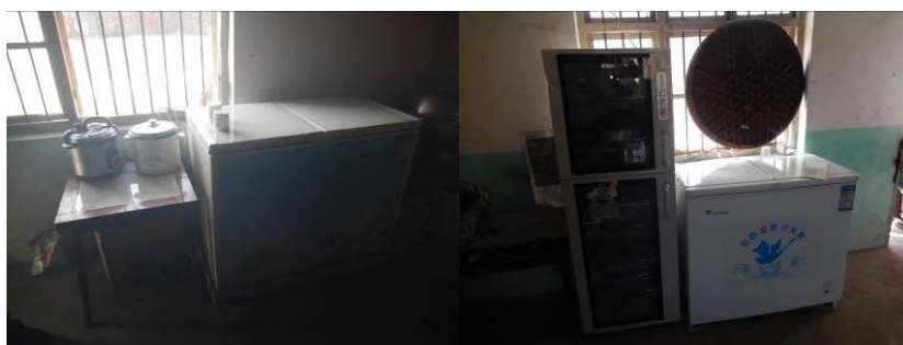
图 18 厨房设备图 (左图冰柜为老师私人物品)