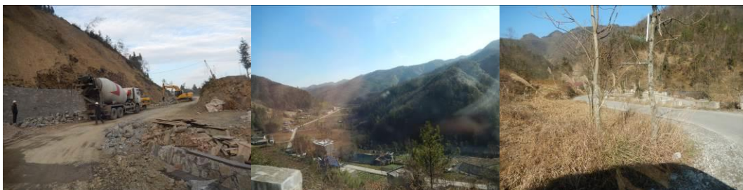
图 1 路况组图