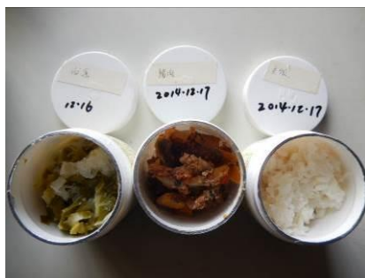
图 16 菜品留样图

“菜品留样”取 3 分, 扣分原因为有菜品留样, 但留样不全, 只对部分菜品留样, 不符合留样标准 (留样达标是学生的午餐菜品应全部留样, 并密封妥善保存)。没有相关留样登记 (附图片)。