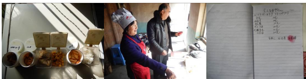
图 19 纠正后的菜品留样与登记组图