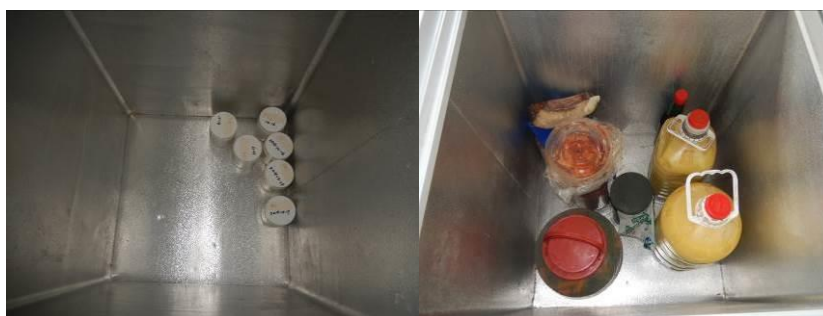
图 7 冰柜内易变质食物储藏组图

(2) “易变质食物保存”取 1 分, 扣分原因为冰柜冷藏间食物全部隔离储藏, 冷冻间的部分食物没有隔离储藏, 存在一定安全隐患 (附图片)。