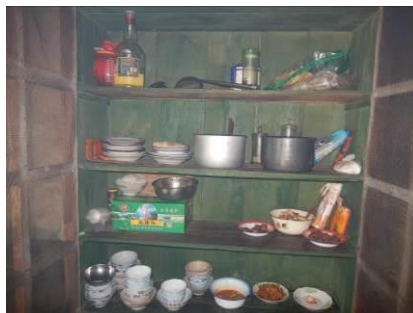
图 13 学生的餐具均由厨师统一清洗消毒存放组图