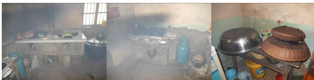
图10 厨房工作台组图