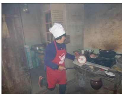
图9 厨工正规着装图