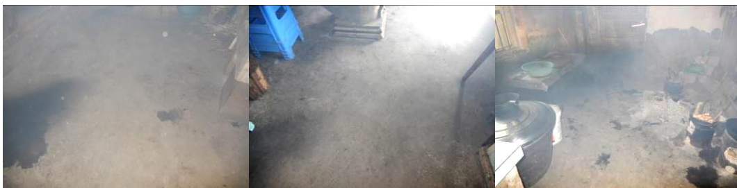
图 12 地面卫生组图