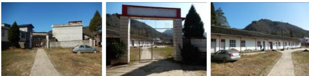
图 4 学校组图

该校现有 2 个年级, 3 个教学班, 为一、二年级和学前班, 共有学生 8 人, 教师 1 人, 厨师 1 人。