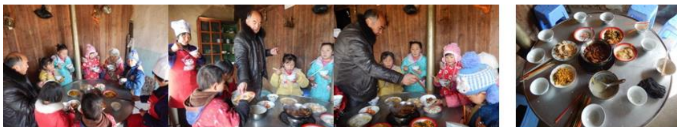
图 21 师生就餐及餐后情况组图