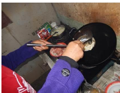
图 6 厨工手部卫生图

(1) “厨工手部卫生”取 3 分, 扣分原因为厨师手部比较干净, 但指甲缝存有少量泥垢 (附图片)。