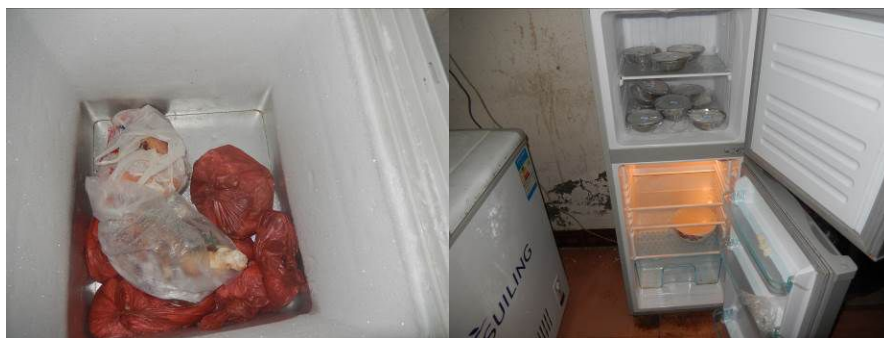
图 8 冰箱内生熟食隔离储藏组图