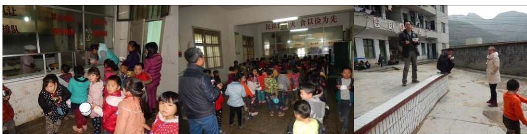
图 23 教职工用餐组图