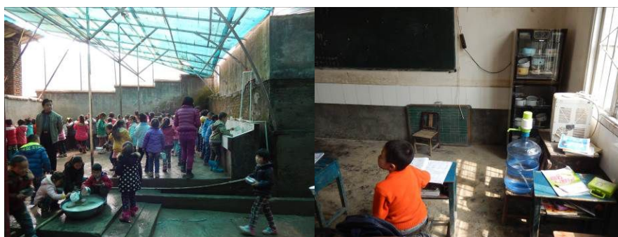
图11 餐具由学生自己清洗后集中存放在各班教室的消毒柜内组图