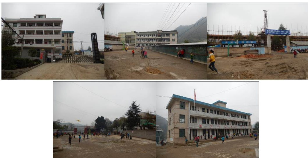
图 2 学校组图

教师 54 人 (公办 43 人, 其中 1 名厨师为公办) (代课 11 人)、保育员 1 人、厨师 7 人 (含公办 1 人), 共有教职工 61 人。