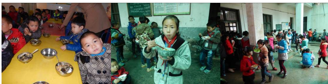
图 21 学生用餐组图