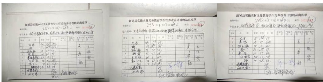
图 28 出库登记组图