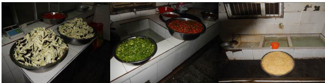
图10 工作台生熟食分开组图