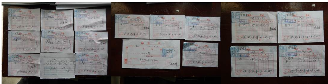
图 25 原始凭证组图

(1) “原始凭证”取 3 分，扣分原因为原始凭证大部分有相关责任人与监督人签字，小部分签字不全（附图片）。