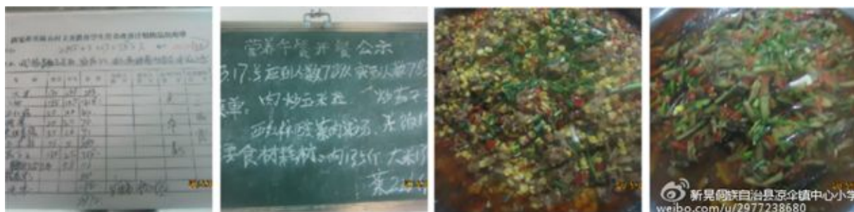
图3 就餐人数的微博截图