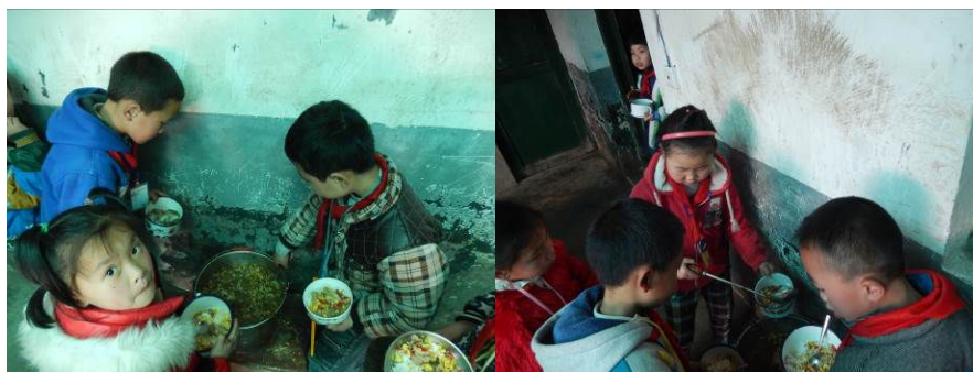
图 22 没吃饱的学生加饭菜组图