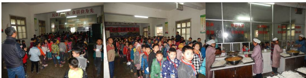
图 20 小学部分餐组图