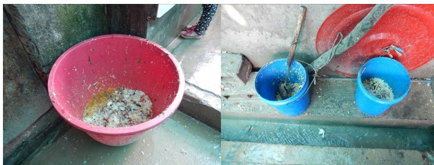
图 24 餐后的剩菜剩饭组图（近八百人用餐后的剩菜剩饭情况良好）