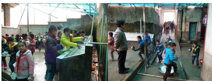
图13 学生餐前洗手组图