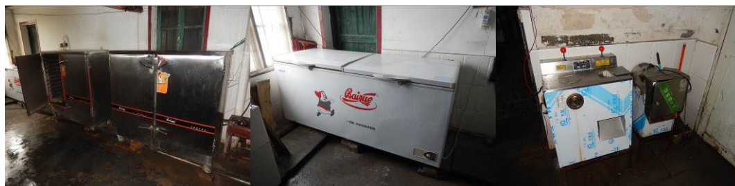
图 18 厨房设备正常使用组图