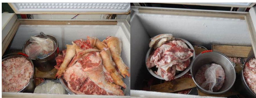
图5 冰柜内的易变质食物储藏组图

(3) “易变质食物保存”取1分, 扣分原因为冰柜冷冻间储藏的肉类食物, 大部分没有采取安全隔离措施(附图片)。