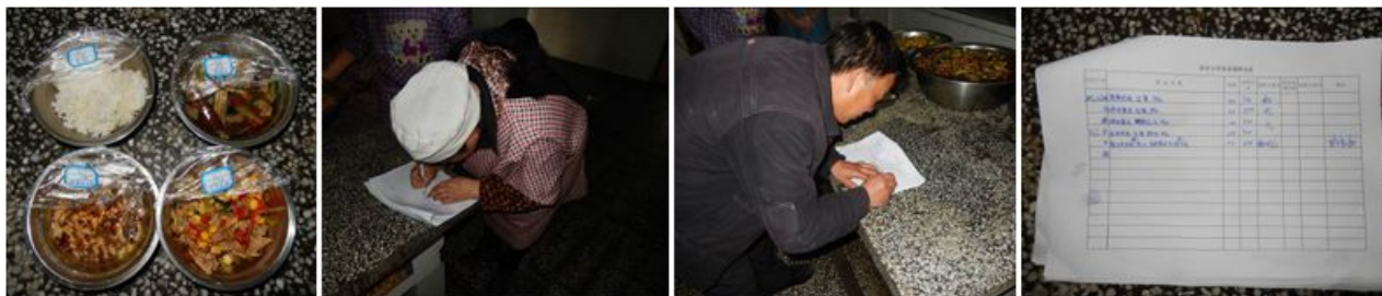
图 17 纠正后的菜品留样与登记组图