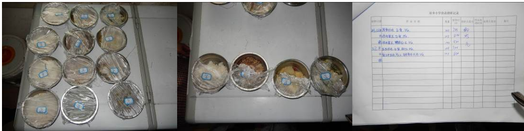
图 15 菜品留样与登记组图

“菜品留样”取 3 分，扣分原因为通过查看前两天的菜品留样基本达标，但留样冻成了冰坨塔，视为无效；留样标签上只有日期，没有具体的留样时间；相关留样登记上，部分登记的是食材名称，应为菜品名称，有留样人签字，但没有学校监督验收人签字（附图片）。