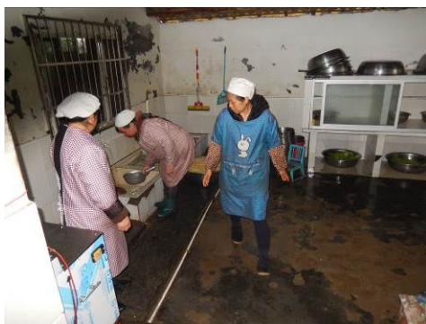
图 7 厨工正规着装图