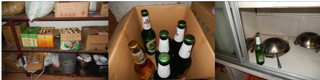
图 6 储藏间内食材架上的啤酒组图

瓶啤酒，经过询问负责人甘培初老师，并核查相关账目非午餐专款购买，但食堂储藏间放置私人酒水不符合免费午餐相关管理规定。校方回应：校长不知情，甘老师说是去年底施工队留下的，学校原来并不知道食堂不能存放这类物品。调查人员向部门领导汇报后，经研究决定：鉴于非校方主观问题，做扣除 2 分处理（附图片）。