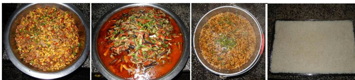
图 14 当日菜品组图