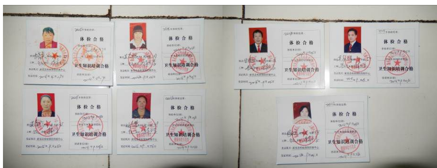
图 16 厨师健康证组图