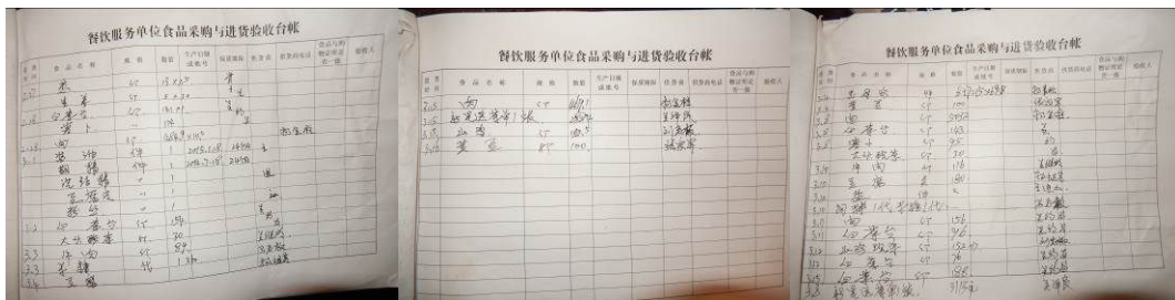
图 26 采购台账组图

(3) “现金流水账”取 1 分, 扣分原因为今年的现金流水账还没有开始做。校方回应: 由于采购的食材部分没有付完款, 等月底结算清后统一做账(附图片)。