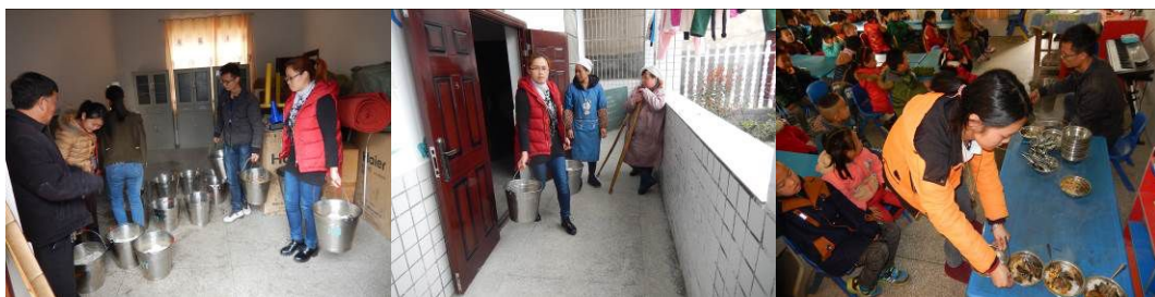
图 19 幼儿园分餐组图