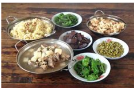
图 9 教职工餐桌上的菜品

关于“师生同餐”，调查人员注意到当日教职工午餐就餐时有单独做菜（图 9）。根据稽核评分规则，该项评分取 1 分；