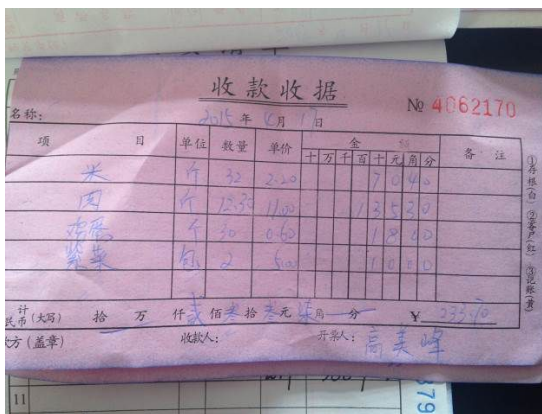
图 11 原始凭证

关于“入库记录”，调查人员注意到，入库记录虽与原始凭证一致，但仍未按照实际采购情况进行登记，也没有签字信息（图 12）。根据稽核评分规则，该项评分取 1 分；