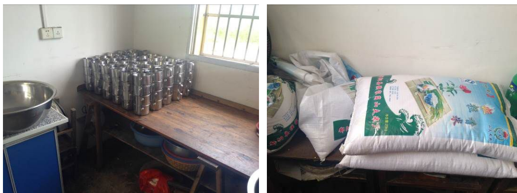
图 5 库存大米