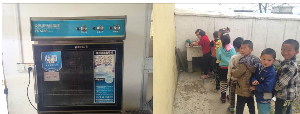
图 6 使用正常的餐具消毒柜及排队洗手的学生