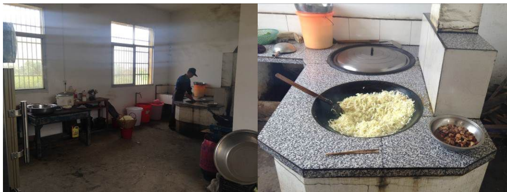
图 4 厨房全景及局部