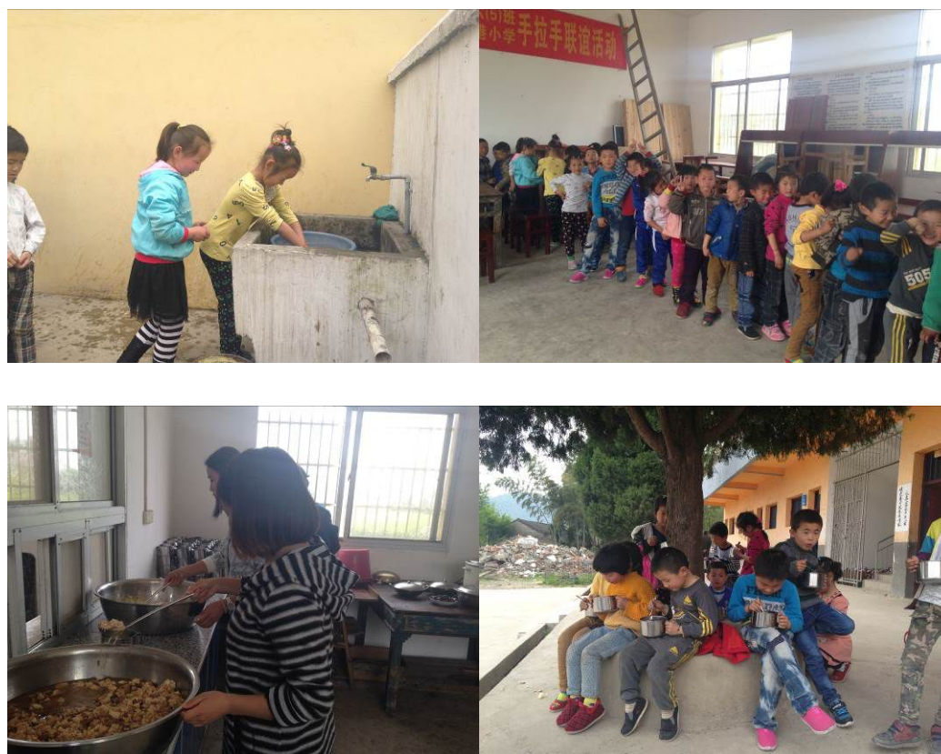
图 10 就餐现场组图