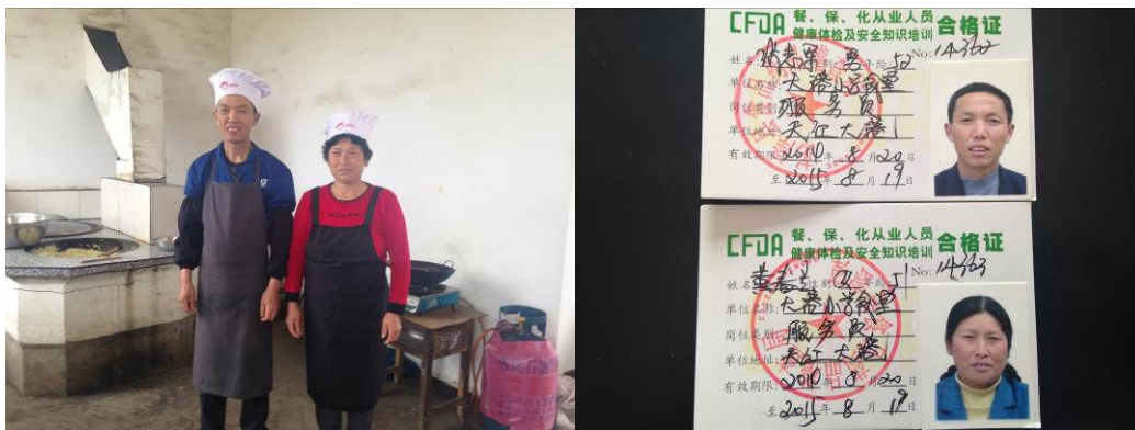
图 3 在岗炊事员及有效健康证

关于“厨工工服着装”，调查人员注意到在岗炊事员未着工装，仅系了围腰（图 3）。根据稽核评分规则，该项评分取 3 分；