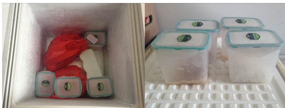
图 8 冻成冰疙瘩的食品留样

关于“菜品留样”，调查人员当日所查见食品留样取样数量不达标，冻存环境不符合要求（冷冻）（图 8），食品留样工作记录不规范，该项工作无效。根据稽核评分规则，该项评分取 1 分；