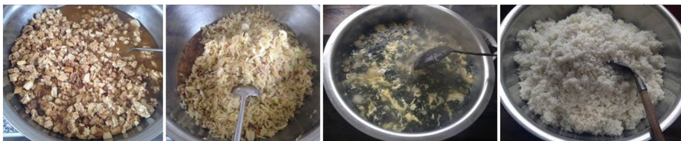
图 7 调查当日饭菜组图