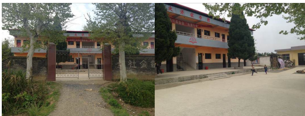
图 1 学校大门及校园环境

该校现任负责人吴东明老师。学校午餐管理人员包括：负责采购事务的孙荣荣老师，负责午餐资金收支记录及学校微博维护的郑婷婷老师，以及负责出入库管理和午餐资金报账的吴东明老师。