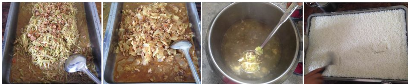
图 6 调查当日饭菜组图