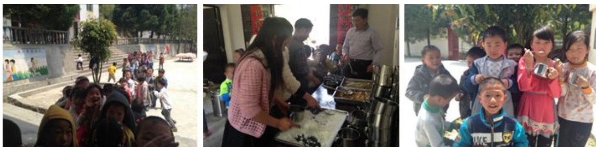
图 8 就餐现场组图