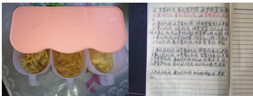
图 7 现场查见的食品留样及食品留样记录

关于“菜品留样”，调查人员当日所查见食品留样取样盒卫生状况欠佳，取样数量不达标（图 7），取样盒未贴标签，食品留样工作记录不规范，该项工作无效。根据稽核评分规则，该项评分取 1 分；