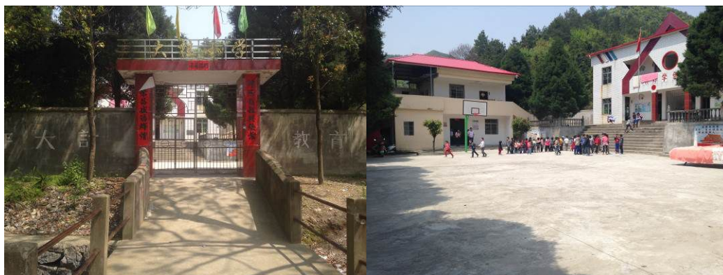
图 1 学校大门及校园环境

该校现任负责人陈锄友老师。学校午餐管理人员包括:采购主管陈琍珠老师,午餐账目管理陈锄友老师,学校微博维护张学艳老师。该校午餐资金由浪溪镇中心小学负责收支管理,学校不接触午餐现金。