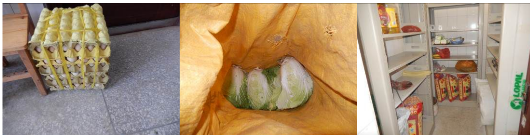
图 10 食材储藏组图