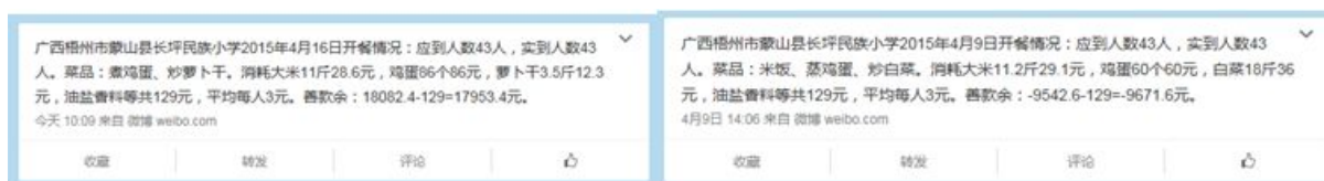
图 13 每周吃一次鸡蛋的微博截图

“荤菜率”取0分,扣分原因为校方答复调查人员每天都有肉菜,通过查看微博公示情况,发现每周都有一天是吃鸡蛋,不能达到每天有荤菜的要求(附近期微博截图)。