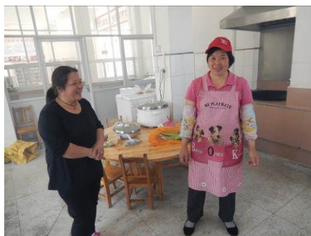
图 6 厨工着装图