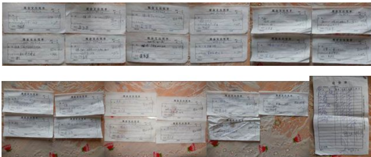
图 22 原始凭证组图

(2) “原始凭证”取 3 分，扣分原因为原始凭证上只有供货商和监督人签字，没有采购员签字（附图片）。