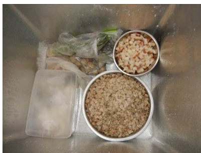
图 5 冷藏冰柜内的易变质食物储藏图

(2) “易变质食物保存” 取 1 分, 扣分原因为冷藏冰柜内存放两盆熟食, 没有采取安全隔离措施, 存在一定安全隐患 (附图片)。