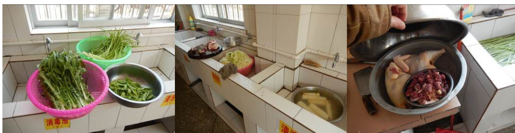
图 8 工作台生熟食分开组图