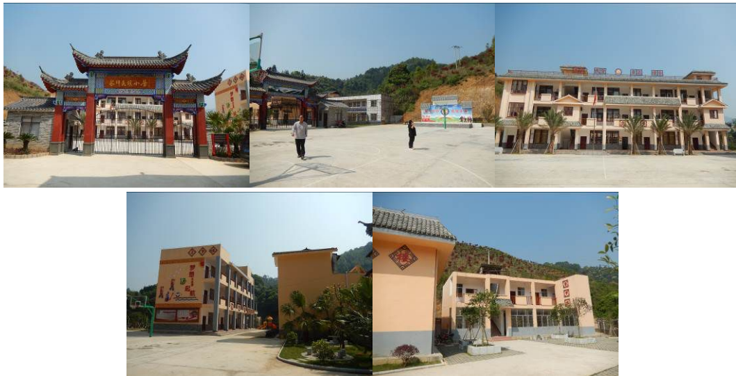
图 2 学校组图

该校现有 6 个年级, 7 个教学班, 为一至六年级和学前班, 共有学生 73 人, 学校现有教职工 20 人, 教师 18 人、门卫 1 人。