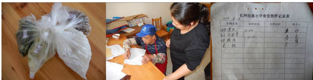
图 17 纠正后的菜品留样与登记组图