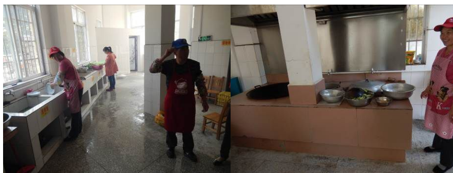
图 7 厨房工作台组图