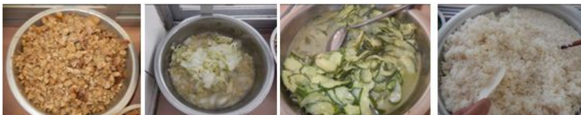
图 12 当日菜品组图