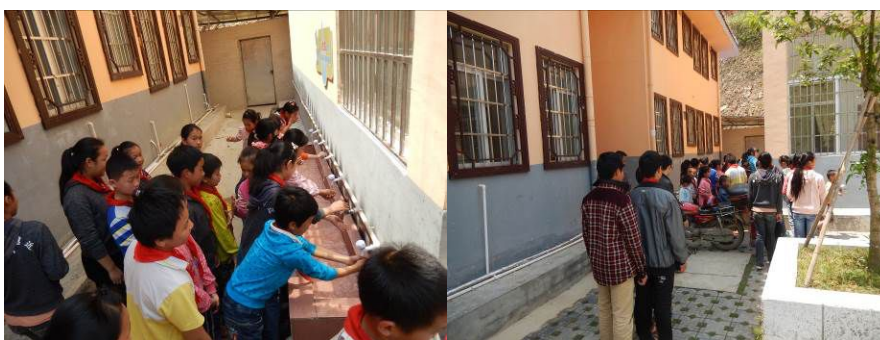
图 11 学生餐前洗手组图