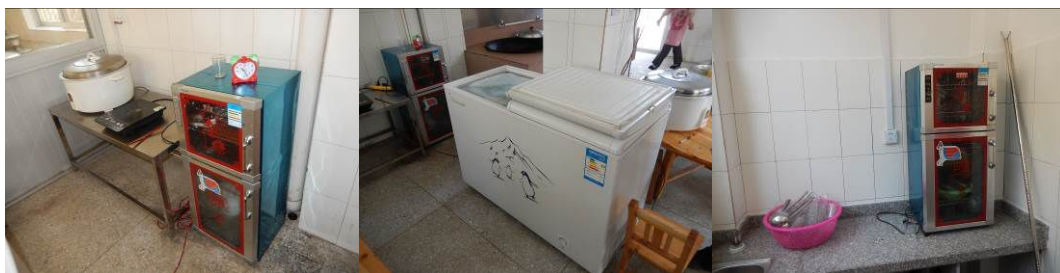
图 16 厨房正常使用的设备组图