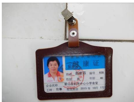
图 15 厨师健康证图