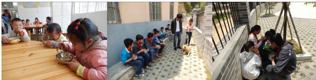
图 19 学生用餐组图