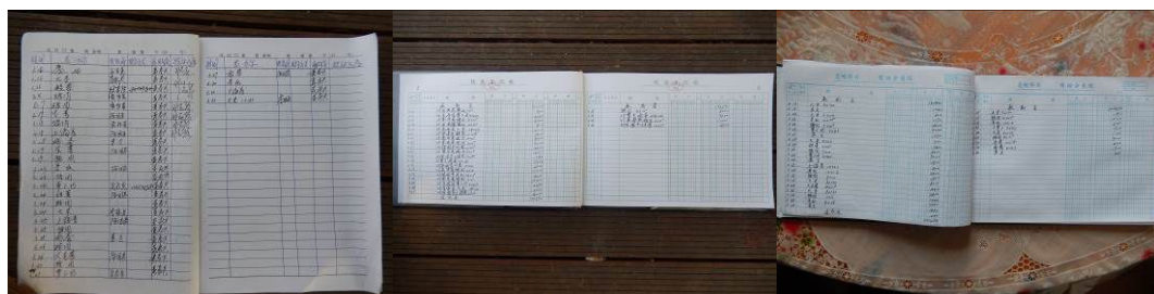
图 23 采购台账组图

校方回应：(一) 这几天临近三月三“盘王节”老师工作太忙；(二) 学校教学繁重，致使 4 月份的相关账目还没有登记好；(三) 学校对登记中的诸多细节问题不是很清楚，教育局有一套方案，免费午餐有一套方案，不知按那个要求做是合格的(附图片)。