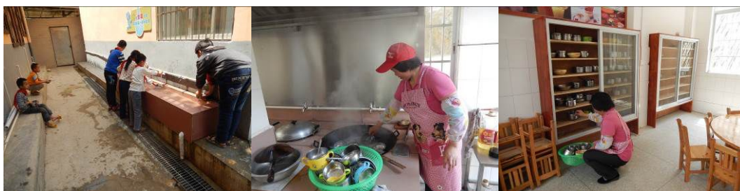
图 9 学生自己清洗餐具后由厨师统一用开水消毒并集中存放在食堂组图