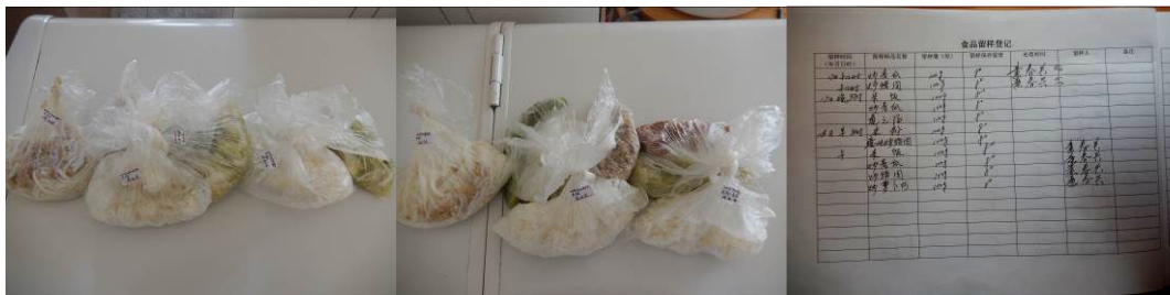
图 14 菜品留样与登记组图

(2) “菜品留样”取 3 分，扣分原因为菜品留样达标，没有近期相关留样登记，只有 3 月份的留样登记，上面部分写的是食材名称，应写菜品名称，只有留样人签字，没有监督人签字（附图片）。