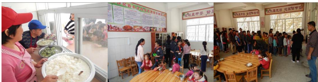
图 18 井然有序分餐组图