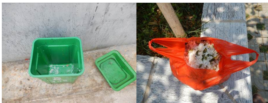
图 21 餐后的剩菜剩饭组图 (从一百人用餐后的剩菜剩饭情况看属正常现象)