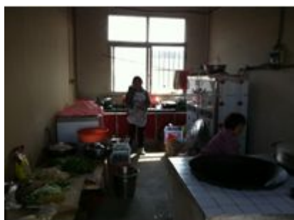
图 5 厨师着装