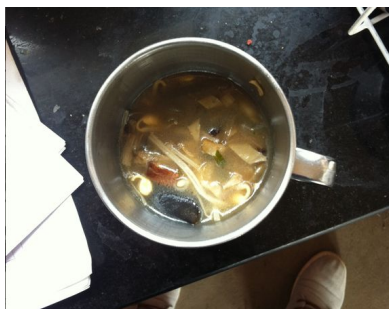
图 12 开餐当日留样