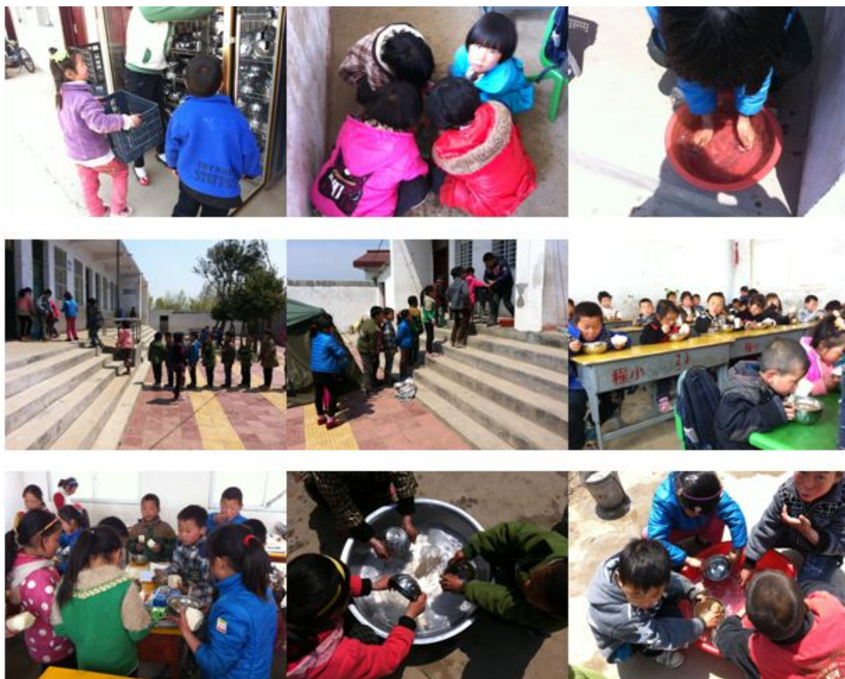
图 11 学生餐前领餐具、洗手、排队领餐、餐后清洗餐具组图