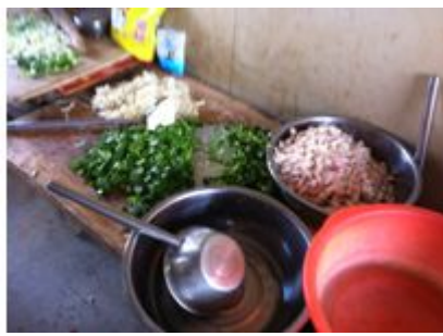
图 6 操作台