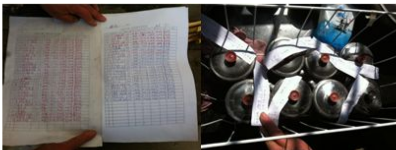
图10 菜品留样和记录