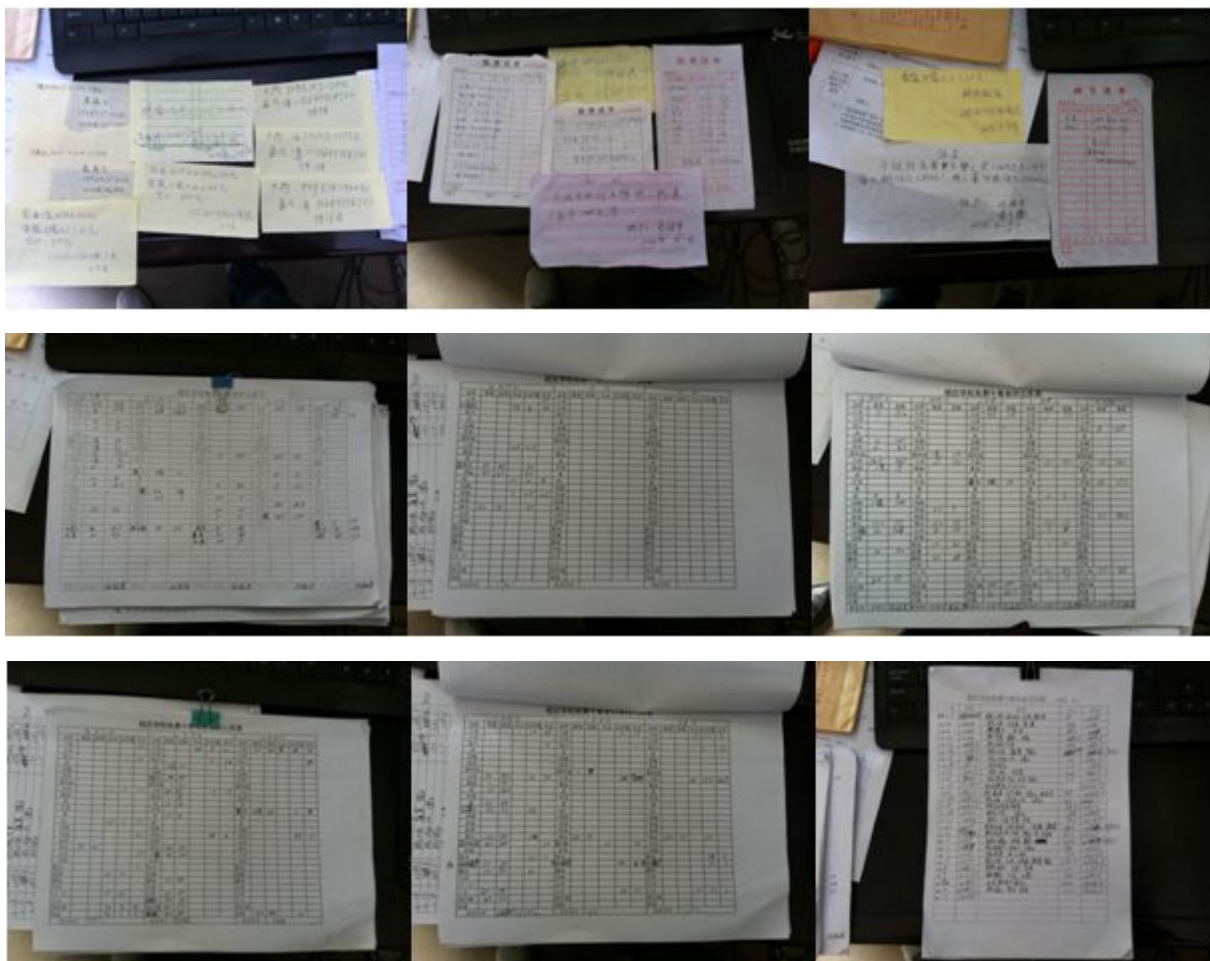
图 13 原始单据和出入库单据样板组图

其中原始采购凭证的采购单，商家信息、菜品信息等信息完整。入库、出库单核心信息完整。现金流水账将每天的采购信息进行了详细的登记，真实度较高。