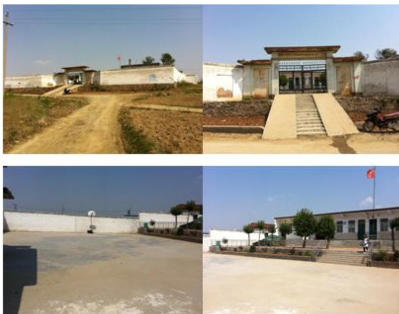
图 2 学校组图

程庄小学共有五个年级：学前班、一至四年级，教学班 6 个，其中有 2 个学前班、一至四年级各 1 个教学班，学生 155 人，全部享用免费午餐；在校教师 7 人（含 3 名支教老师），厨师 2 人。学校中午 12 点开餐。