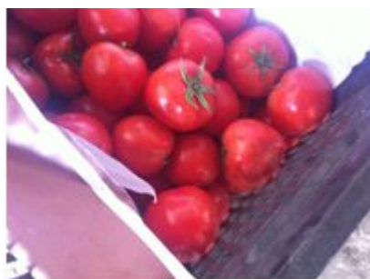
图 6 腐烂的西红柿