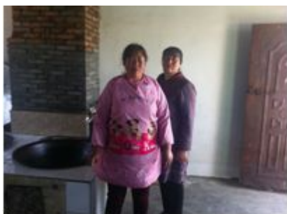
图 5 厨师着装

(4) “当前储存食材变质腐坏情况”项得 1 分，原因是调查当日查看学校食材储藏间发现西红柿有腐烂的。(如图 6)