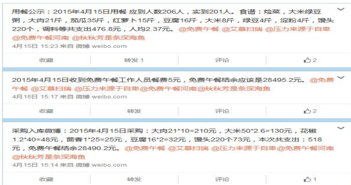
图3 就餐人数的微博截图

当日就餐人数：学生190人+教职工11人+调查人1人=202人（调查工作人员缴餐费5元），比微博公示人数多一人，原因是未把调查人计算在内。