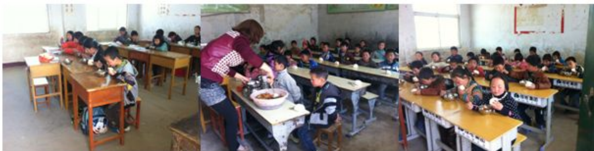
图 10 学生用餐情况组图