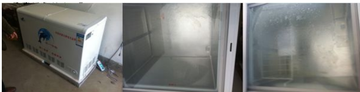
图 11 闲置冰柜组图

(2) “菜品留样”项得 3 分, 原因是学校能够按照要求进行留样并记录, 但留样储存在冷冻条件下。