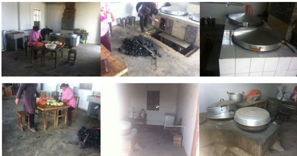
图 4 厨房和储藏间