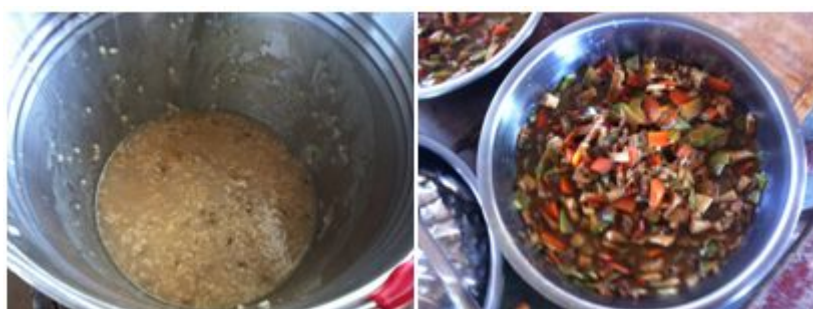
图 7 开餐当日菜品

调查当天，该校菜品为：烩菜、大米绿豆粥和馒头。调查人与师生共餐，感觉饭菜口感尚可。查阅该校开学至今的微博，发现校方能根据饮食习惯安排饮食，菜品丰富(如：豆芽、豇豆、西红柿、芹菜、蒜台、红萝卜、茄瓜、豆腐、面片、卤面条等)。