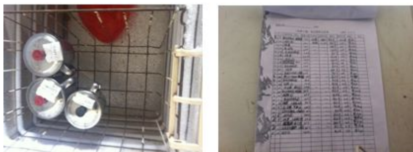
图9 留样和留样记录