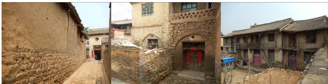
图 2 当地民居组图

沁水县位于山西省东南部, 晋城市西北部, 中条山东北, 黄河支流沁河中游。县境地势西北高, 东南低, 四周群山环绕, 西部大山更为险峻, 海拔 1400 米以上。土沃乡位于沁水县城西南历山脚下, 辖 16 个行政村、59 个自然庄, 约 8000 人。耕地 1061 公顷。乡政府驻地土沃村, 距县城 26 公里。