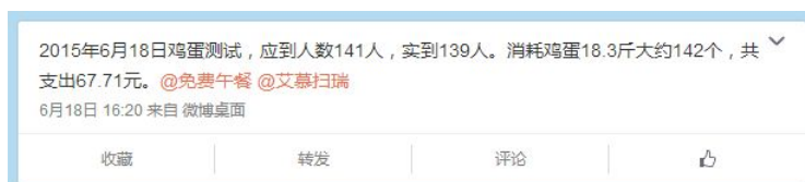
图 4 就餐人数的申请截图