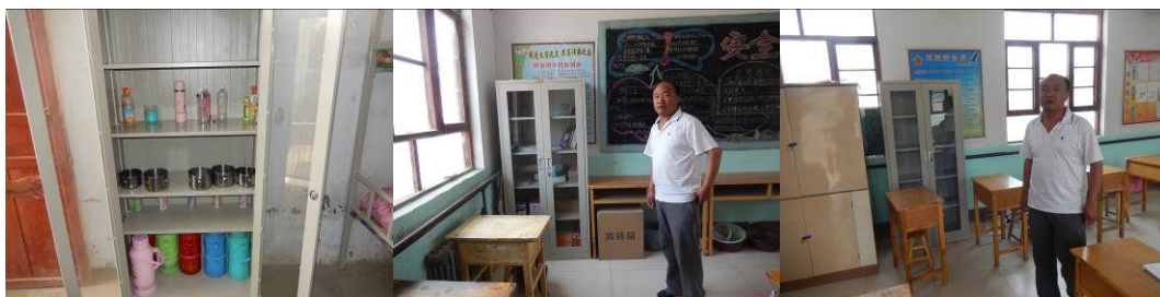
图 10 学生餐具均存放在宿舍组图（学校在宿舍和教室配备专门的铁皮柜方便学生存放餐具）