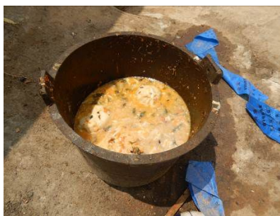
图 11 当日早、中餐后的剩菜剩饭情况图