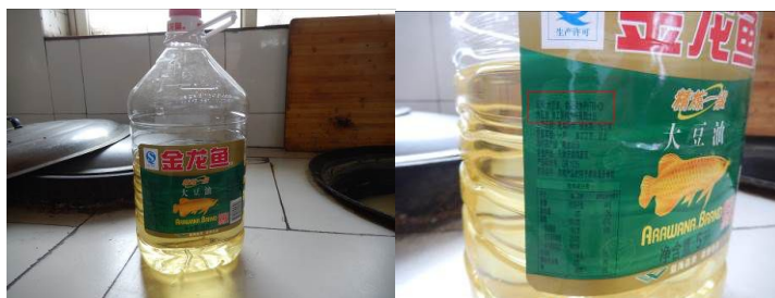
图 22 采购食用油组图