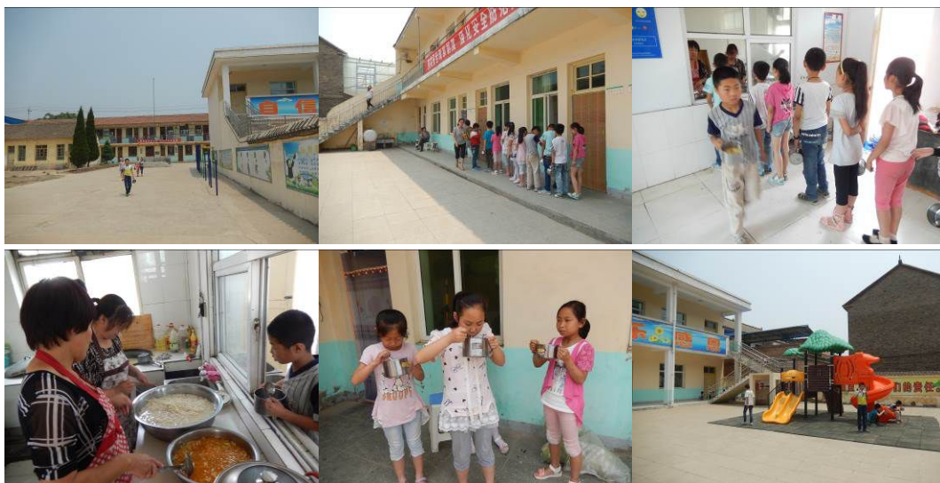
图 8 学生分餐、用餐情况组图