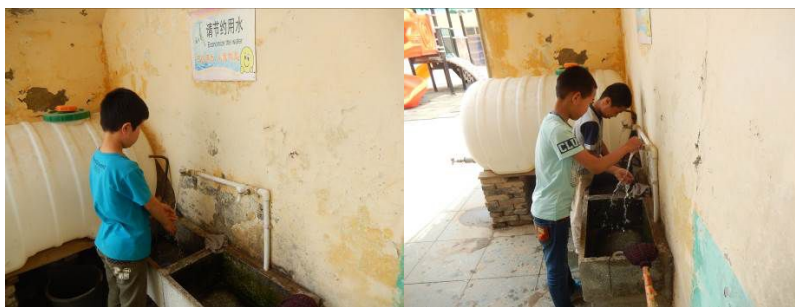
图 7 部分学生餐前洗手组图