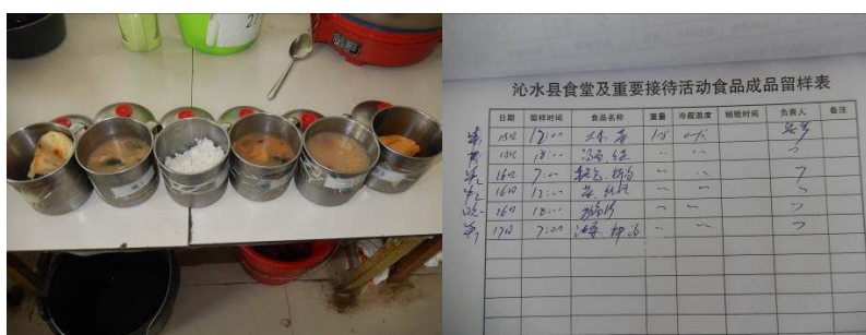
图 6 菜品留样与登记组图