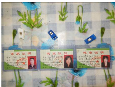
图 18 健康证图