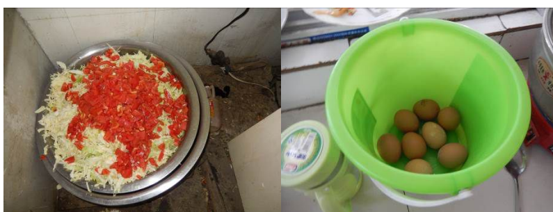
图 17 工作台生熟食存放组图