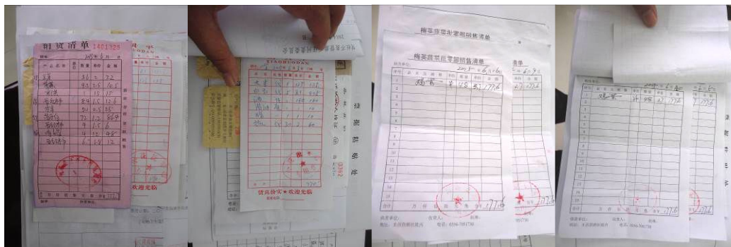
图 21 采购原始凭证组图

(1) 在原始凭证方面票据上没有供货商签字和联系电话，采购员和监督验收人没有签字（附图片）。