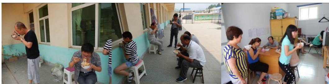
图 12 老师的用餐组图

调查人员了解到老师用餐与学生一样, (三餐共缴餐费 6 元 / 人 / 天, 为寄宿生和教职工, 不限量吃饱为止)。