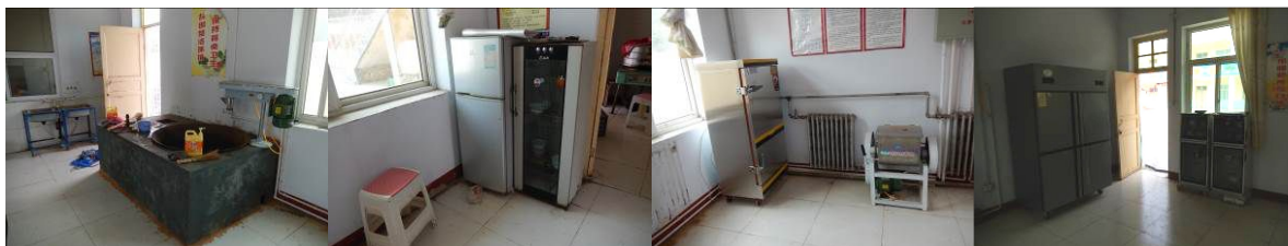
图 13 学校新改造的厨房情况组图

厨房占用两间房子, 新旧两个厨房, 新厨房摆放的设备有: 免费午餐配备的设备有蒸饭车 1 台、餐具 111 套 (调查当日正在采购中); 学校自购的设备有消毒柜 3 台, 大冰柜、小冰箱、留样冰箱、压面机和面机、电饼铛各一台。