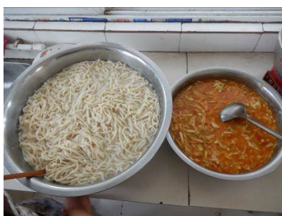
图 5 当日午餐菜品图（菜品为烩菜，分别是西红柿、白菜和西葫芦）