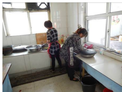
图 19 厨师配制午餐图