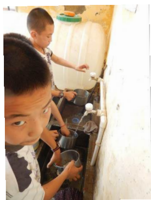
图 9 餐后学生自行洗碗图