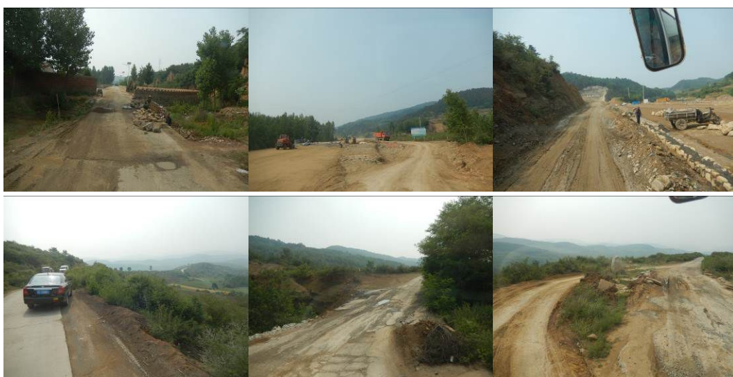
图1 路况组图（地处偏远，路况较差，沿途多处修路）

6月18日上午8:00从沁水汽车站乘公交车集散汽车站，9:00乘班车至土沃乡土沃村，10:20到达，对该校进行调查，下午14:00离校，乘班车返回县城，夜宿98快捷宾馆。