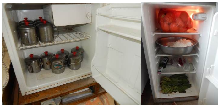
图 15 冰箱内易变质食物储藏情况组图