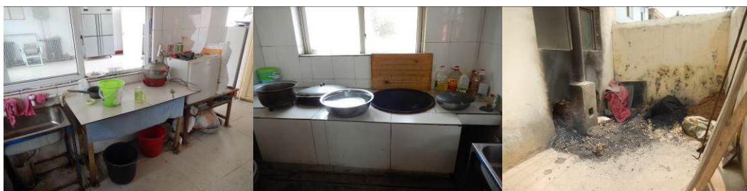
图 14 学校老厨房情况组图