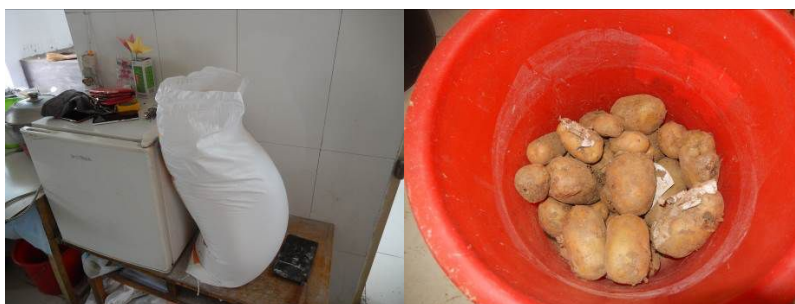
图 16 食材储藏情况组图