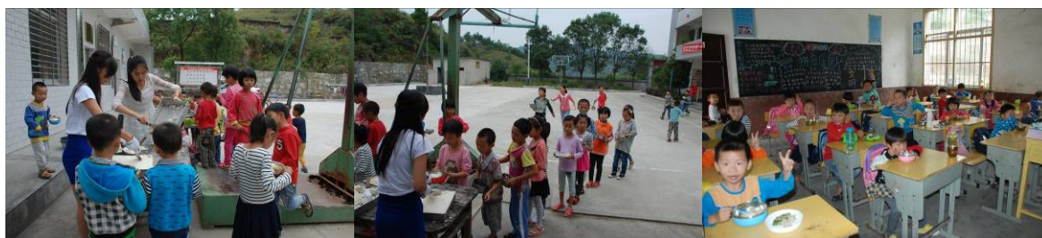
图10 学生分餐、用餐组图