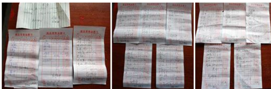
图 13 原始凭证