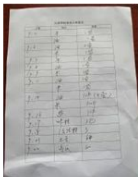
图 14 入库登记