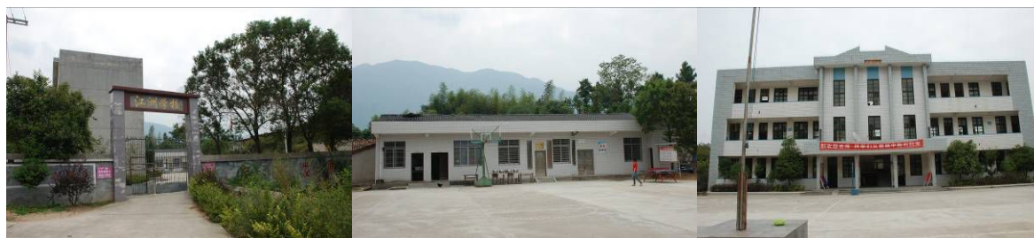
图 1 学校外观