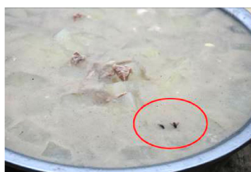
图 7 菜品中有饭蚊子