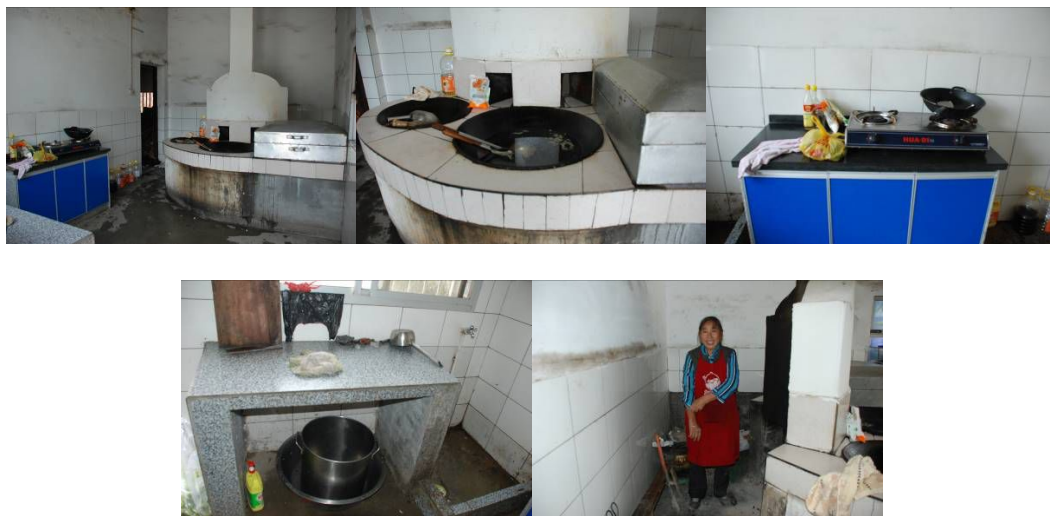
图3 厨房及厨师图组