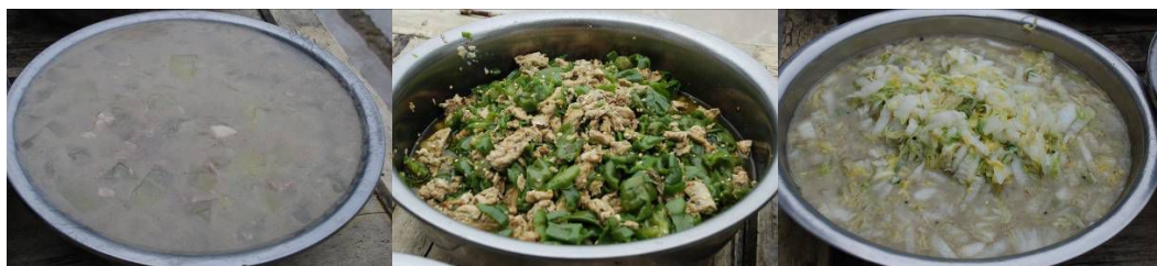
图 6 当天菜品

(1) “饭菜异物”项扣除 5 分，原因为调查现场发现冬瓜肉汤中有蚊子。（见图 7）