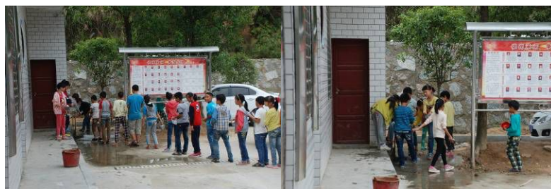
图5 学生餐前自觉排队洗手洗碗