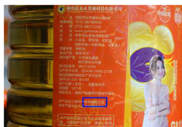
图 8 学校采购的食用油为转基因油