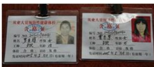
图9 健康证在有效期内