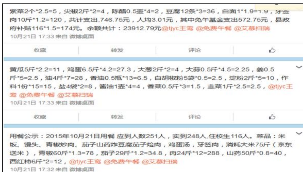
图 3 就餐人数的微博截图

当日就餐人数: 学生 221 人+教职工 22 人+调查人 1 人=244 人 (调查工作人员缴餐费 5 元), 该校应到人数为 255 人, 微博公示 251 人, 此外当如就餐人数为 244 人, 比微博少 4 人。