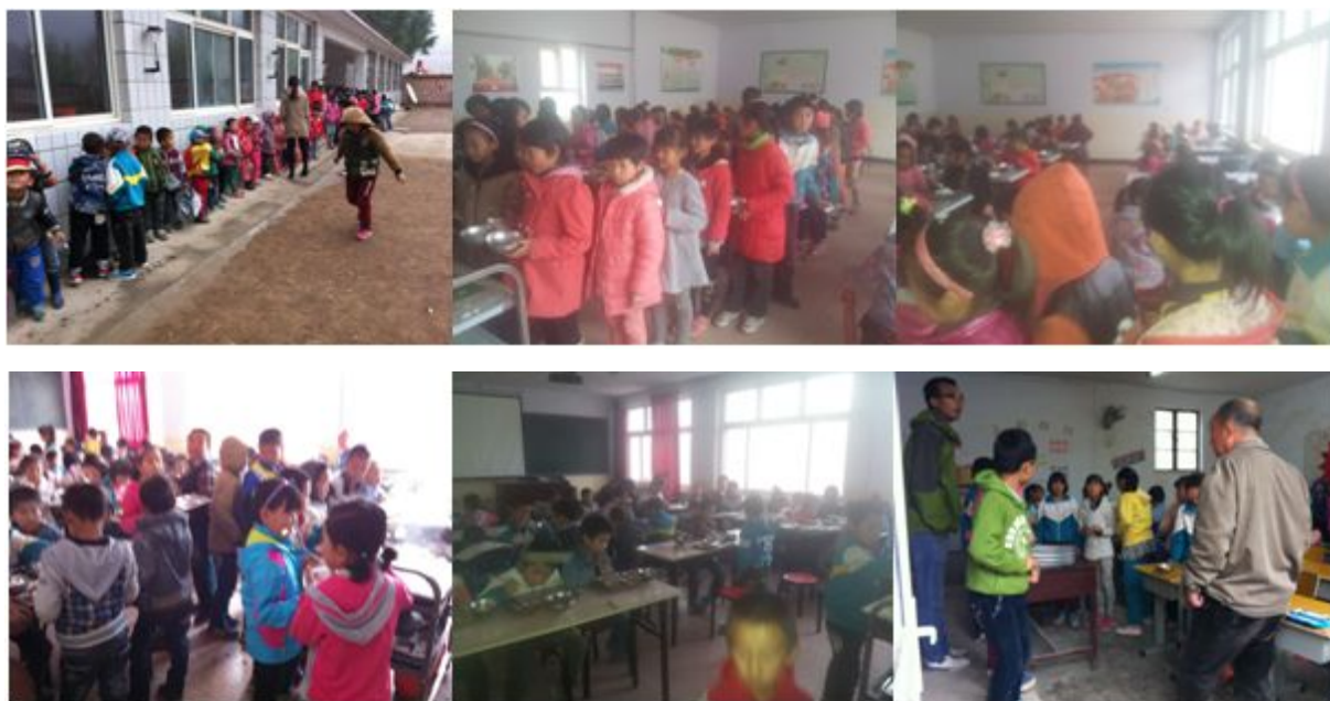
图 12 就餐过程组图