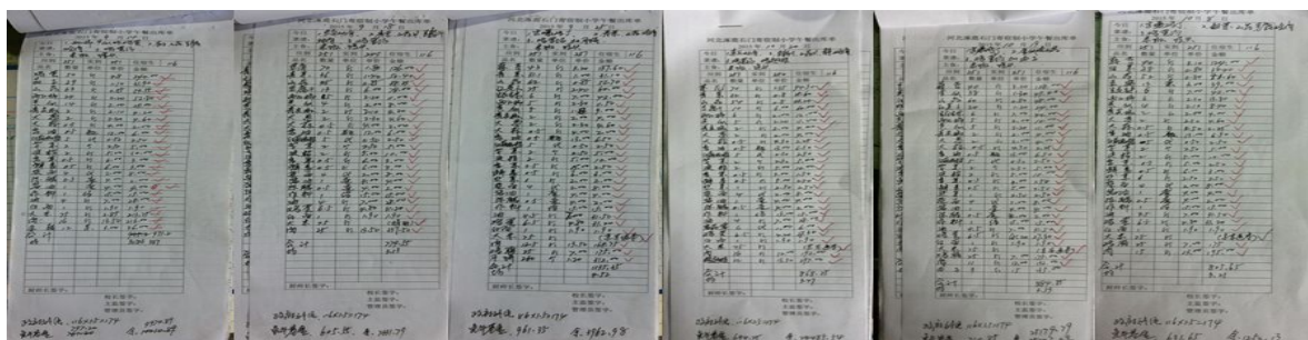
图 14 出库记录组图