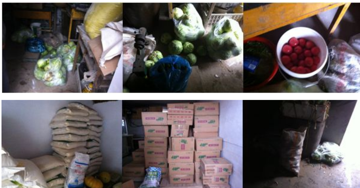
图 5 储藏间情况组图