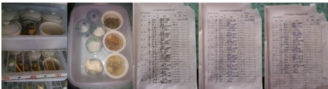
图 10 学校留样和记录组图