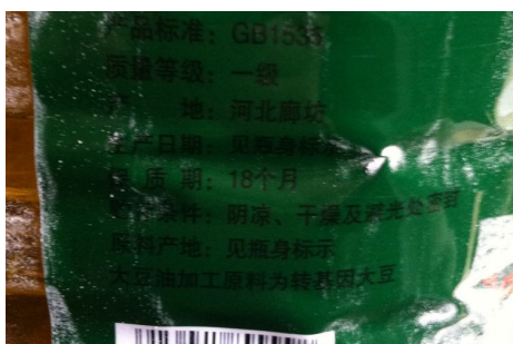
图 6 食用油情况图 (为转基因油)