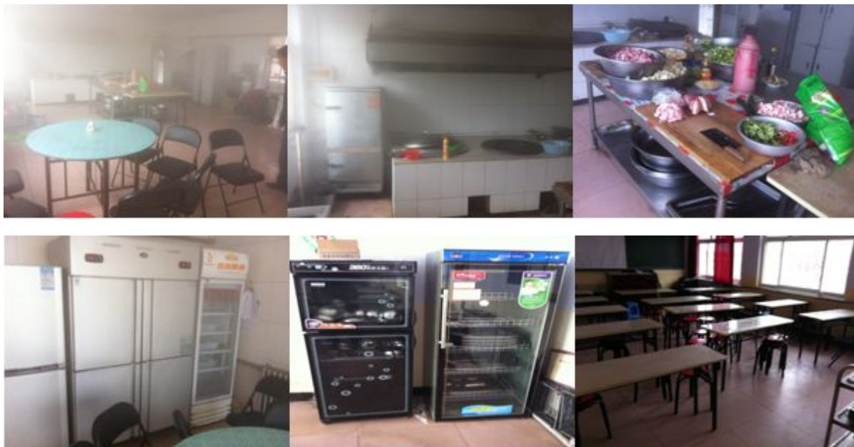
图 4 厨房情况组图

学生餐前洗手环节, 厨房外有一个水龙头可以供学生洗手, 但是由于天气转凉, 无法满足洗手条件, 下课后学前班到, 学生领完餐在餐厅用餐。用餐完后由生活老师统一清洗, 清洗干净放到消毒柜中统一消毒。