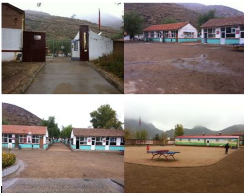
图 2 学校情况组图

石门寄宿制小学位于辉耀镇石门村, 石门村位于辉耀镇镇南约 15.6 公里。目前共有 6 个年级、6 个教学班, 另学前班 1 个, 在校学生 232 人、教师 17 人。该校全部师生接受免费午餐基金资助用餐。校长: 楚密宝; 王玉录老师负责开餐工作, 出入库监督、账目、现金等; 微博发布由康敏老师负责。