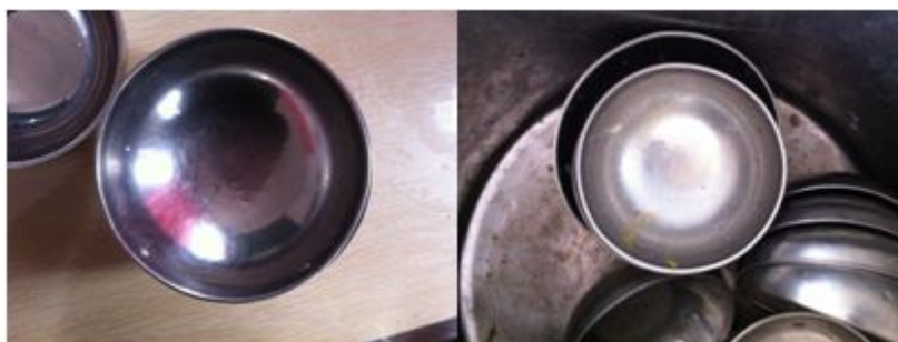
图 7 没有清洗干净的餐具组图