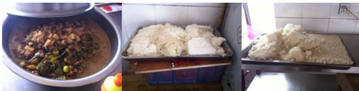
图 11 学校餐余组图