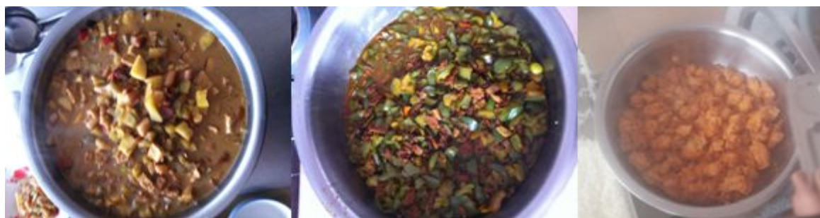
图 8 开餐当日菜品组图