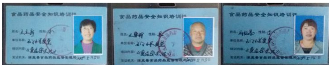
图 9 厨师健康证图

该校的就餐情况是,12:00 下课后学前班、一年级、二年级、三年级一部分在一个食堂用餐,三年级另外一部分和四年级在小食堂用餐,五、六年级在班级用餐,下课后学生会相应的食堂排队用餐,五、六年级则将饭菜领回教室在老师的监督下排队领餐,整个用餐过程中老师与学生同餐,秩序井然。