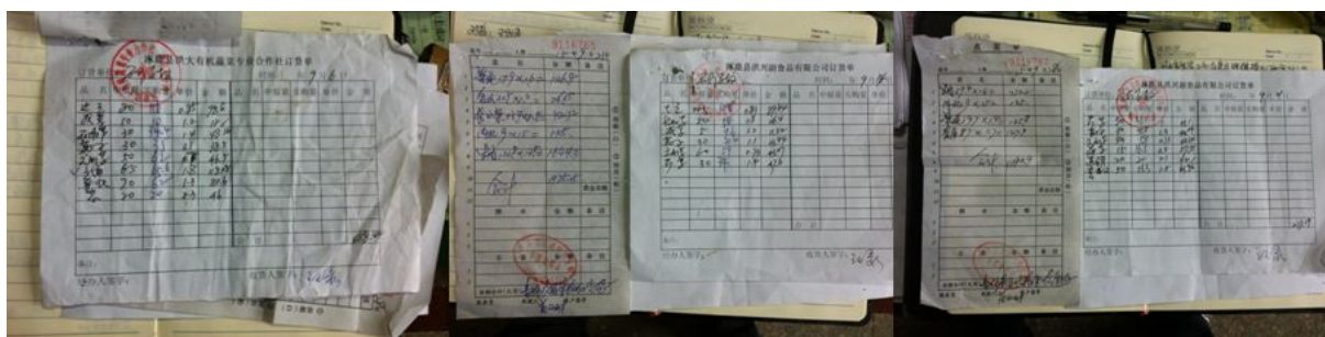
图 15 原始凭证组图