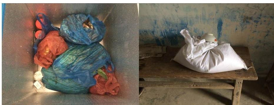
图 5 一般食材储存情况