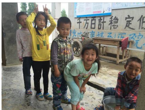
图 6 排队洗手