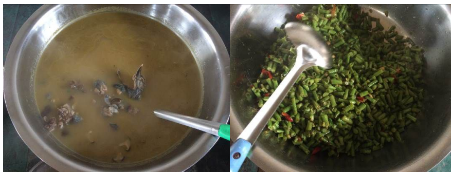
图 7 调查当日饭菜组图

调查当日，该校午餐送餐质量完全符合本项考察要求，本项评分均取满分 5 分。饭菜组图如下（图 7）；