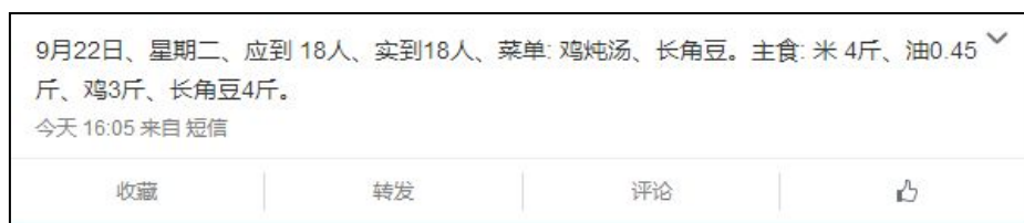
图 2 学校微博公示截图