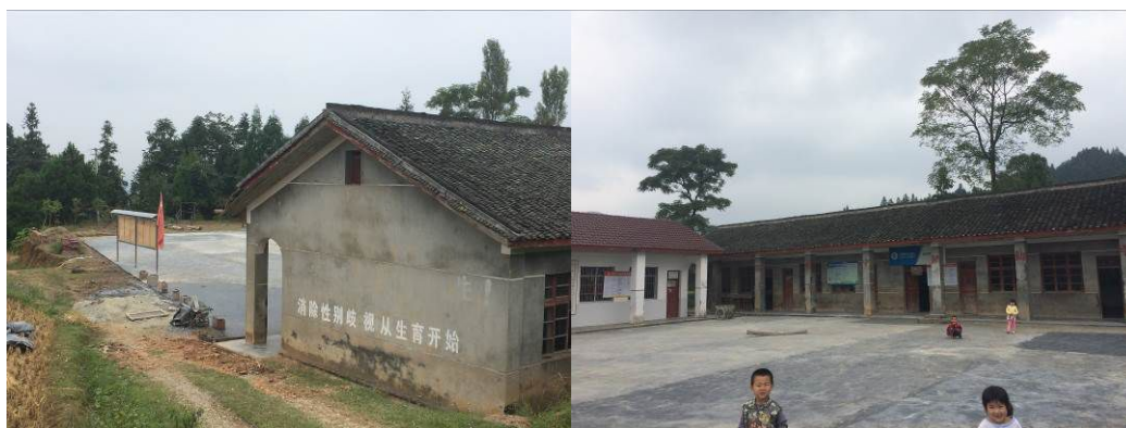
图 1 学校大门及校园环境

该校现任负责人兼炊事员卜秀珍老师。由于该校规模较小，在岗教师仅 2 人，故午餐相关管理工作主要由卜老师及一年级李琳老师共同负责。