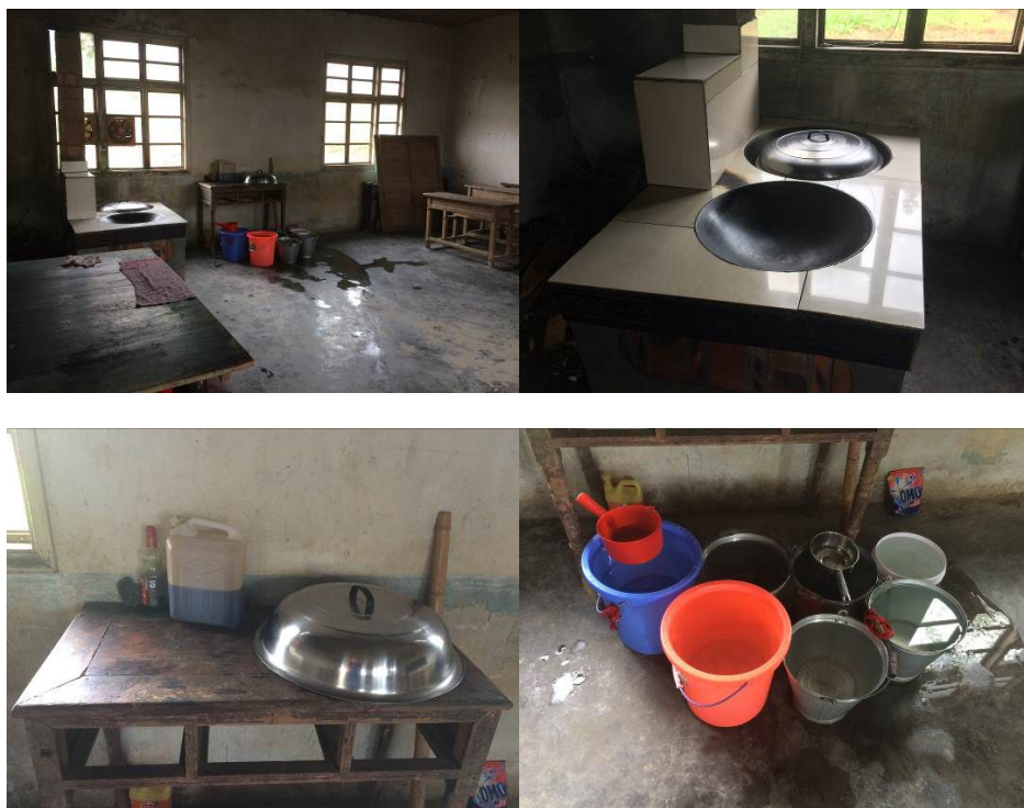
图 4 厨房各区域情况