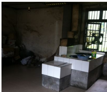
图 5 厨房墙面卫生情况图