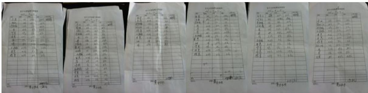
图 12 出入库记录组图