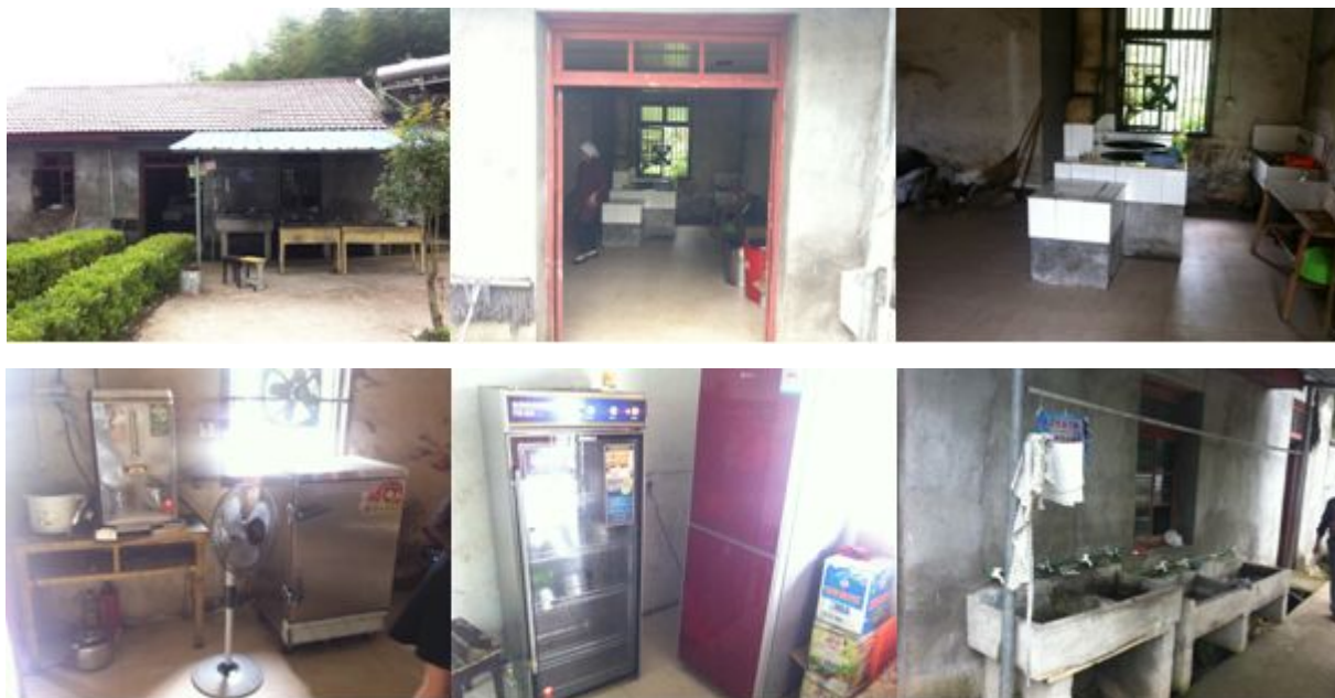
图 4 食堂和厨房情况组图

厨房隔壁的一间房子内设有洗手池, 供学生洗手, 所有学生在就餐前都会跑过去洗手, 洗完手后再排队领餐。在厨房外有四个水池, 开餐前厨师会将其中三个池子盛满水, 第一个兑洗洁精, 另外两个是清水, 用餐完毕后由一到六年级学生自己清洗, 清洗后放到最后一个水池中, 学前班的餐具由厨师负责清洗, 清洗干净后放到消毒柜中进行消毒。