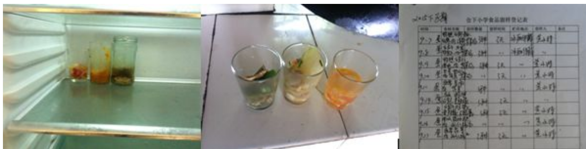
图 7 学校留样情况组图

(3) “浪费情况”项得 3 分, 原因是调查人现场看到个别学生倾倒饭菜比较多, 当天餐余也比较多。(如图 8)