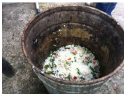
图 8 餐后厨余情况图