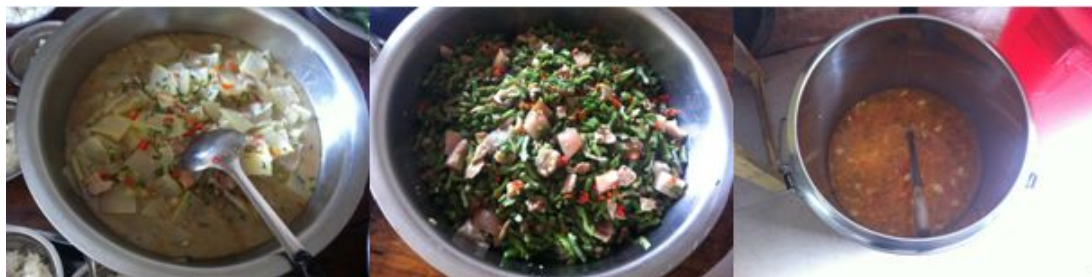
图6 开餐当日菜品组图