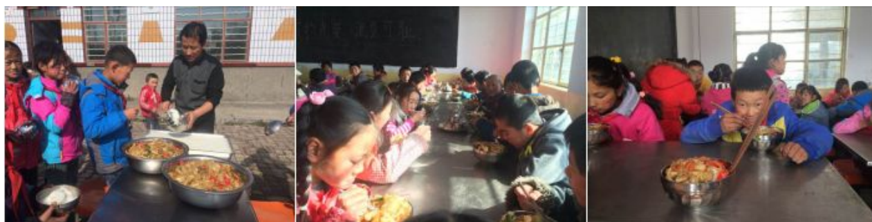
图 13 学生就餐现场