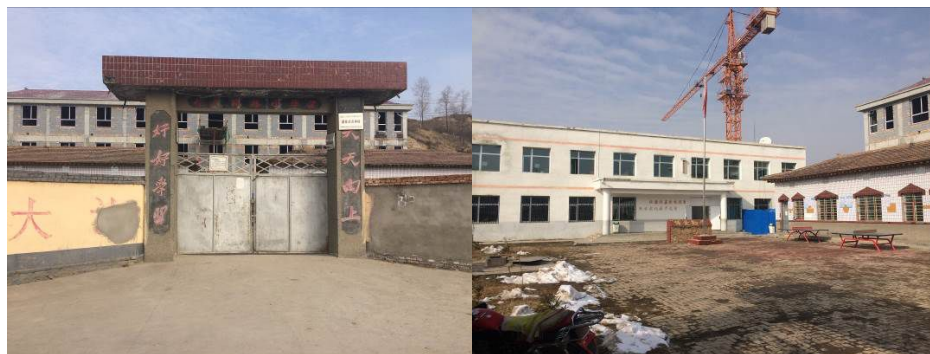
图 2 学校大门及校园环境