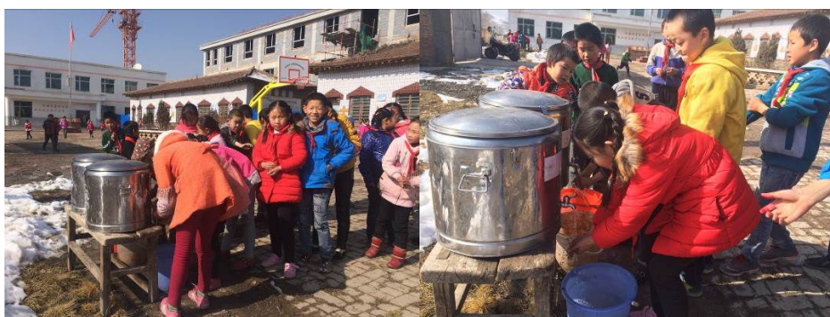
图 10 自觉洗手就餐的学生