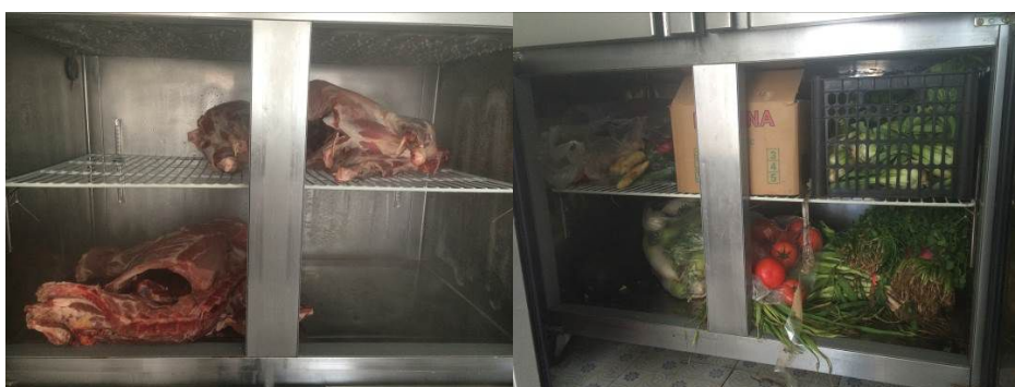
图 8 肉类及蔬菜类食材储藏