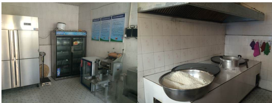
图 7 厨房整体环境及局部