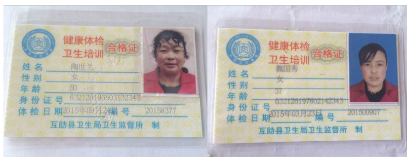
图 12 有效合格的炊事员健康证

评分说明: 调查当日, 该校整个执行管理环节表现良好, 本项予以全取满分 5 分;