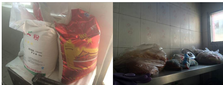
图 5 大米、面粉及部分调料类食材存放环境

关于“食材储存”，该校厨房没有单独的食材储藏室，除蔬菜及肉类食材冷藏于冰柜外，大米、面粉及部分调料类等需要防潮存放的食材则较为随意的堆放在厨房进门处及操作间的架子上（图 5），整个厨房工作状态时蒸汽缭绕，食材存在受潮隐患。根据稽核评分规则，该项评分取 3 分；