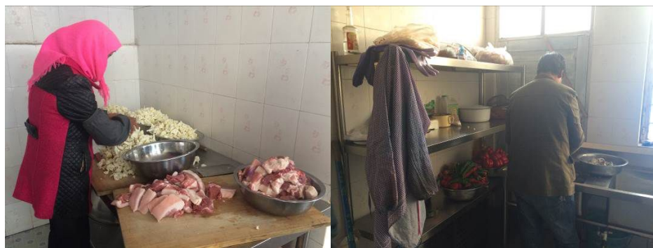
图 4 未规范着装的两名临时人员

关于“食材储存”，该校厨房没有单独的食材储藏室，除蔬菜及肉类食材冷藏于冰柜外，大米、面粉及部分调料类等需要防潮存放的食材则较为随意的堆放在厨房进门处及操作间的架子上（图 5），整个厨房工作状态时蒸汽缭绕，食材存在受潮隐患。根据稽核评分规则，该项评分取 3 分；