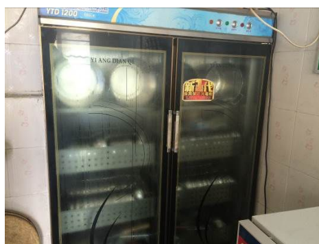
图 9 正常使用的餐具消毒柜及餐具