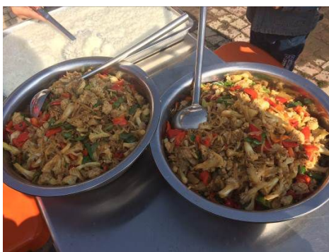
图 11 调查当日菜品