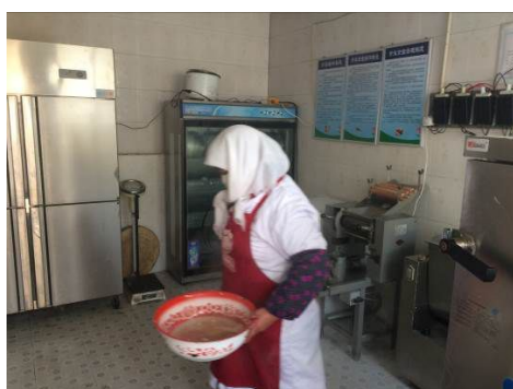
图 6 规范着装在岗的炊事员