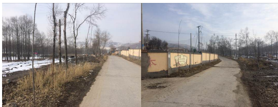
图1 大桦林小学周边路况

交通提示:西宁市至互助县交通方便,路况良好,快速公交全天运行;互助县至大桦林小学路段交通路况良好,公交车、出租车等均较多。