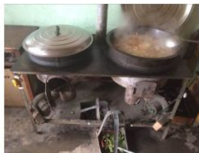
图5 厨房全景及灶台局部