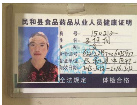
图9 有效合格的炊事员健康证