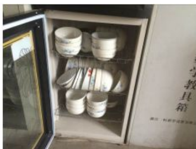
图6 存放着教职工餐具的消毒柜