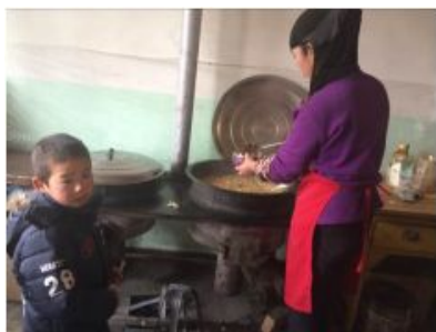
图4 未规范着装的炊事员

关于“食材储存”，该校位于厨房货架下层的面粉与蔬菜放置在同一层，且没有隔离措施，面粉袋子外观也较脏，存在受潮风险。根据稽核评分规则，该项评分取3分；（见图7）