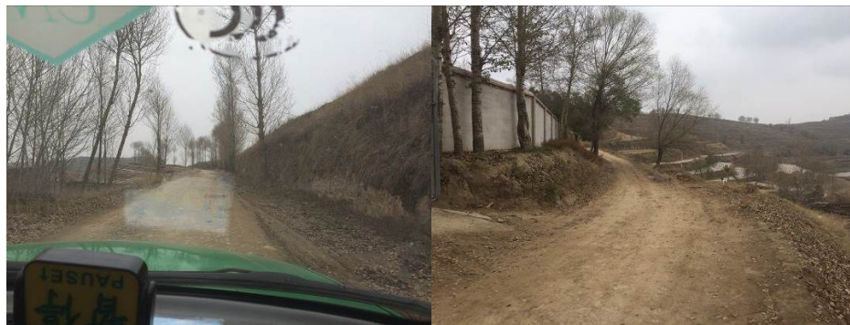
图1 韩家岭小学周边路况

11月11日上午,调查员自民和汽车站门口包车(往返240元)到达大庄乡韩家岭小学,车程约两小时。韩家岭小学所在的大庄乡位置偏僻,交通不便,日常营运班车仅有上午10点一趟。韩家岭小学所在的韩家岭村距离大庄乡尚有近20公里。民和县至大庄乡路况良好,全程硬化路面,大庄乡至韩家岭小学路况一般,路面硬化但路窄、弯道多。结束对该校调查后,调查员原路乘车返回民和县城。