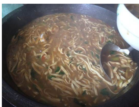
图 8 调查当日午餐面条

从本项调查的考核点来看, 调查当日该校午餐质量符合考核要求, 予以全取 5 分;