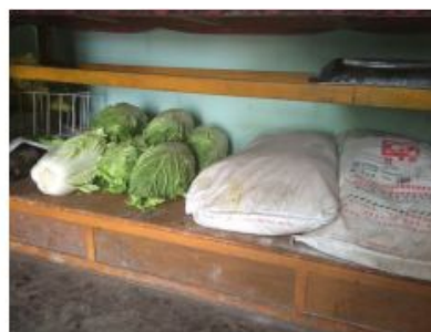
图7 面粉与蔬菜存放在同一层货架