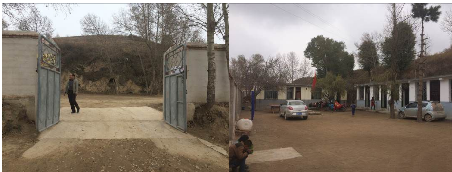
图 2 学校大门及校园环境