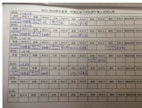
图 13 基本符合要求的入库记录