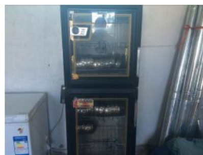
图7 正常使用的餐具消毒柜