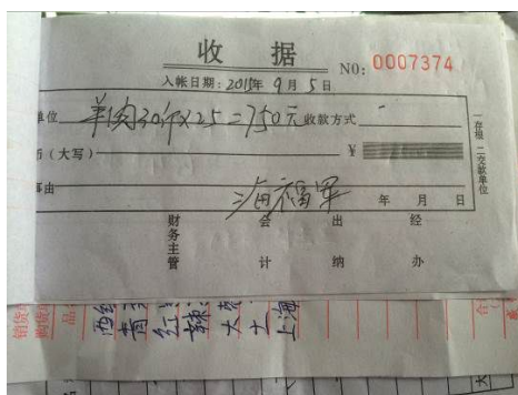
图 12 未完善签字信息的采购原始凭证

关于“出库记录”，该校日常未进行出库数据登记。根据稽核评分规则，该项评分取 1 分。