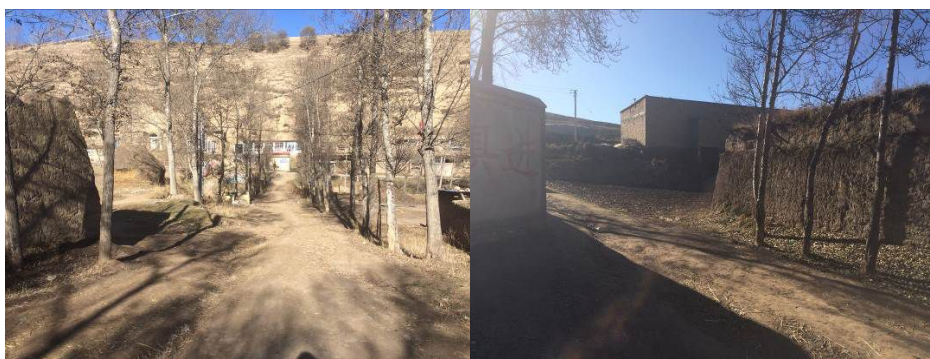
图1 孟家村小学周边路况

交通提示:孟家村小学所在的大庄乡位置偏僻,交通不便,日常营运班车仅有上午10点一趟。孟家村小学所在的孟家村距离大庄乡尚有近5公里,大庄乡距离周边乡镇也都相对较远。如自民和县城乘客车前往该校则会错过调查时间,故只能选择包车前往。民和县至大庄乡路况良好,全程硬化路面,大庄乡至孟家村小学路况一般,路面硬化但路窄、弯道多。