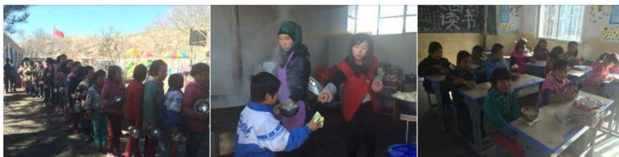
图 11 学生就餐现场