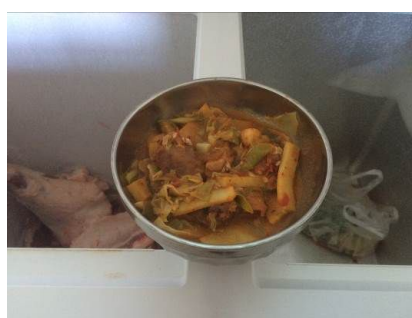
图 10 现场查见的食品留样