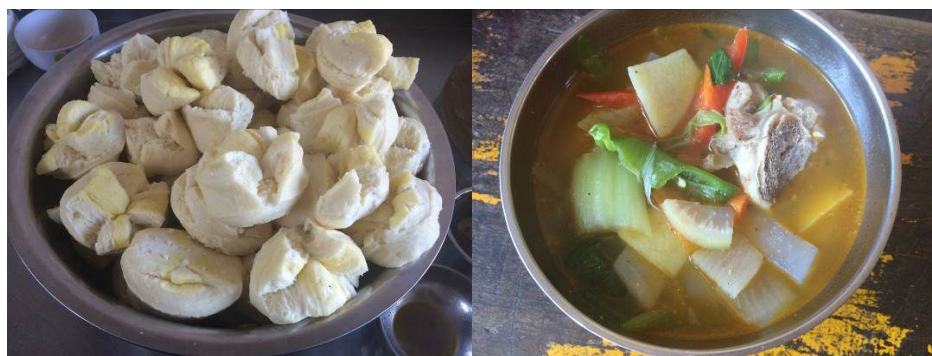
图 8 学生午餐

从本项调查的考核点来看, 调查当日该校午餐质量完全符合考核要求, 全取 5 分;