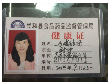
图 9 已过期的炊事员健康证

关于“食品留样”，调查当日，调查员在该校查见的食品留样取样范围不完整，并且与其他冷藏食材混放时未进行密封处理，视为无效留样。根据稽核评分规则，该项评分取 1 分；