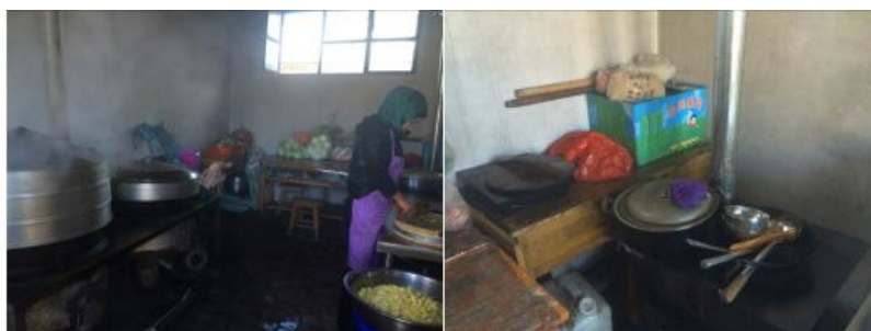
图5 厨房全景及灶台局部