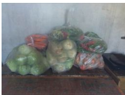
图6 规范的食材储存