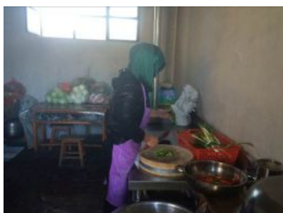
图4 未规范着装的炊事员

关于“墙地面卫生”,调查员发现厨房墙地面污渍及烟尘明显,卫生状况一般。根据稽核评分规则,该两项评分均取3分;