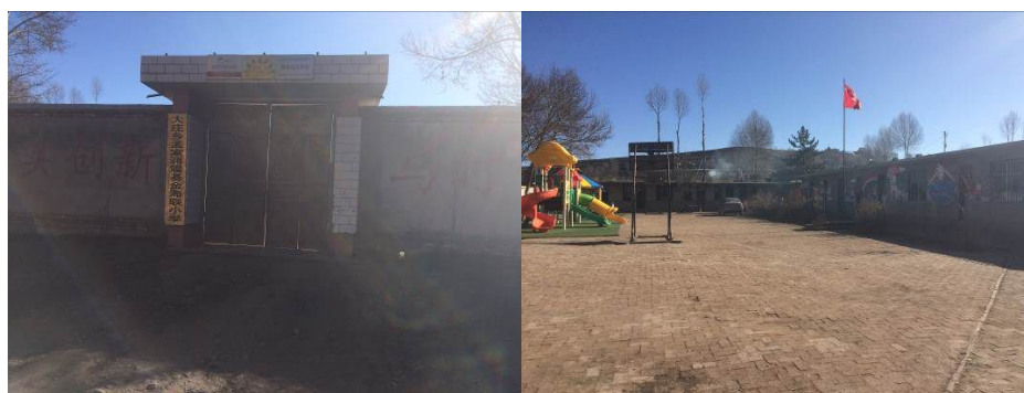
图2 学校大门及校园环境