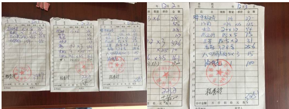
图 13 原始凭证组图

关于“入库记录”与“出库记录”，调查当日该校未向调查员出示相关台账，赵老师直言尚未完善。根据稽核评分规则，该两项评分均取 1 分；