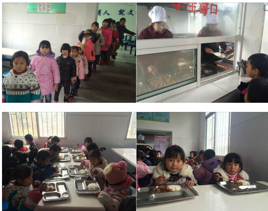
图 12 学生就餐现场情况组图