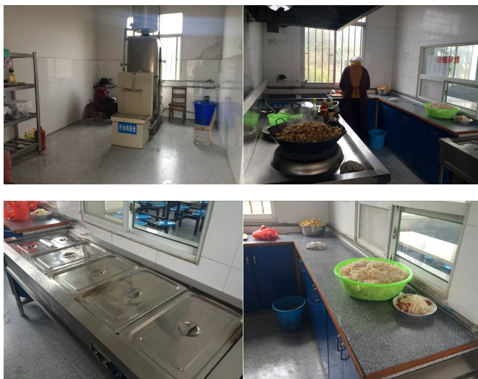
图5 厨房各区域情况组图