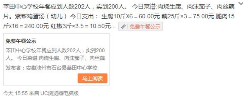
图 3 调查当日学校微博公示截图

调查人在厨房见到在岗炊事员 2 人, 赵主任向调查员提供该校应到教师人数 22 人, 当日全部在岗。调查当日该校午餐总就餐人数为: 学生 179 人+教师 22 人+炊事员 2 人=203 人。学校当日微博公示就餐总人数 200 人, 该校公示应到就餐人数是 202 人, 误差的 3 人, 校方解释是下属村小临时停课, 有 3 名二年级学生借读该校。