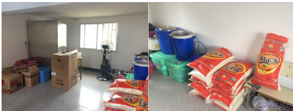
图 6 食材储藏室情况组图