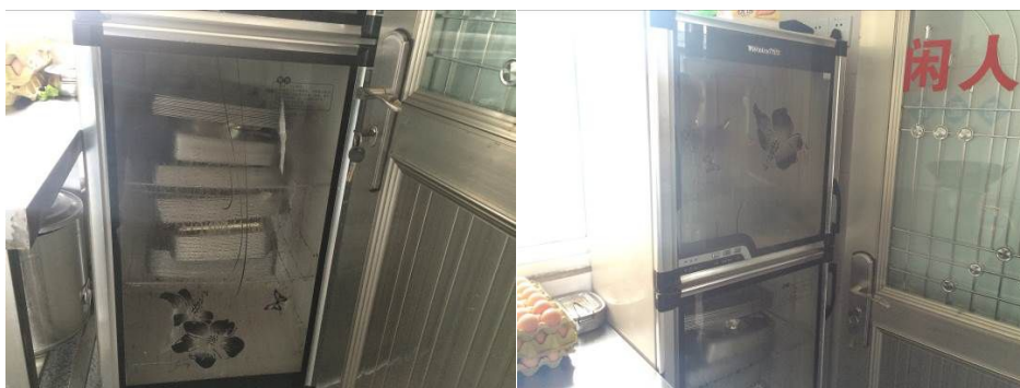
图 7 餐具消毒柜组图