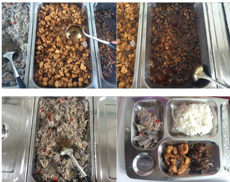
图 9 学生午餐饭菜组图

调查当日,该校午餐质量完全符合考核要求。根据稽核评分规则,本项考查予以全取满分 5 分;