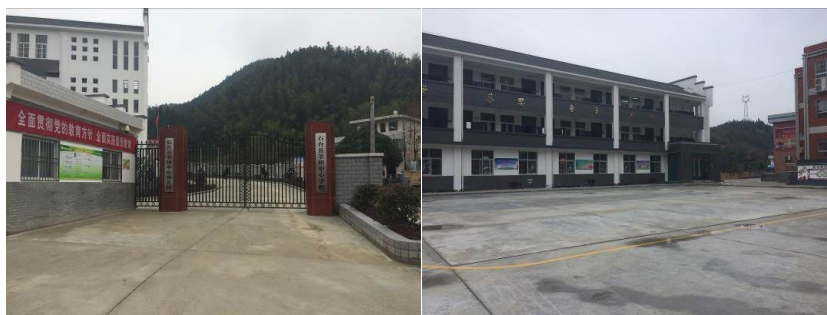
图 2 学校大门及校园环境