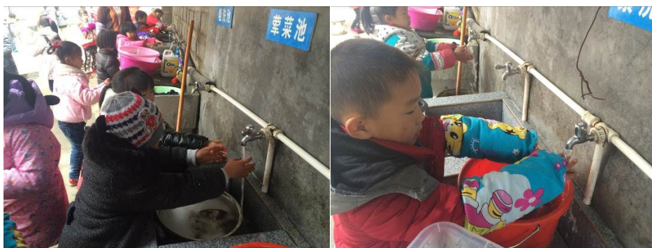
图 8 学生餐前洗手情况组图