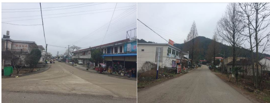
图1 莘田中心学校周边路况图

12月21日上午,调查员自石台汽车站乘坐前往东至县方向的客运班车,10时许,抵达莘田中心学校所在的莘田村路口,步行入校。自石台县至莘田中心学校交通路况良好,全程硬化路面。结束该校调查后,调查员乘顺车到达小河镇红石村路口,换乘过路客车返回石台县城。