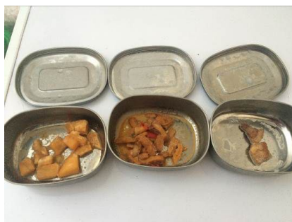
图 10 现场查见的食品留样情况图

关于“食品留样”,当日在厨房冰柜查看的食品留样取样数量不达标、取样范围不完整、无食品留样工作记录表,属无效留样。根据稽核评分规则,该项评分取 1 分;