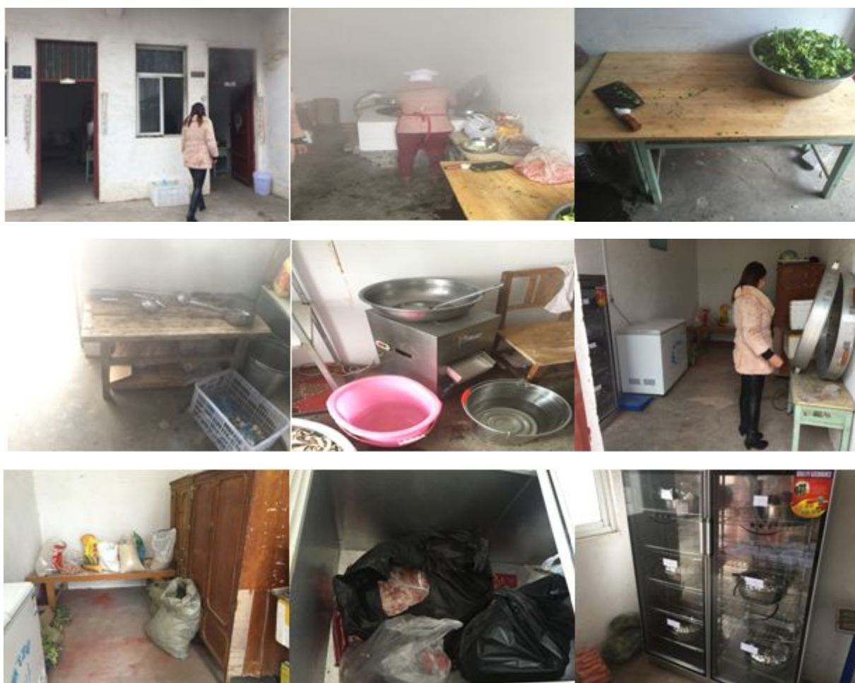
图 4 厨房和储藏间情况组图

学生餐前洗手环节，学前班老师会用盆盛水供学生洗手，其他年级学生在水池边洗手，但是由于天气比较冷，大部分学生没有进行餐前洗手。用餐结束后，学前班、一、二年级餐具由老师进行清洗，三至五年级的餐具由值日生进行清洗，清洗干净后放在消毒柜中每天消毒一次。