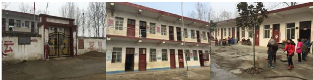
图 2 学校情况组图

广阳镇罗庄村罗庄小学所在地罗庄村袁庄组, 位于广阳镇东北部约 5 公里, 从广阳镇到罗庄小学虽为柏油路, 但由于年久失修, 路况较差, 广阳镇罗庄村罗庄小学是一所五年制村小, 目前共有 6 个年级 (含学前班)、6 个教学班, 学生 108 人, 教师 7 人。校长乾静雅, 负责微博、出入库、财务等开餐工作; 采购由刘帅景老师负责。学校中午 11:50 开餐。