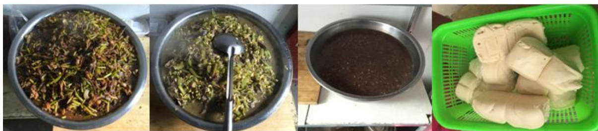
图 5 开餐当日菜品组图