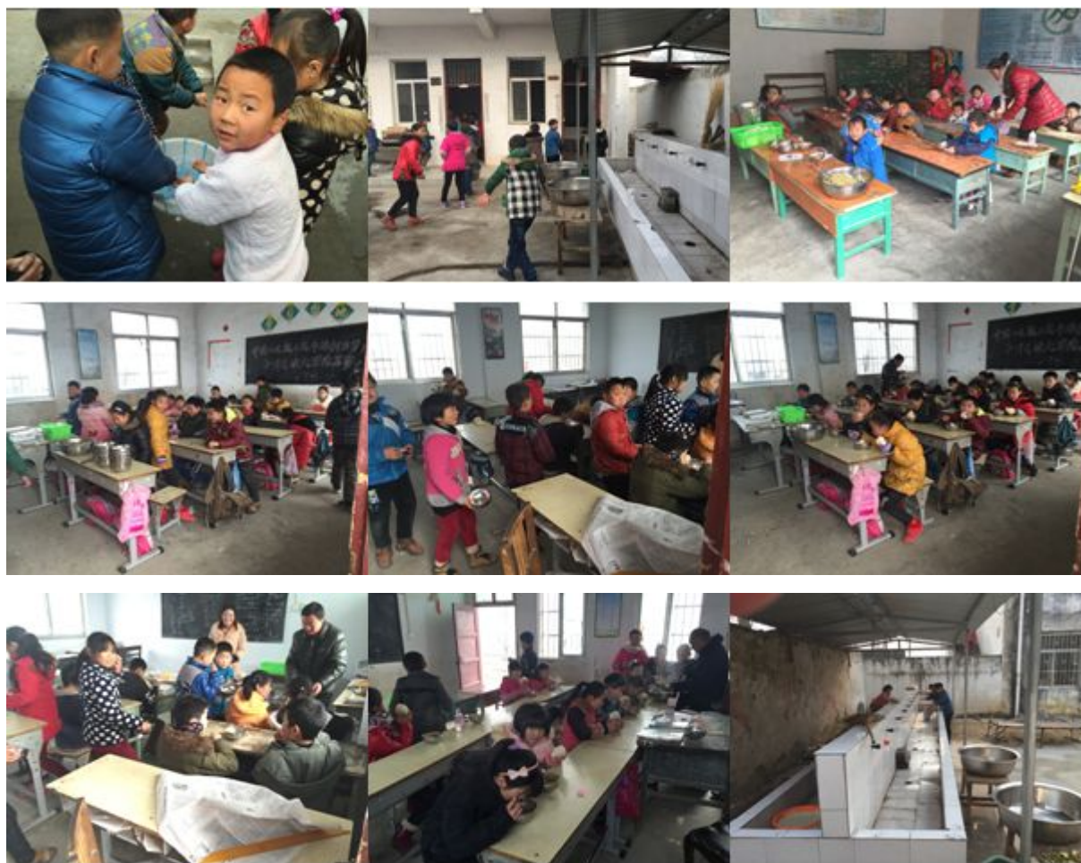
图 7 就餐过程组图