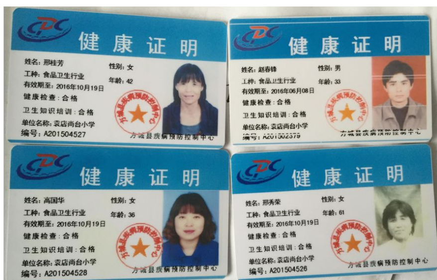
图 6 健康证图