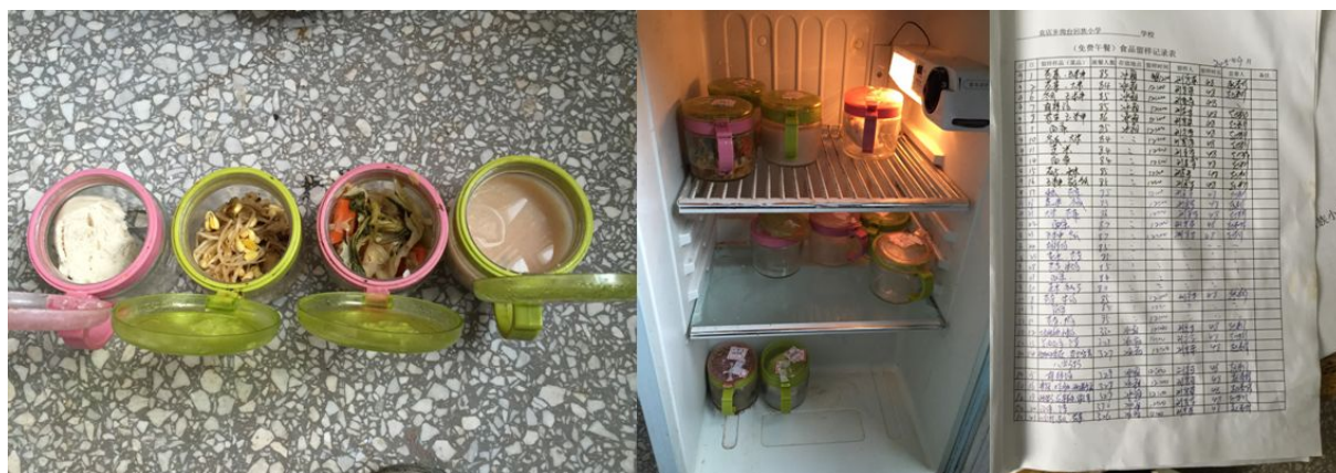
图 7 留样和留样记录组图