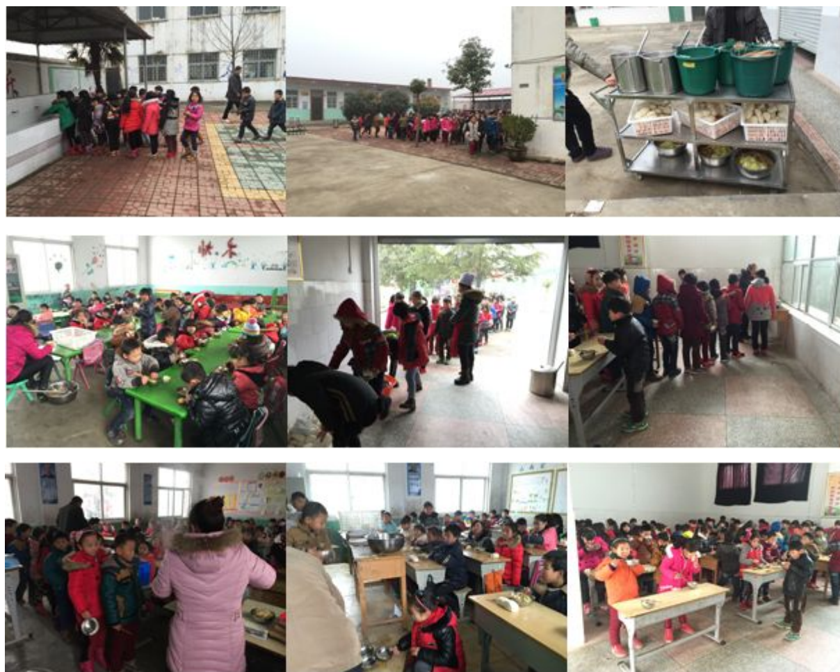
图 8 就餐过程组图