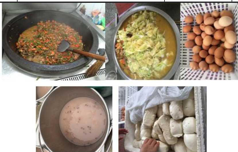
图 5 开餐当日菜品组图