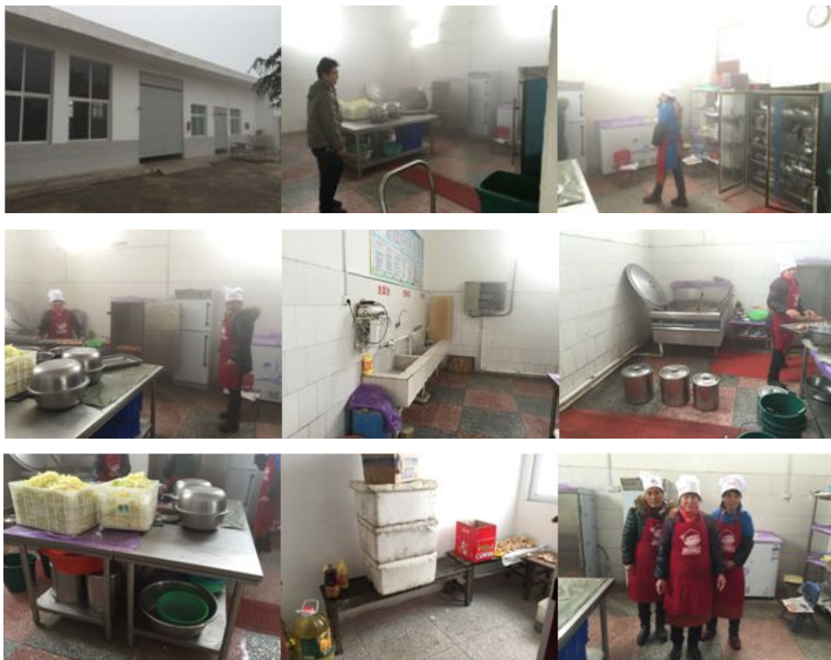
图 4 厨房和储藏间情况组图

学生餐前洗手环节, 学前班老师会用盆盛水供学生洗手, 其他的年级的学生下课后会排队到水池边洗手。用餐结束餐具由厨师负责清洗, 清洗干净后放在消毒柜中每天消毒一次。