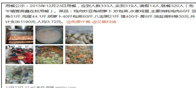
图 3 就餐人数的微博截图

当日就餐人数: 学生 306 人+教职工 13 人+调查人 1 人=320 人(调查人缴餐费 5 元), 与微博公示相同。