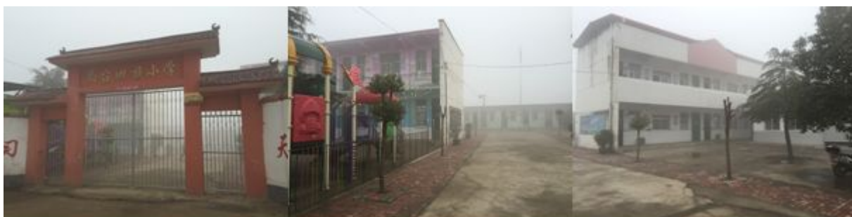
图 2 学校情况组图

尚台回族小学所在尚台村，位于袁店乡北部约 4 公里，从袁店乡到尚台村部分路段为泥土路，部分路段为新修水泥路，尚台回族小学是一所四年制村小，目前共有六个年级：幼儿园、学前班、一至四年级。校长贾进东，负责微博发布、财务管理、出入库记录等开餐工作：现金由赵春锋老师负责保管；入库的接收由赵春锋老师和邱恒祥老师负责；入库的验收由高尚增老师负责。该校现有教学班 8 个，幼儿园 1 个，学前班 3 个，一至四年级各 1 个，学生 319 人；在校教师 11 人。学校中午 11:50 开餐。