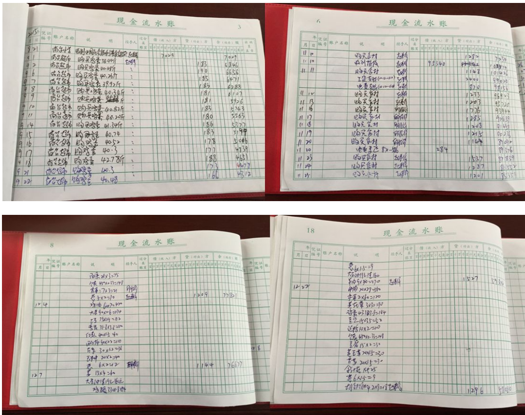
图 12 现金流水账组图