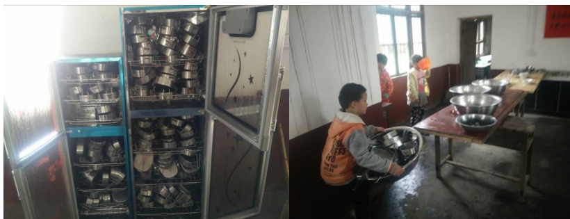
图 8 学生餐具的清洗与消毒组图