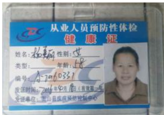
图 11 厨师健康证图