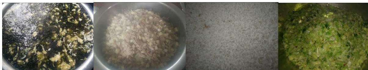
图 10 当日菜品组图