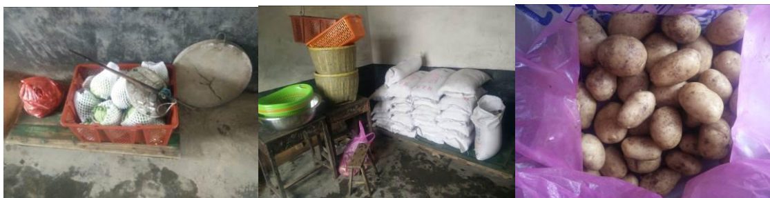
图 9 食材安全有序储藏组图