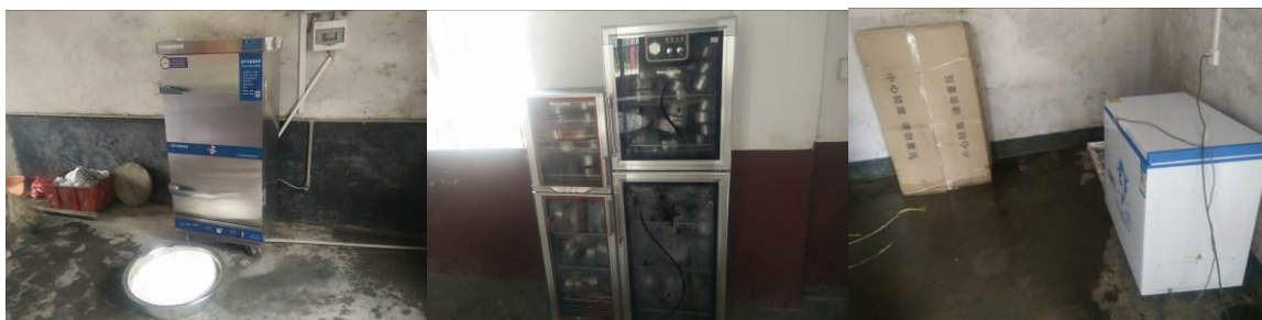
图 13 正常使用的厨房设备组图