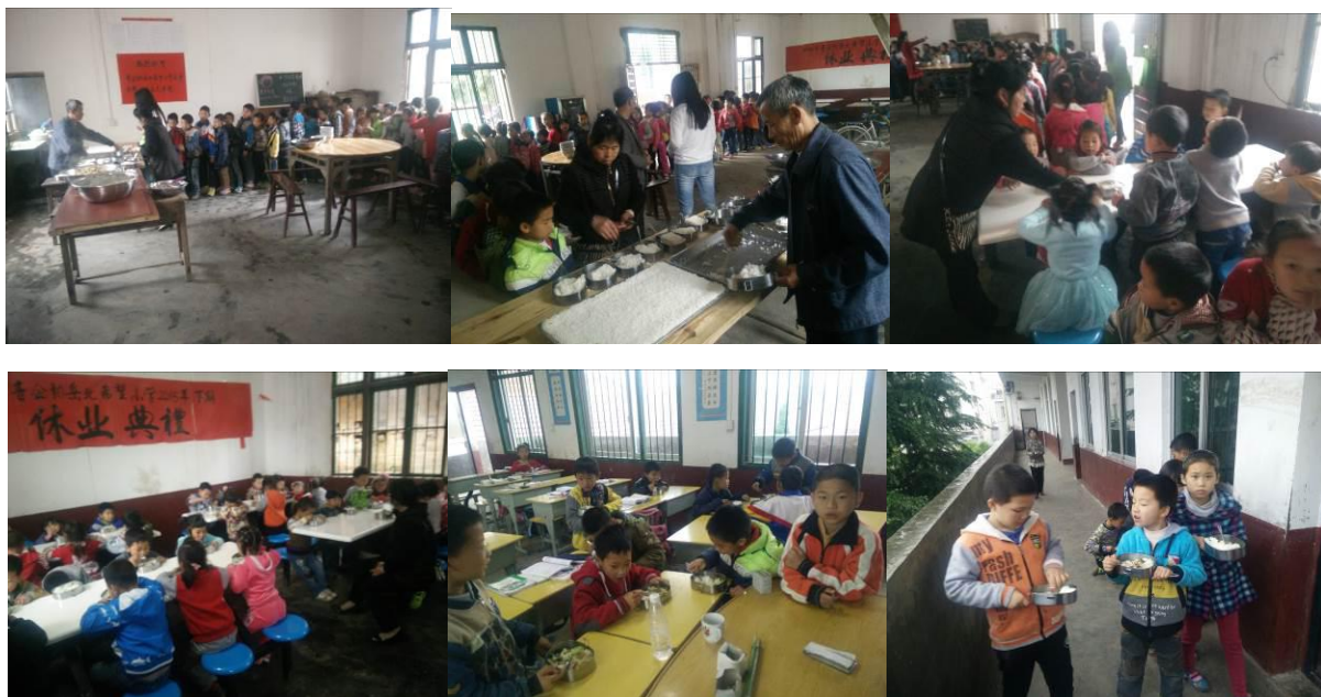
图 15 学生分餐、用餐情况组图