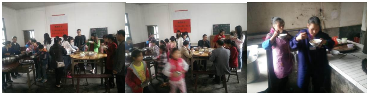
图 16 教职工用餐情况组图