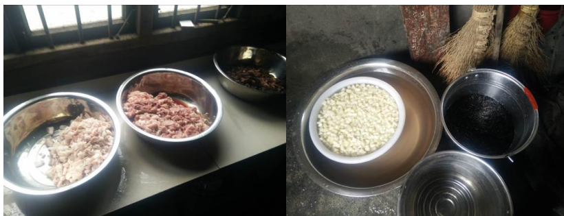
图 7 工作台生熟食分开组图