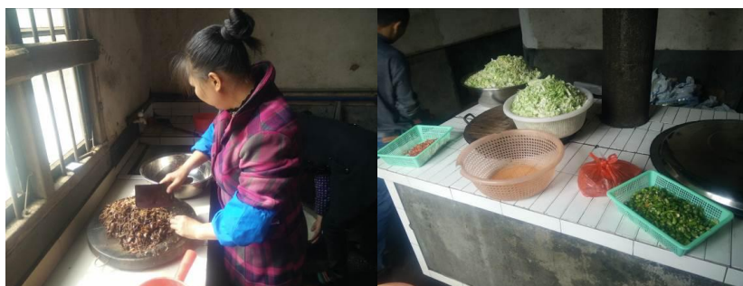
图6 厨房工作台组图