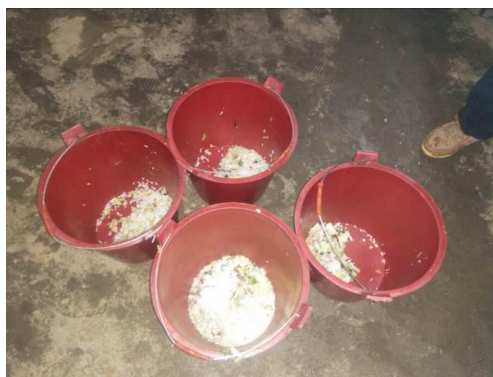
图 17 餐后的剩菜剩饭图