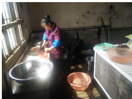
图4 厨工工作期间着装图

(3) “餐前洗手”取3分, 扣分原因为因近期学校食堂房屋正在维修施工, 学生餐前不方便洗手, 为无条件洗手。