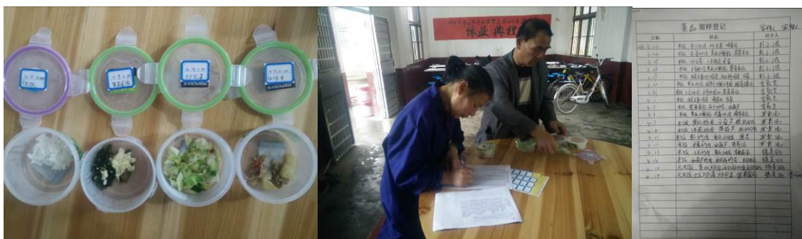
图 14 当天的菜品留样与登记组图