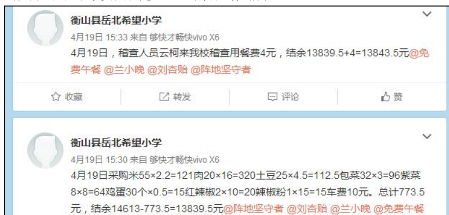
图 3 就餐人数的微博截图

当日就餐人数: 学生 181 人+教师 12 人+厨师 2 人+调查人 1 人=196 人, 稽核员缴午餐费 4 元, 微博公示中没有体现当日用餐人数情况。