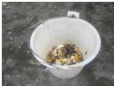
图 12 餐后的剩菜剩饭图