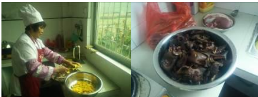
图 6 工作台生熟食分开组图