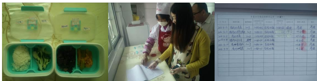
图 15 当天的菜品留样与登记组图