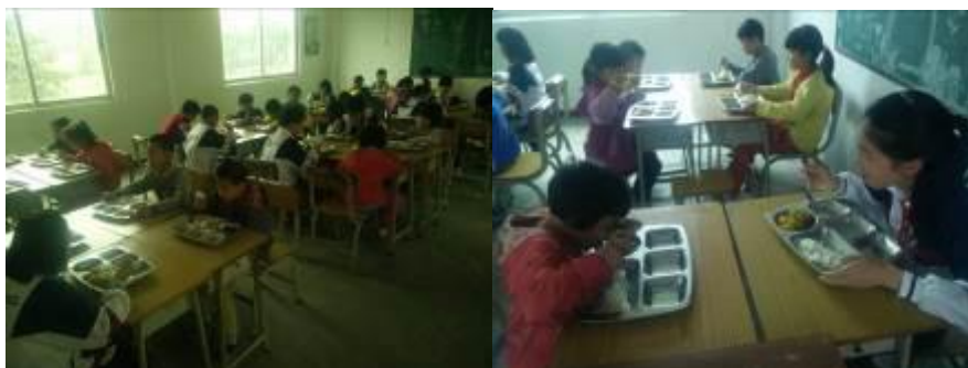
图 16 学生分餐、用餐情况组图