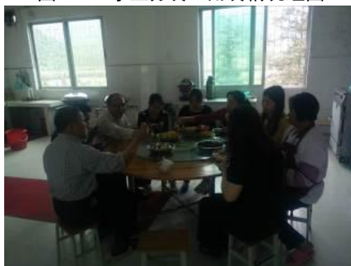
图 17 教职工用餐情况图