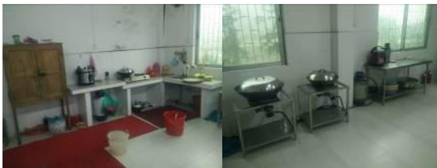
图 5 厨房工作台组图