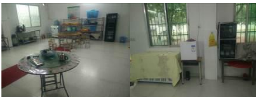
图 14 正常使用的厨房设备组图