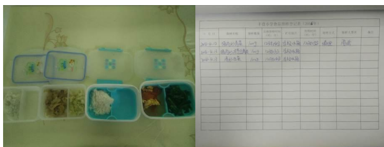
图 11 菜品留样与登记组图

(2)“浪费情况”取 3 分，扣分原因为通过观察餐后的剩菜剩饭情况与用餐人数比例相比较显的有些多，为浪费明显。（如图 12）