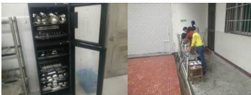
图 7 学生餐具的清洗与消毒组图