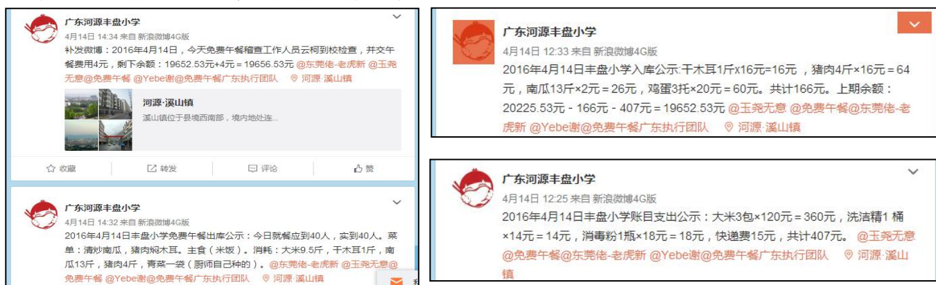
图 3 就餐人数的微博截图

当日就餐人数: 学生 31 人+教师 8 人+厨师 1 人+调查人 1 人=41 人, 稽核员缴午餐费 4 元, 微博公示与实际用餐人数一致。