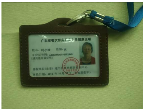
图 13 厨师健康证图