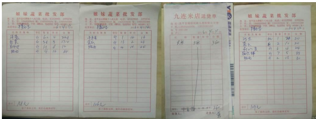
图 18 原始凭证组图