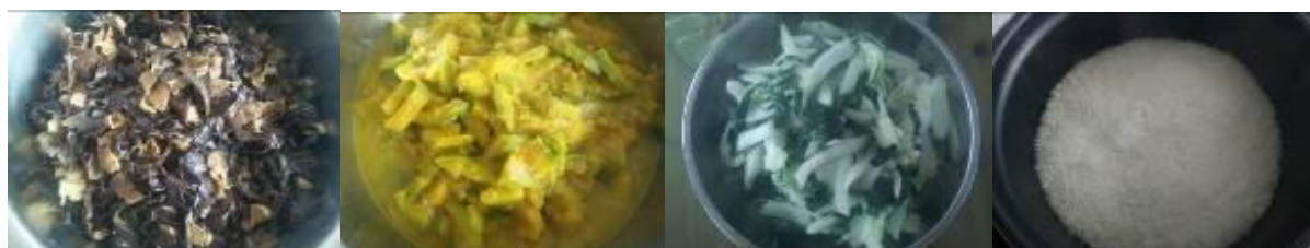
图 10 当日菜品组图