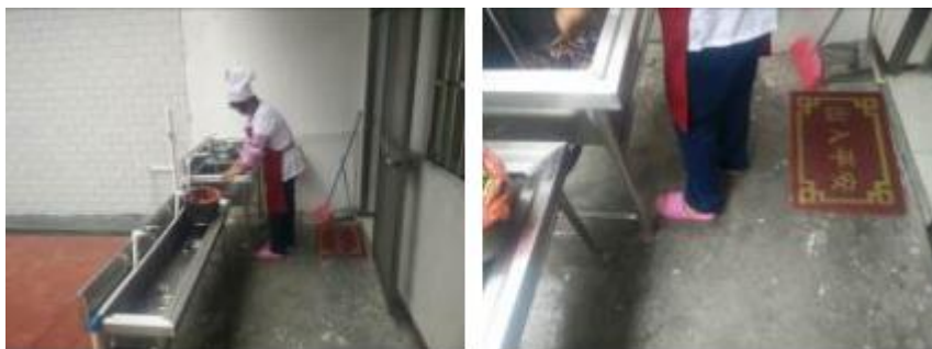
图 4 厨工着装工作组图