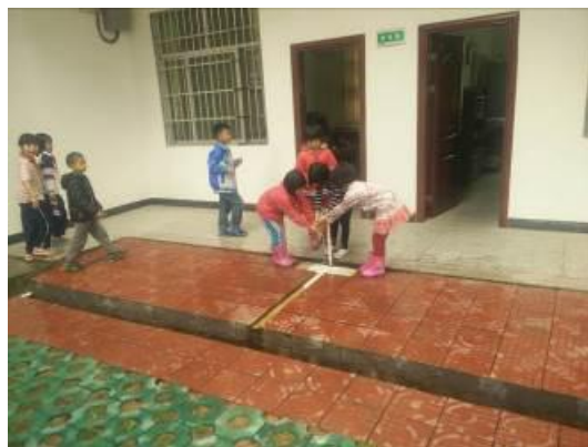
图9 学生餐前洗手图