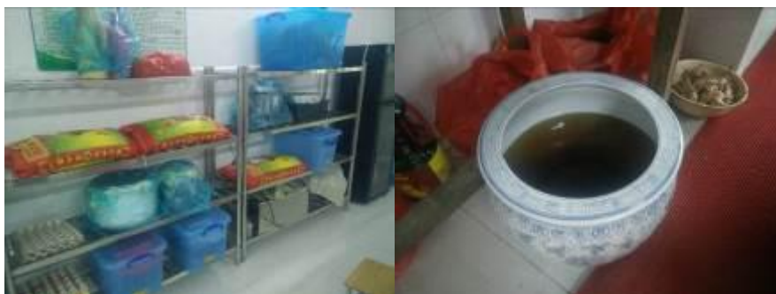
图 8 食材安全有序储藏组图