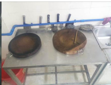
图 5 厨房工作台组图