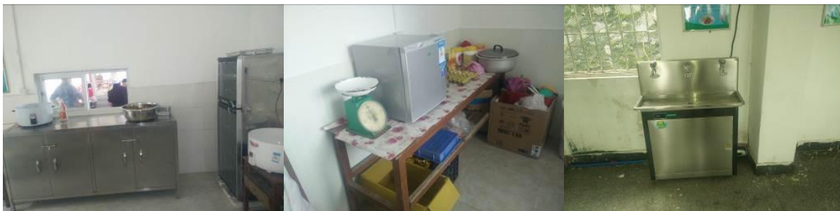
图 13 正常使用的厨房设备组图