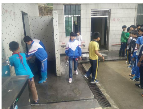
图9 学生餐前洗手组图