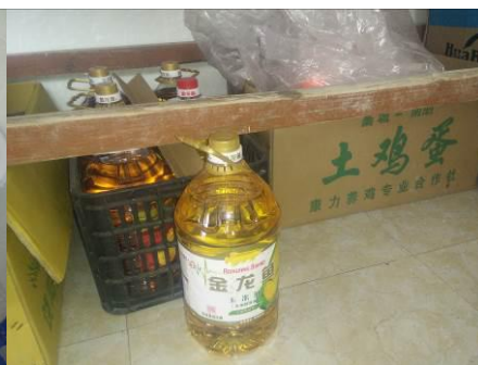
图 8 食材安全有序储藏组图