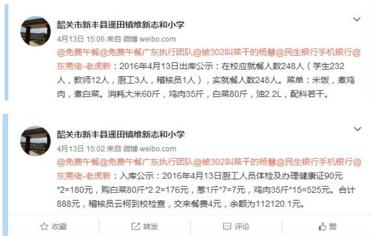
图 3 就餐人数的微博截图

调查人现场见到厨师 3 人，学校温笏金校长提供了教师 12 人，厨师 3 人。当日就餐人数：学生 232 人+教师 12 人+厨师 3 人+调查人 1 人=248 人，稽核员缴午餐费 4 元，微博公示与实际用餐人数一致。