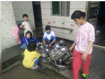
图 7 学生餐具的清洗与消毒组图