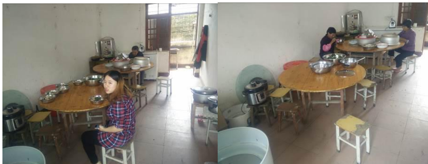
图 11 教职工用餐组图

(2)“师生同餐”取 3 分,扣分原因为老师有小食堂开小灶,且餐标高于学生餐标一半,只有部分负责老师在学生餐前进行试餐。(如图 11)