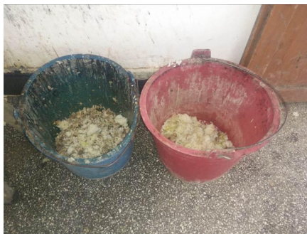
图 16 餐后的剩菜剩饭图