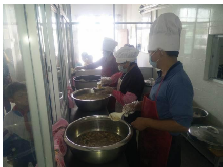
图 4 厨工正规着装工作图