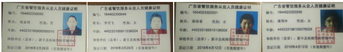
图 12 厨师健康证图