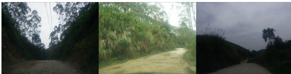
图1 维新村至遥田镇路况组图

交通提示:方案一是广州市至白沙镇、遥田镇7:10分有一趟直达班车,维新村距英德市白沙镇比遥田镇近些;方案二是广州市广园客运站至佛冈县为流水班车,佛冈县至白沙镇为流水班车;方案三是新丰县城至遥田镇有五趟班车,但路途需2个多小时,部分路况较差。