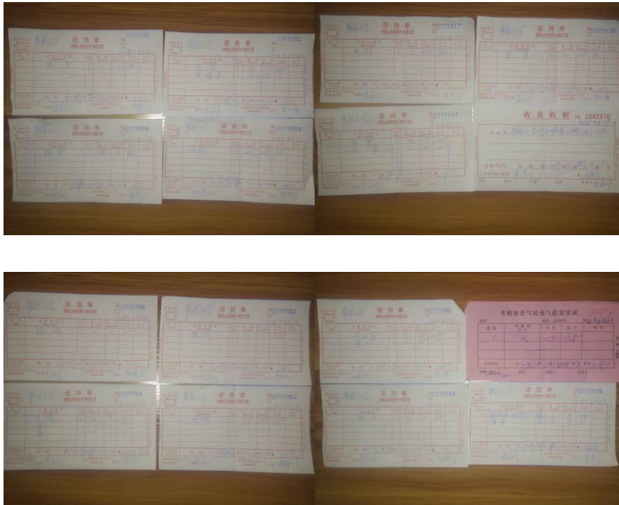
图 17 原始凭证组图