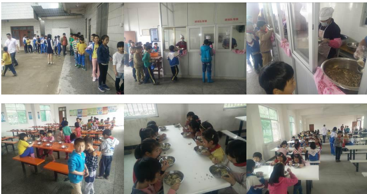
图 15 学生分餐、用餐情况组图