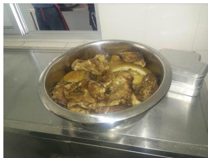
图 6 工作台生熟食分开图