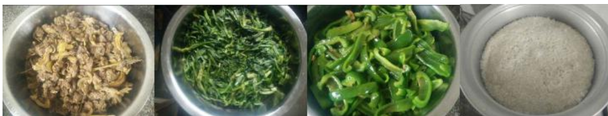
图 12 当日菜品组图