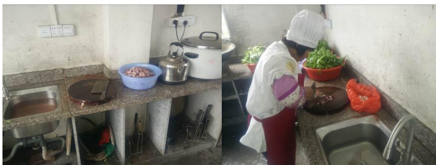
图 8 工作台生熟食分开组图