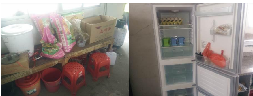
图 10 食材安全有序储藏组图