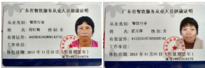
图 14 厨师健康证组图