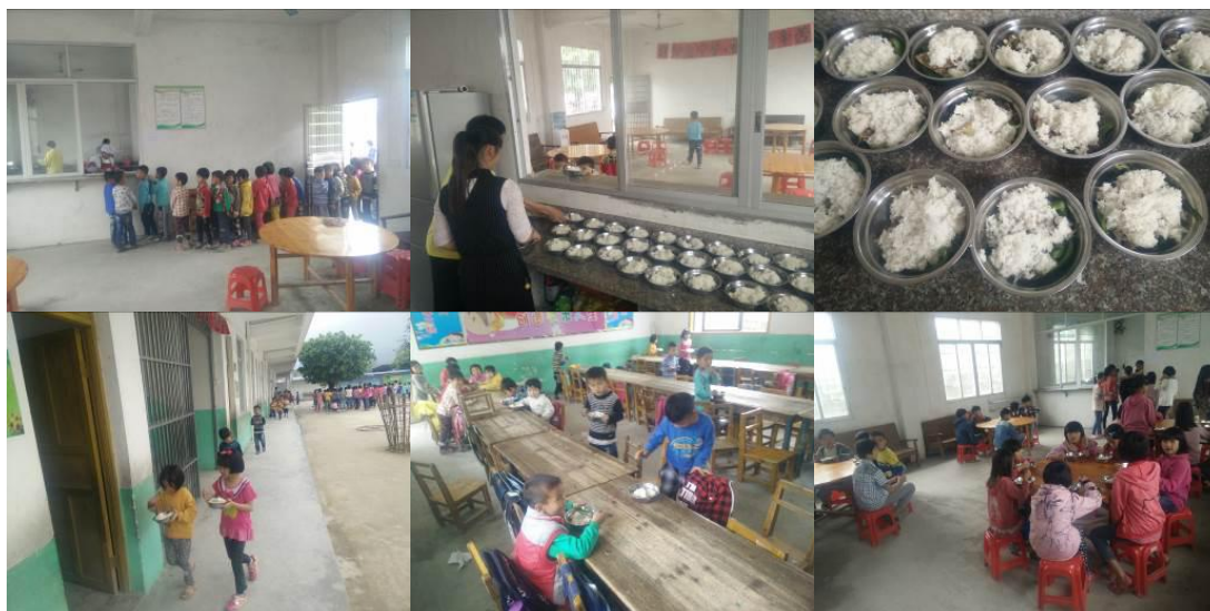
图 17 学生分餐、用餐情况组图