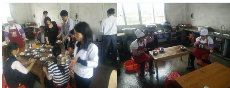
图 18 教职工用餐组图