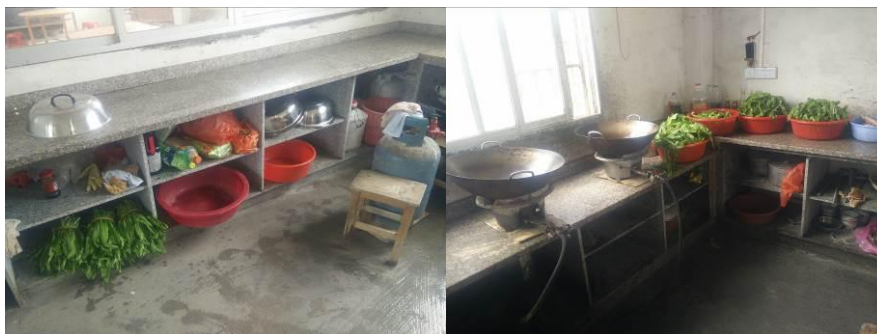
图 7 厨房工作台组图