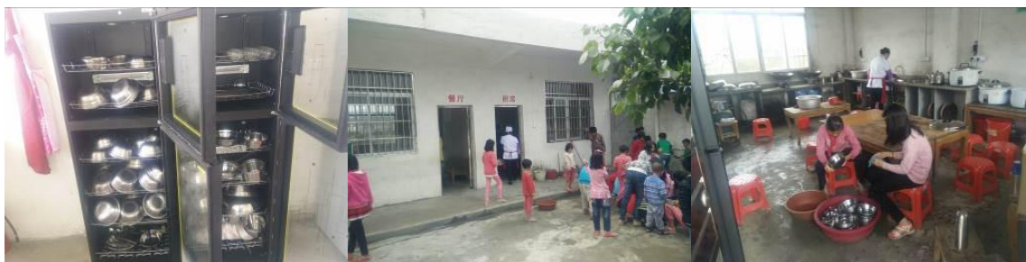
图 9 学生餐具的清洗与消毒组图