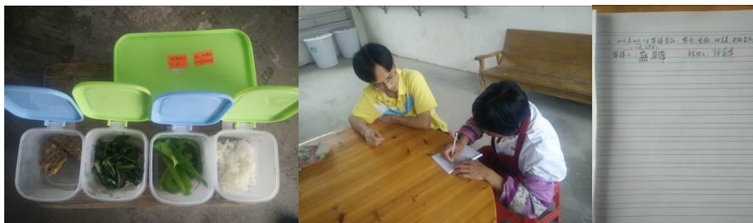
图 16 当天的菜品留样与登记组图