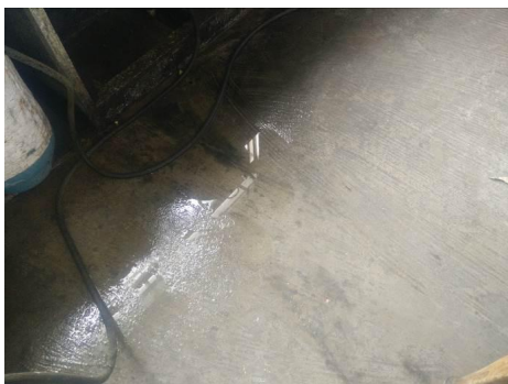
图 4 地面卫生图

(2) “墙面地面卫生”取 3 分, 扣分原因为操作间地面较湿且存有积水。(如图 4)