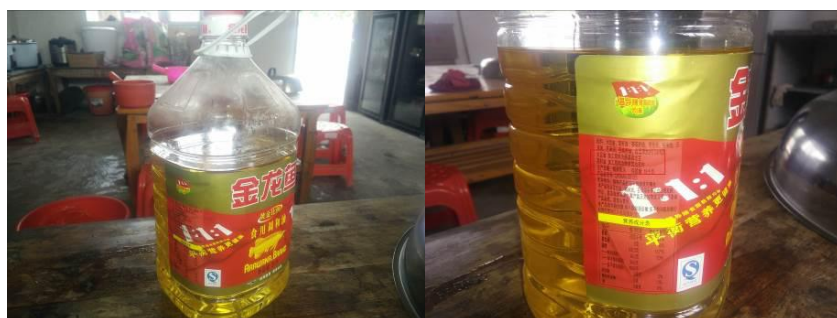
图 5 采购的食用油组图