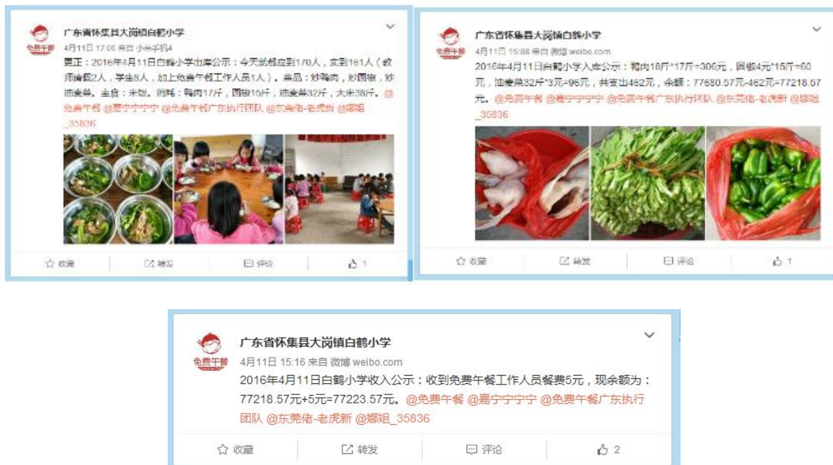
图 3 就餐人数的微博截图

当日就餐人数：学生 139 人（请假 6 人）+教师 21 人（请假 2）+厨师 2 人+调查人 1 人=163 人，稽核员缴午餐费 5 元，微博公示与实际用餐人数基本一致，学生请假人数有点误差。