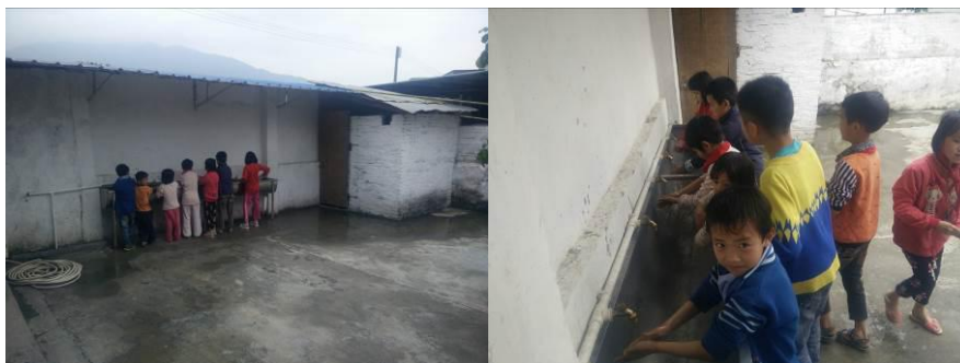
图 11 学生餐前洗手组图