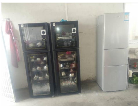
图 15 正常使用的厨房设备图