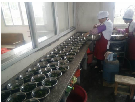
图 6 厨工正规着装工作图