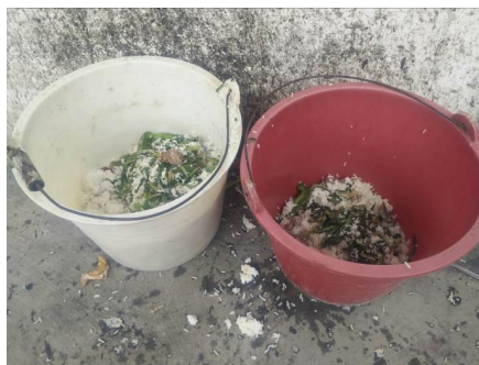
图 13 餐后的剩菜剩饭图