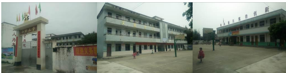
图 2 学校情况组图

厨房共有设备 14 台, 分别为: 免费午餐配备设备 (冰箱 1 台、消毒柜 2 台、煤气高压灶 2 台、高压锅 4 台、电饭锅 3 台), 自购设备 (电饭锅 2 台)。