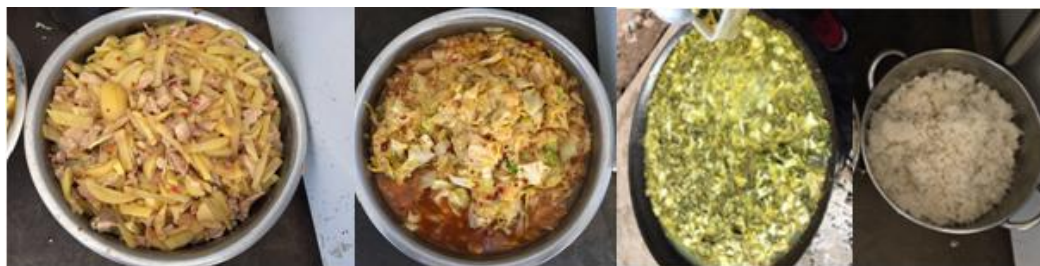
图 7 开餐当日菜品组图

“品总数量”项得 3 分，原因是该校食材品种简单，开学至今菜品基本上为土豆、莲花白和白菜。