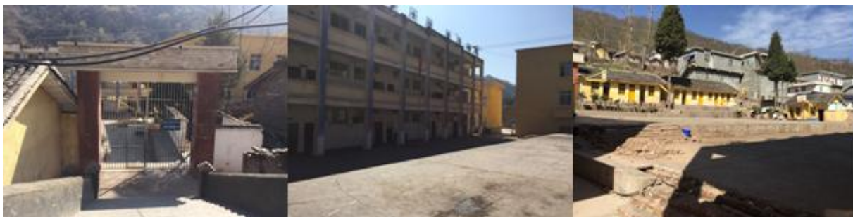
图 2 学校情况组图

采红乡中心小学现为一所六年制完小, 该校现有教学班 10 个, 学生 497 人, 全部享受国家营改餐。在校教师 17 人, 厨师 4 人, 共 21 人享受免费午餐。校长: 曲比阿子; 沙古曲伍老师负责发布微博和出入库记录; 沙古曲伍老师和米清安老师负责采购, 两人每周轮换一次, 由厨师长负责入库验收。采红乡中心小学已经修建完新校舍和厨房, 目前正在装修阶段, 预计九月份投入使用, 新修建厨房能够大大改善目前的环境。学校中午 12: 20 开餐。