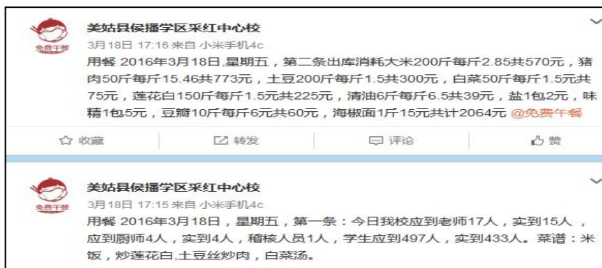
图 3 就餐人数的微博截图

当日就餐人数: 学生 432 人+教职工 19 人+调查人 1 人=452 人(调查工作人员缴餐费 5 元), 比微博公示少 1 人。