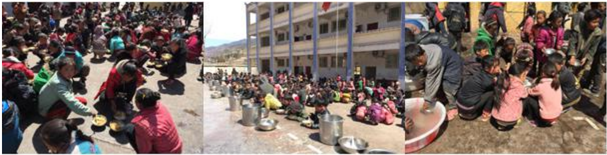
图 11 就餐过程组图