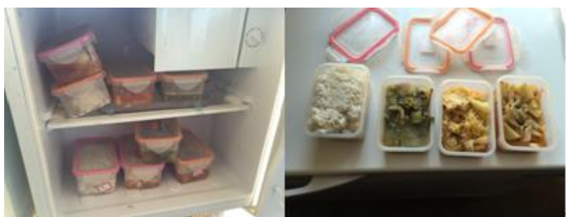
图 9 学校留样组图