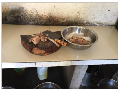
图 5 厨房墙面和地面情况图