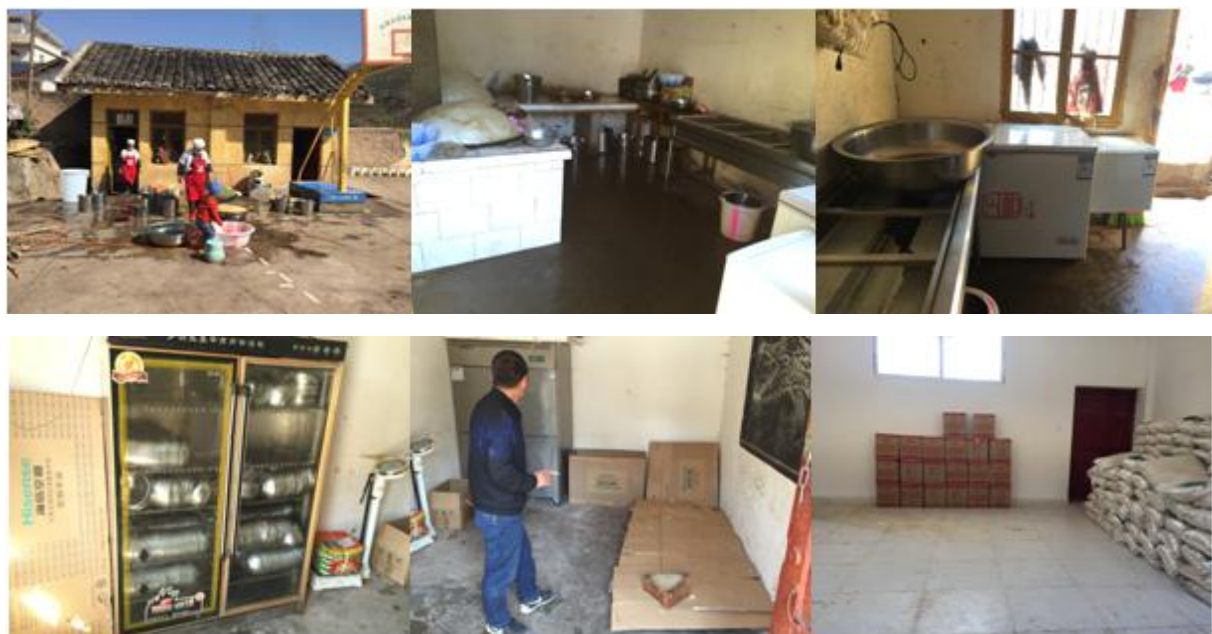
图4 厨房和储藏间情况组图

学生餐前洗手环节, 学校目前没有能够供学生餐前洗手的条件。用餐完餐具由学生自己清洗, 清洗完毕后放到消毒柜中进行保存, 其他厨具由厨师清洗。