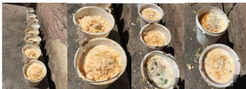
图 10 学校餐余组图