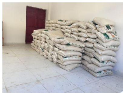
图 6 大米存放情况图